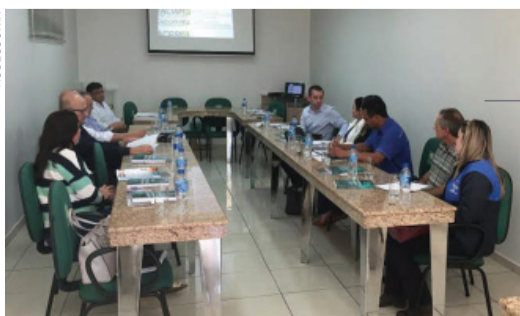
Reunião em Assis: foco em ações de estado e não de governo