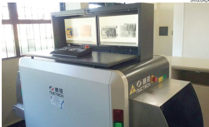
Ao todo, serão destinados mais de 60 equipamentos ao Paraná

Agentes penitenciários paranaenses ajudaram na segurança dos Jogos Olímpicos fazendo principalmente revistas no perímetro dos locais de realização das disputas. Eles fizeram parte de um grupo de agentes penitenciários recrutados para trabalhar em conjunto com a Força Nacional. Além dos agentes, cerca de 250 policiais civis e militares do Paraná compuseram o efetivo da Força Nacional.