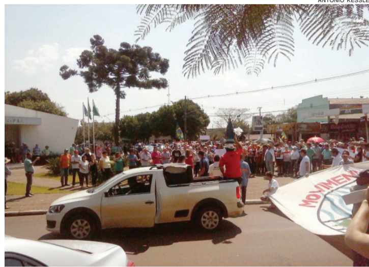
Em Capanema, atingidos protestaram na avenida principal

As famílias aguardam um posicionamento do consórcio quanto à correção no valor das indenizações em 22,59% e a aquisição de áreas para assentamento. “É preciso ressaltar que o agricultor que terá suas terras alagadas precisa ficar igual ou melhor do que estavam antes do avanço da obra. Por isso, o acordo