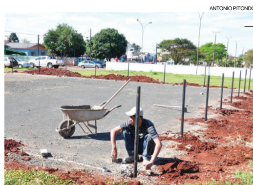
Os espaços contemplados ficam nas praças da prefeitura e Silvino Dal Bó, e nos Complexos Esportivos Hugo Puhl, Edy Roni Nandi e Liberalino Benedet

sitos da ABNT, adotam tecnologia alternativa, aproveitamento material plástico reciclável, mais resistente a pragas, corrosão, umidade e farpas. Segundo a Secretaria de Agropecuária e Meio Ambiente, os novos playgrounds serão instalados visando a segurança das crianças.