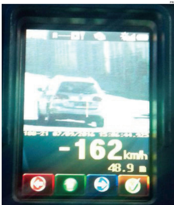
Em seis dias a PRF lavrou 5,1 mil flagrantes de alta velocidade

tas em acidentes neste ano perderam a vida em colisões frontais e nove delas no período noturno. Não houve nenhuma morte em atropelamento nem em colisões fron-