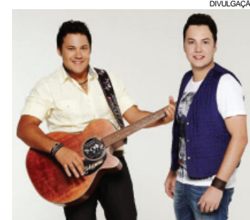
Dupla João Bosco e Vinícius fará show no dia 29 de outubro

A edição 2016 da ExpoPalotina é promovida por um conselho que envolve a participação de 56 entidades, entre elas Acipa e Sociedade Rural, contando com apoio da Prefeitura Municipal e Câmara de Vereadores. A exemplo dos anos anteriores não será cobrado ingresso para acesso ao Parque de Exposições João Leopoldo Jacomel. A ExpoPalotina terá ainda exposições, festival gastronômico, parque de diversões, apresentação de valores locais e outras atrações.