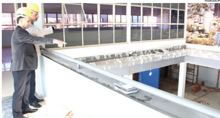
Valdir e Leandro acompanham início das obras readequação do prédio, que vai abrigar o Sicoob Credicapital

mais de 15 anos, o Sicoob Credicapital tem 17 mil cooperados e atua em várias cidades do Oeste e do Médio-Centro-Oeste do Paraná. O contrato de locação com a Acic poderá ser renovado, por igual período, no fim do prazo inicial de dez anos.