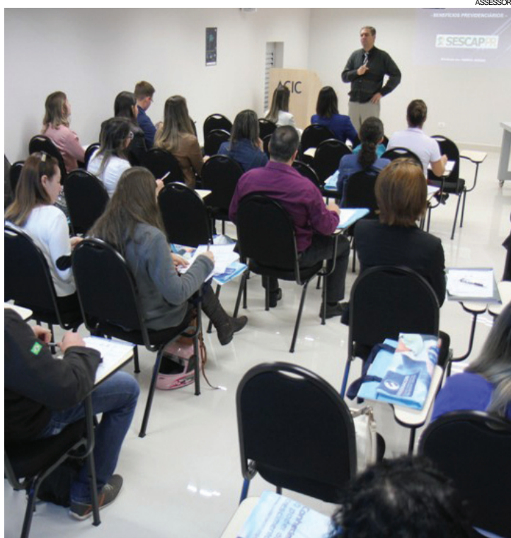
Curso sobre os Benefícios Previdenciários realizado pelo Sescap

de 2016 e medida provisória 739, de 7 de julho de 2016, sobre a alteração de carências para recuperação da capacidade do segurado.