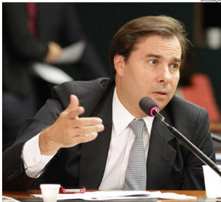
Rodrigo Maia, presidente da Câmara Federal

Aliados pressionaram o Palácio do Planalto a enviar sua proposta de reforma da Previdência só após as eleições, por temer que mudanças impopulares nessa área sejam usadas contra os candidatos dos partidos governistas. Temer anunciou que enviará o texto até o fim de setembro.