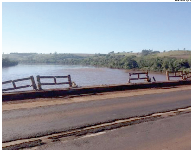
Ponte em trecho movimentado em Assis. Estrutura não inspira confiança

A falta de programas de manutenção em estruturas públicas, a partir de medidas preventivas, é cultural no País e isso custa vidas e onera ainda mais o contribuinte, diz um empresário de Assis que prefere não revelar o nome. “Não é só ponte ou estrada. Qualquer estrutura pública, com exceção das novas, têm problemas. Reparos são feitos anos depois do indicado e, na maioria das vezes, após alguma tragédia. É só ver o que ocorre também nos hospitais...”. Em 2014, o Dnit informou que recuperaria 2,5 mil pontes pelo Brasil, ao custo de R$ 5,8 bilhões. Com os escândalos que atingiram a União e secaram o caixa, praticamente nada foi feito.