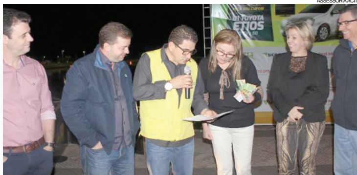
Diretores revelam ganhadores: campanha estimula o comércio de Toledo