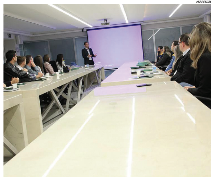
Assessoria Leoveraldo explica papel da Caciopar, que representa 46 Aces, em encontro com consultores

O programa transforma concorrentes em parceiros que, então, passam a organizar capacitações, viagens técnicas e até compras e vendas conjuntas. A Associação Comercial e Industrial de Cascavel foi a primeira no Paraná a apostar na novidade. Ela criou em 1998 o primeiro núcleo setorial do município e também do Estado, o Moveleiro.