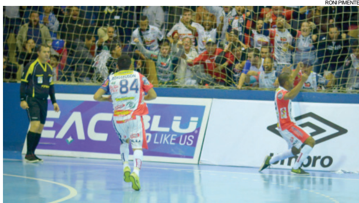
Cascavel Futsal conta com a torcida contra o Guarapuava

dual e os cascavelenses pela Liga, ambos como mandantes) e um empate (no Ginásio da Neva, pelo Paranaense).