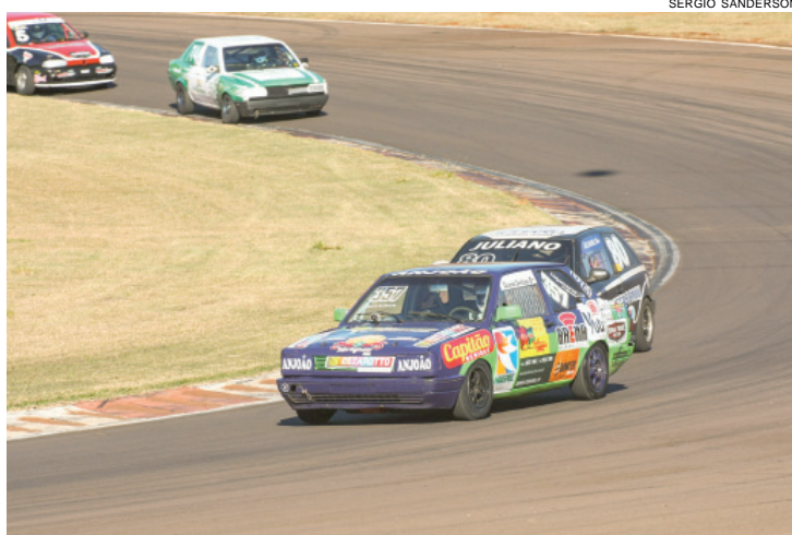
Eduardo Zambiasi disputou a categoria Turismo 1.600 no Metropolitano de Cascavel com um Volkswagen Voyage

Já Menegaz retornou às pistas na última etapa do Metropolitano, depois de cinco anos de ausência. A expectativa da dupla é largar no pelotão intermediário e brigar pelo pódio.