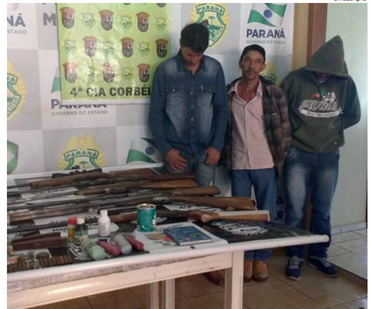
As três prisões em flagrante foram feitas no município de Iguatu

do de justiça) mais uma arma e também uma agenda com nomes e locais de votação de 60 eleitores, o que pode caracterizar tentativa de compra de votos. Por conta disso, o delegado Rogerson determinou a abertura de inquérito paralelo para apurar os fatos.