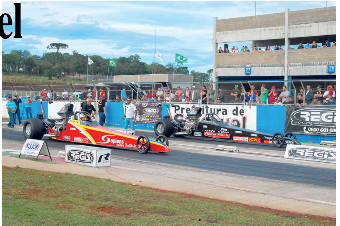
O confronto dos dragsters será a maior atração do fim de semana de arrancadas em Cascavel

Os melhores carros e pilotos da arrancada serão vistos hoje e amanhã no autódromo cascavelense, na 4ª e última etapa do Campeonato Paranaense de 201 Metros. A prova tem promoção e organização do Automóvel Clube de Cascavel, com supervisão da FPrA (Federação Paranaense de Automobilismo). O ingresso para hoje ou só para amanhã custa R$ 15 e para os dois dias R$ 20. Já a credencial custa R$ 50 para os dois dias.