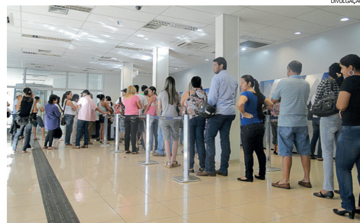
Conforme projeto municipal, espera não pode passar de 20 minutos