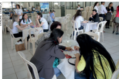
Ontem a Agência do Trabalhador realizou o Dia D para contratação de pessoas com necessidades especiais