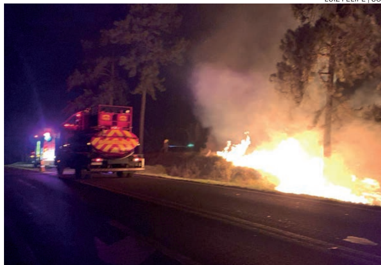
LUIZ FELIPE | SOT

A orientação para a população nesse período mais seco, para evitar esse tipo de incêndio