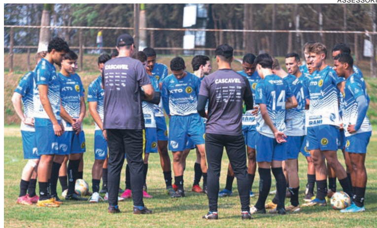
Cascavel joga em Santa Catarina para manter boa fase do sub-20

A primeira rodada será completa hoje, com Curitiba x Figueirense. Nos jogos dispu-