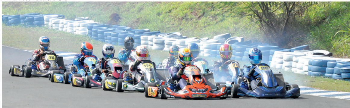
Kartódromo Luigi Borghesi receberá o Campeonato Brasileiro em novembro

os pilotos das categorias 2 Tempos deverão adquirir na secretaria de prova – e lacrar – um jogo de pneus novos MG, enquanto a F4, Mirim e Cadete deverão lacrar um jogo MG novo – adquirido obrigatoriamente na secretaria – ou usado.