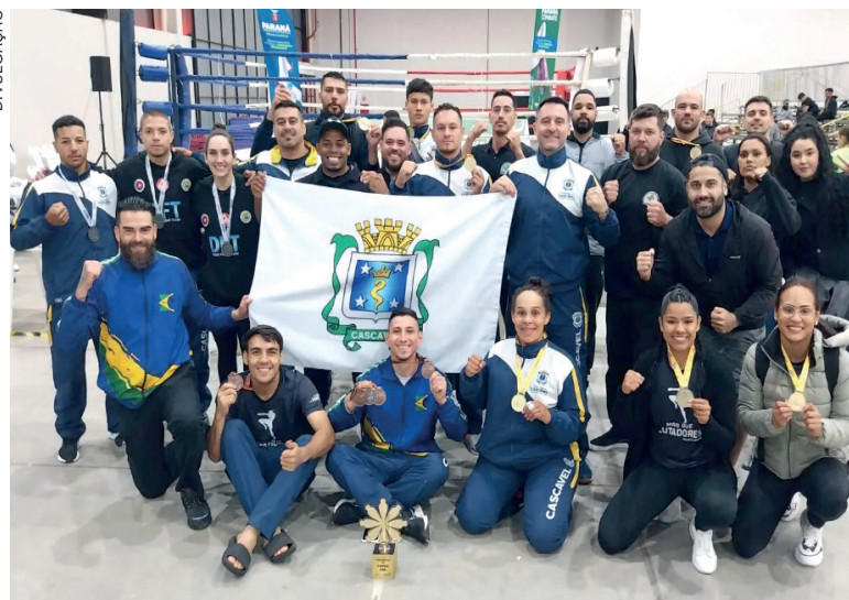
Atletas de Cascavel celebram mais um título nos Jogos Oficiais

nas categorias Juventude (de 15 a 17 anos) e Adulto (acima dos 18 anos). O Paraná Combate foi realizado em parceria das federações das modalidades, rendendo pontos importantes no ranking individual dos atletas, e contou com 250 árbitros profissionais do esporte.