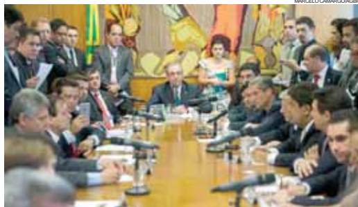
Cunha definiu que todos os partidos estarão representados na comissão

O PMDB terá oito representantes e seu bloco, integrado também por PP, PTB, DEM, PRB, SDD, PSC, PHS, PTN, PMN, PRP, PSDC, PEM, PRTB, ficará com um total de 25s.