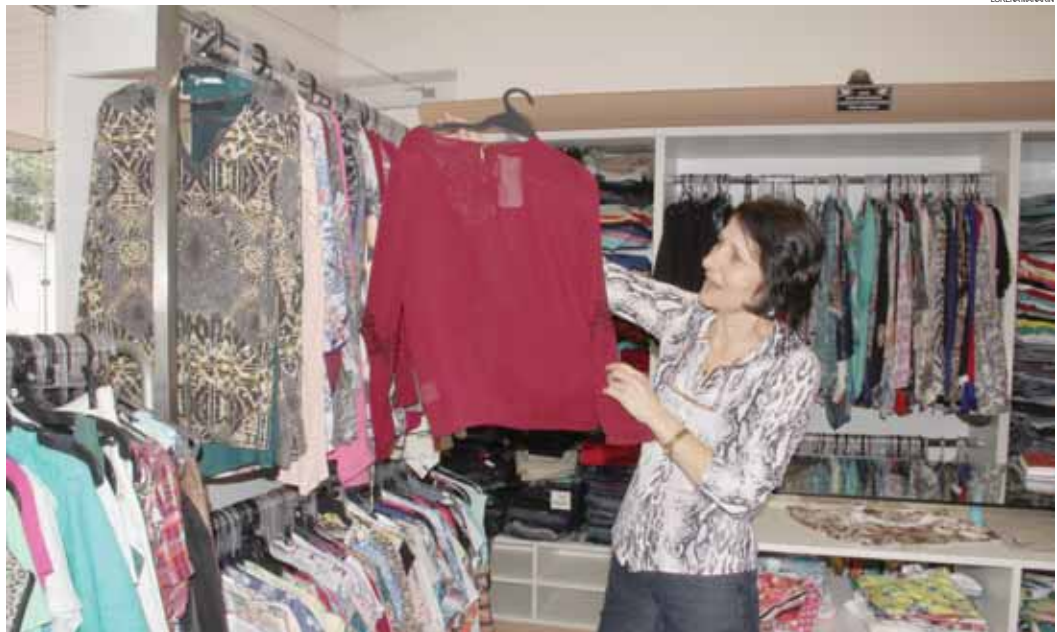
Vendedores esperam maior movimento apenas para a semana que vem

No estabelecimento não houve mudança significativa nas vendas se comparado ao movimento da semana passada. Para a comerciante, a expectativa é de melhora a partir da semana que vem, quando o comércio atenderá em horário estendido devido ao fim do ano. Reflexo do mo-