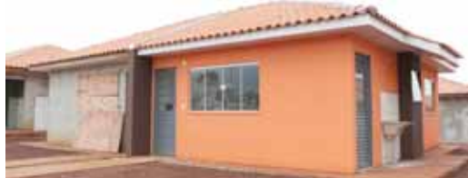
Os futuros moradores do conjunto contarão com toda a infraestrutura