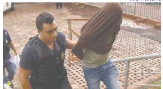
Os presos da nova etapa da Publicano foram levados para Londrina

(35 deles já implicados nas fases anteriores da Publicano), um advogado, um empresário e um intermediador. Os demais eram de condução coercitiva (em que o suspeito é levado para prestar depoimento e depois liberado).