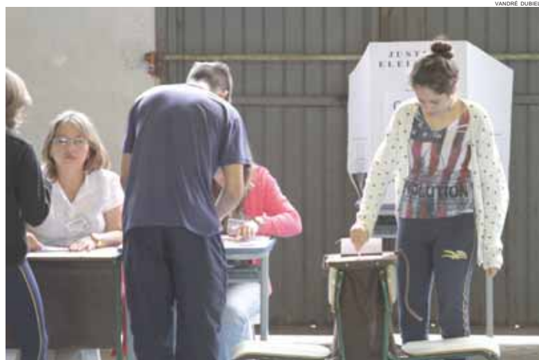
Pela primeira vez, a eleição teve peso igual para professores, funcionários, estudantes e pais