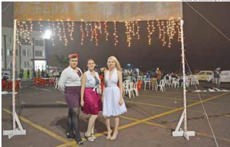
Com muito estilo alunos do 1º ano de Gastronomia da Univel receberam o público em evento promovido pelo curso