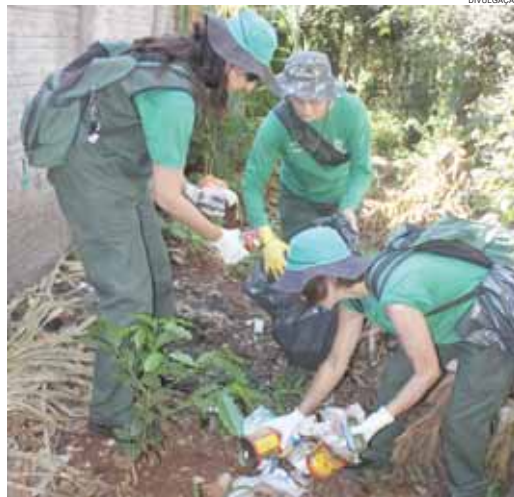
Dengue preocupa e exige cuidados redobrados da população