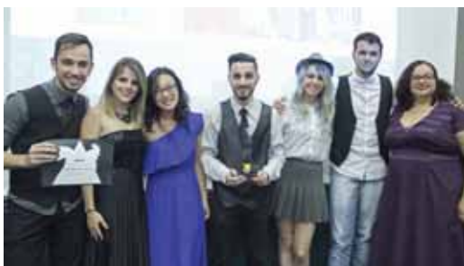
O Seminário de Práticas Jornalísticas e Publicitárias da FAG entregou o tradicional Galo de Ouro de Publicidade ao Grupo Meraki, da disciplina de Práticas em Responsabilidade Socioambiental, do 4º período