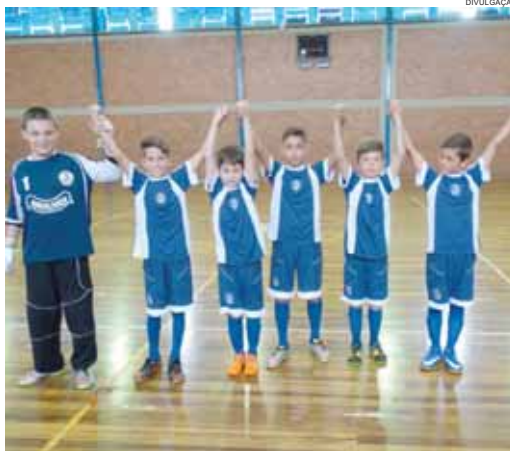
Equipe Sub-11 do Tuiuti Esporte Clube