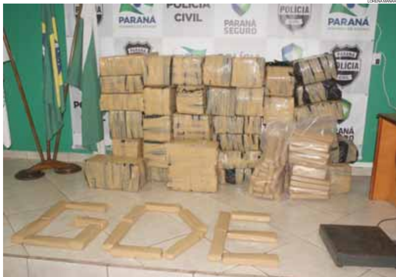
O entorpecente tinha como destino o estado de São Paulo