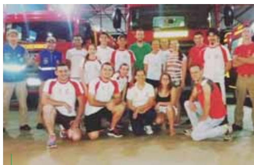
Alunos tiveram a oportunidade de colocar em prática informações sobre primeiros socorros e outros atendimentos