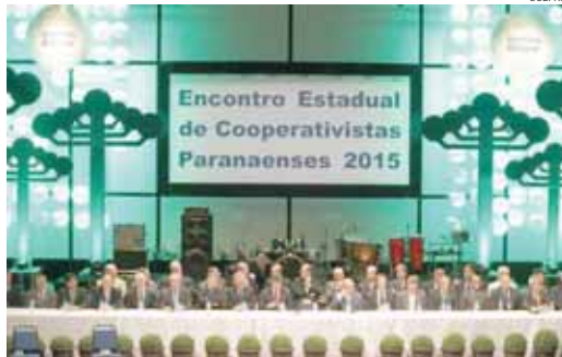
Evento reuniu líderes do setor em Curitiba. Oeste é de novo destaque