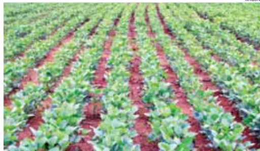
O excesso de chuva favorece o aparecimento de doenças nas lavouras de soja