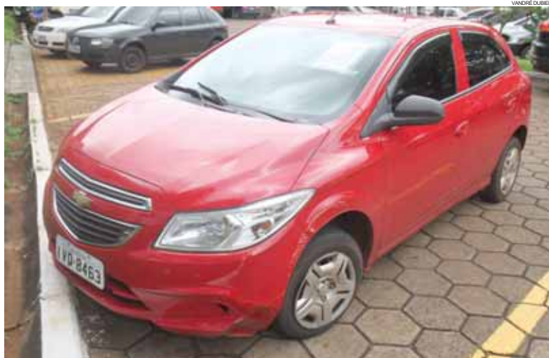
O Onix possuía alerta de roubo na cidade de Porto Alegre (RS)