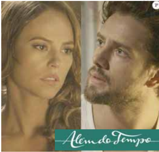
Além do Tempo