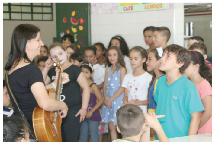
Encontro contou com apresentações preparadas pelos alunos

nossas atitudes com as pessoas que estão ao nosso redor. Pratiquem a caridade desde cedo que vocês serão ainda muito mais felizes”, disse.