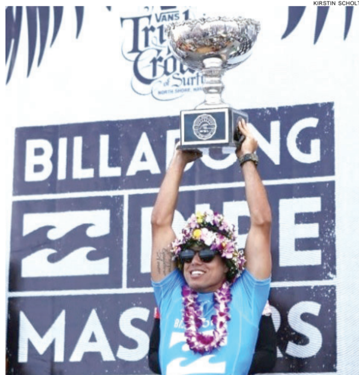
Mineirinho manteve o Brasil no topo do Mundial de Surfe

O Open de Palhoça é a primeira seletiva da natação brasileira para os Jogos de 2016. Cielo também estava inscrito nos 50m livres, prova que será realizada neste sábado, e agora tem apenas uma chance de obter o índice necessário para competir no Rio de Janeiro: o Troféu Maria Lenk, que será realizado no Estádio Aquático Olímpico, em abril.