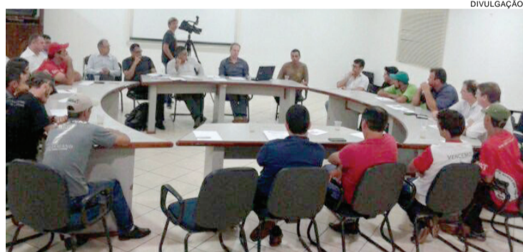
Reunião na noite de quinta-feira na Aciqui: apelo ao bom-senso