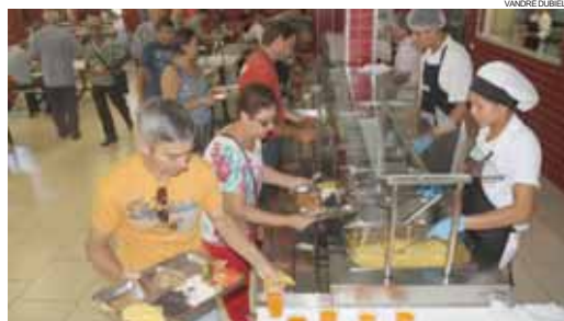
Em 2015 passaram pelo Restaurante Popular mais de 185 mil pessoas