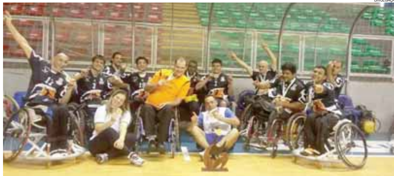
Equipe cascavelense teve que vencer duas vezes para ficar com o título inédito

Para ficar com o título, os cascavelenses precisaram vencer os toledanos duas vezes. A primeira foi durante o período programado para a competição. A partida final que terminou com vitória por 13 a 12 no tempo normal, entretanto, foi contabilizada como empate por 13 a 13 e levada