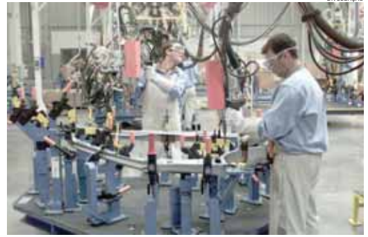
Desemprego deverá ser intenso no primeiro quadrimestre do ano

O empresariado paranaense aponta vários empecilhos para enfrentar a concorrência no mercado interno: a carga tributária elevada continua como a campeã, com 78,19%; seguida dos encargos sociais elevados com 66,78%. Além disso, dificultam o bom andamento das indústrias, o custo financeiro elevado com 55,70%, custo elevado de fabricação (40,27%), elevados custos de distribuição (35,91%), e mão de obra não qualificada (24,83%). A atual política penaliza todo setor produtivo.