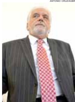
Jaques Wagner prevê que o governo navegará em águas mais tranquilas

neste governo, mas precisamos olhar para o futuro, vai dar credibilidade se conseguirmos fazer a reforma, garantir a Previdência para daqui a 15 anos e ter uma regra de transição", explicou. Wagner admitiu que as propostas não são novas e o governo não conseguiu avançar como deveria nesses pontos, mas disse que agora "o jogo é outro" e que empresários, sociedade e Congresso terão em 2016 um sentimento de que é preciso sair da agenda das crises política e econômica. "As pessoas querem que dê certo", afirmou.