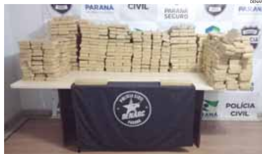
Só de maconha foram apreendidas mais de 8,7 toneladas neste ano

A delegada destacou ainda a apreensão de armas e munições durante operações de combate à criminalidade. "Foram 41 pistolas nove milímetros, um revólver calibre 38, uma espingarda calibre 12,