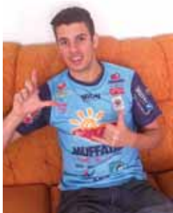
Ala/fixo Pirulito anunciou a própria saída do Cascavel

Quero agradecer também por toda hospitalidade da cidade de Cascavel, onde nasceu mi-