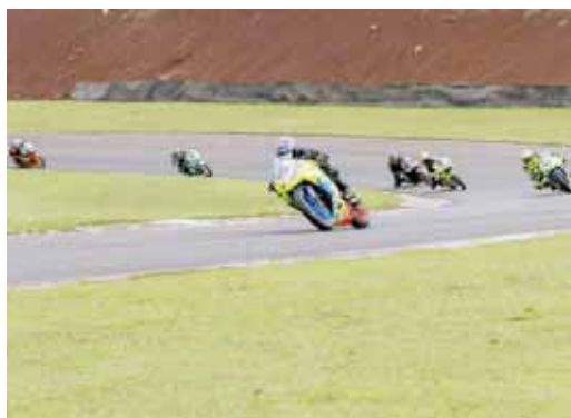
O nível técnico foi considerado altíssimo por se tratar de pilotos iniciantes