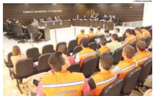
A sessão de ontem foi novamente acompanhada pelo Corpo de Bombeiros

O déficit também resulta do fato de a taxa não é cobrada de todos os contribuintes cascavelenses. São isentos do pagamento os contribuintes com consumo residencial de até 100 KWh mensais, os prédios próprios e/ou ocupados pelo Município, os prédios ocupados por entidades beneficentes.