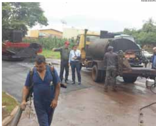
Obras abrangem áreas importantes do perímetro urbano

uma parte da obra já foi executada e outra parte está sendo finalizada".