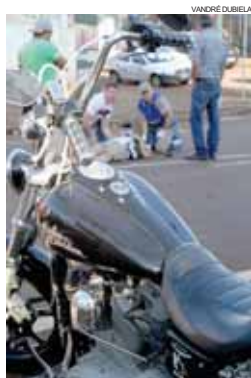
Acidente aconteceu no cruzamento das ruas Pio XII e Recife, na região central