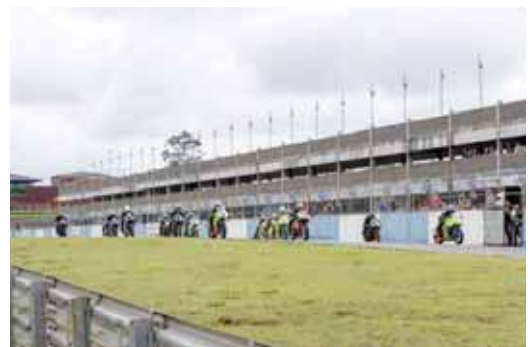
A Copa Verão de Motociclismo terá a segunda etapa em janeiro