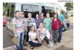
Maripá finaliza fila de espera por cirurgia de catarata