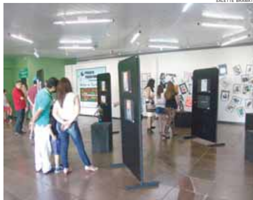
Exposição pode ser vista até hoje no Centro Cultural