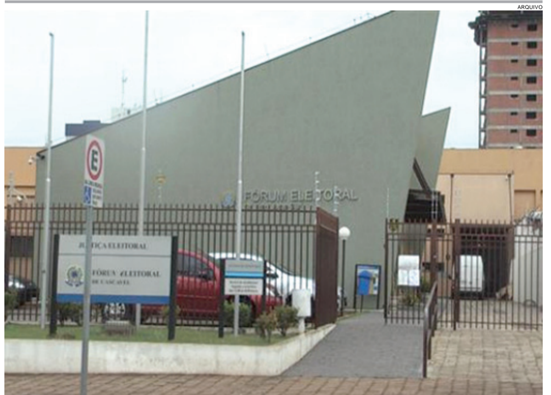
O atual Fórum Eleitoral de Cascavel será transformado em depósito de equipamentos

Com a justificativa de que era necessário aumentar de R$ 5 mil para R$ 9,2 mil os salários pagos aos médicos, sob pena de levar o atendimento na área da saúde a um colapso, e que esses profissionais não poderiam ganhar mais que a principal autoridade do município, os vereadores aumentaram o salário do prefeito dos atuais R$ 10,2 mil para R$ 12 mil a partir de 1º janeiro de 2017. Já os salários dos vereadores foi elevado de R$ 3 mil para R$ 4,6 mil e o do presidente da Casa, de R$ 3,7 mil para R$ 5 mil.