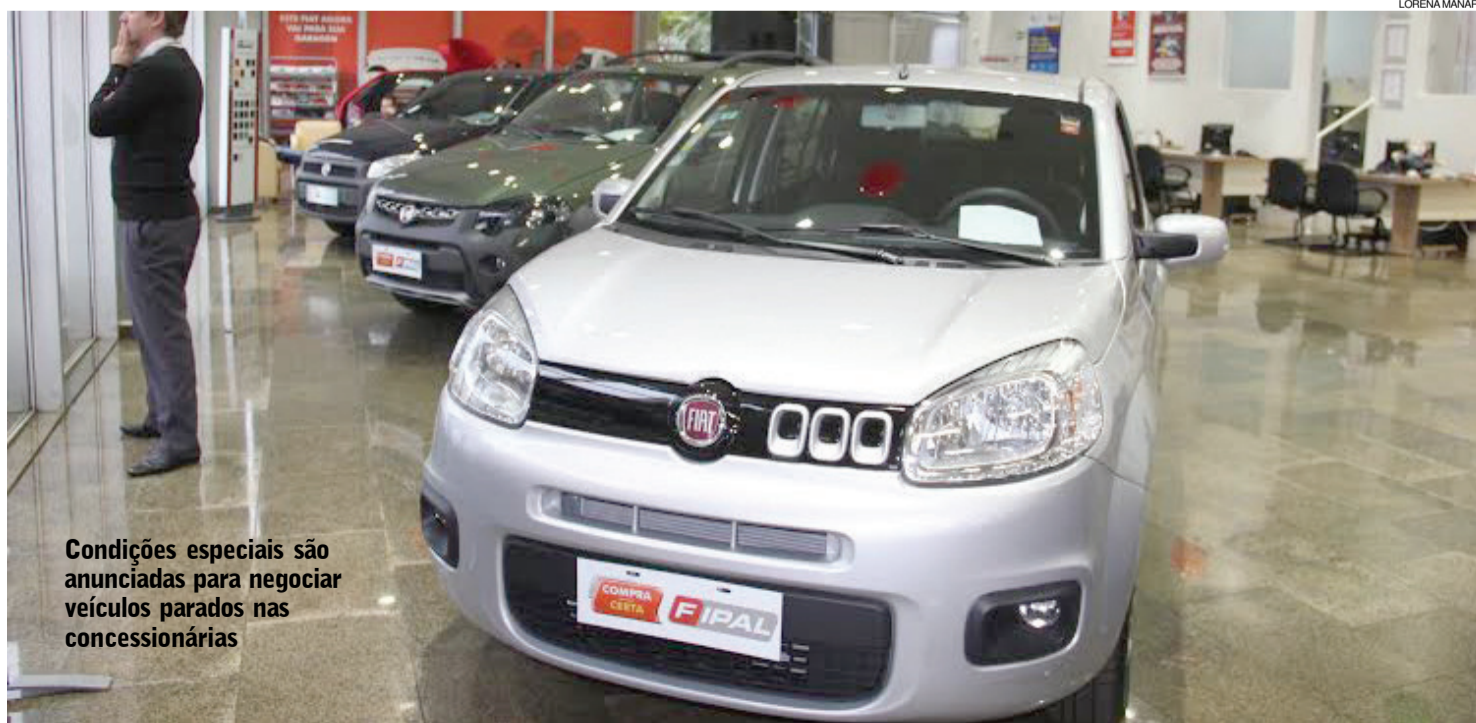
Condições especiais são anunciadas para negociar veículos parados nas concessionárias