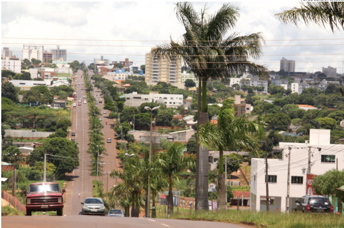
O Bairro Coqueiral é bem localizado, ficando a poucos minutos do Centro de Cascavel, e tem como principal via pública a Avenida Brasil