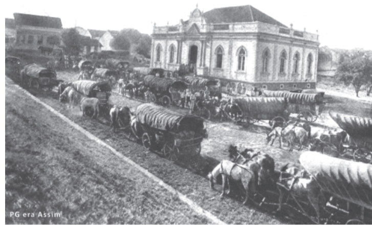
Prefeitura de Ponta Grossa no século XIX, quartel militar na Revolução Federalista

*Camaristas eram vereadores que também cumpriam papéis executivos e judiciários nas vilas, correspondentes aos atuais municípios.