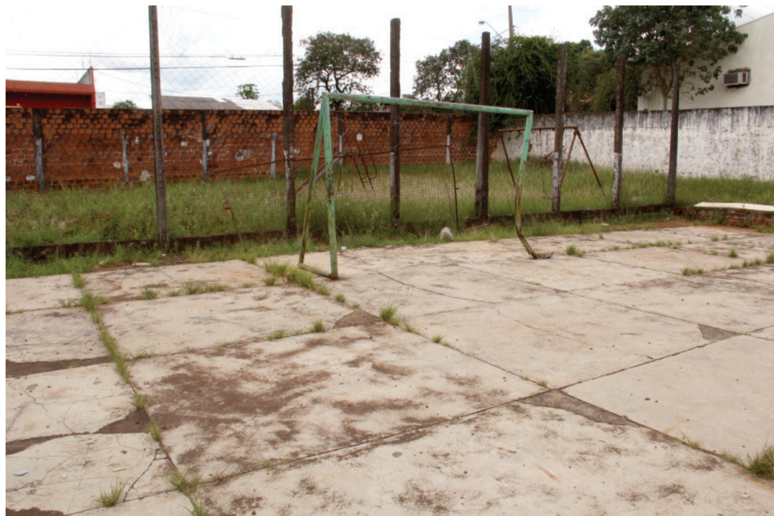
Quadra esportiva é uma das prioridades de recuperação no Bairro Coqueiral