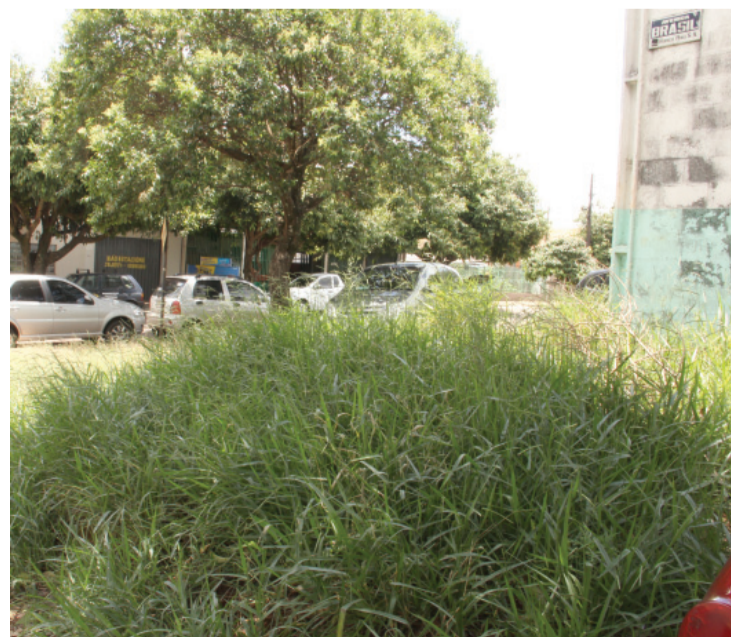
Moradores cobram limpeza de lotes baldios e roçadas em matagal