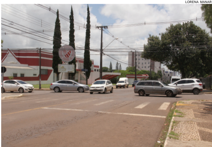
Cruzamento das ruas JK com a Pernambuco tem fluxo intenso e dificuldade para travessia

Além desse, outro binário que deve ser implantado no ano que vem envolve a Rua Manaus. A companhia planeja o sentido único, leste para