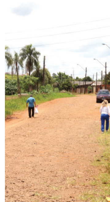
Poucas ruas no bairro ainda aguardam por asfalto