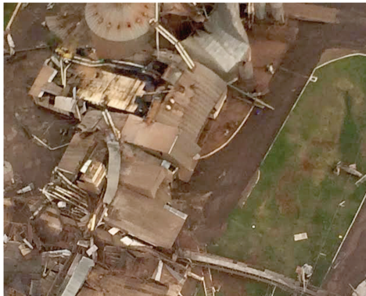
População fica em estado de alerta após tornado em Marechal Cândido Rondon. Contratar seguro residencial não é tão caro

A mudança de cultura entre a população também favoreceu a busca pelos serviços.