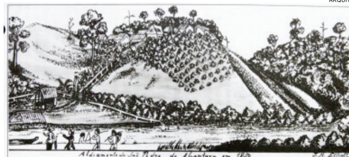
Reprodução de desenho feito por John Henry Elliot (1893). Mostra o ALDEAMENTO junto da colônia militar de Jataí. Ao alto o centro urbano. Em primeiro plano vêem-se casas e índios pescando. A seguir o rio Tibagi, à esquerda ativo do rio e margem de terra de cultivo; a direita, o sistema dos canais. No declive as plantações de café. O lugar recebeu o aldeamento logo como se vê nos mapas antigos.

2 de janeiro de 1984 Lançamento nacional da campanha pró eleições diretas em Curitiba.