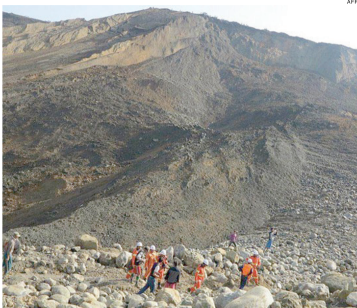
Deslizamento de terra em uma mina de jade do norte de Mianmar, no segundo acidente deste tipo em um mês

Apesar de algumas reformas, o mercado de jade segue nas mãos das velhas elites que se tornaram ricas durante os anos da junta militar que se dissolveu em 2011, após décadas no poder.