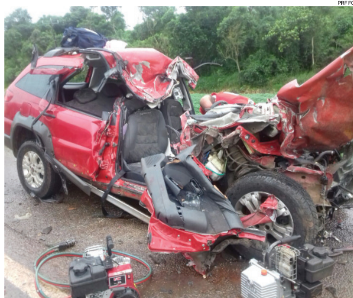
Graças ao cinto, vítimas tiveram apenas ferimentos moderados

Conforme a PRF, o primeiro veículo que estava parado, que fugiu do local após o acidente, tentava acessar a marginal. Havia um veículo da concessionária que administra a rodovia parado no acostamento para fazer a manutenção da BR-277 e isso pode ter contribuído para o acidente.