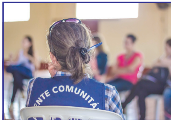
Estudantes de Psicologia participam de pesquisa na área rural de Cascavel

2014, aconteceu no Brasil (Fortaleza/CE) e, em março de 2015, esteve em Seminário de Pesquisa no Nucom.