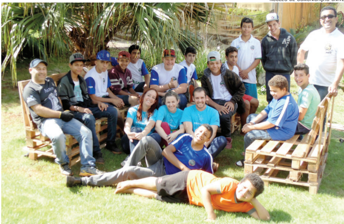
Adolescentes do programa Florir Toledo participaram de uma oficina com alunos do curso de Gestão Ambiental da Univel