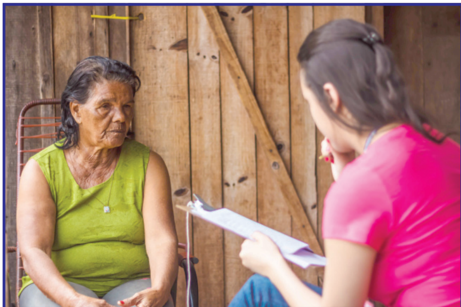
Equipe aplicou cerca de 300 questionários