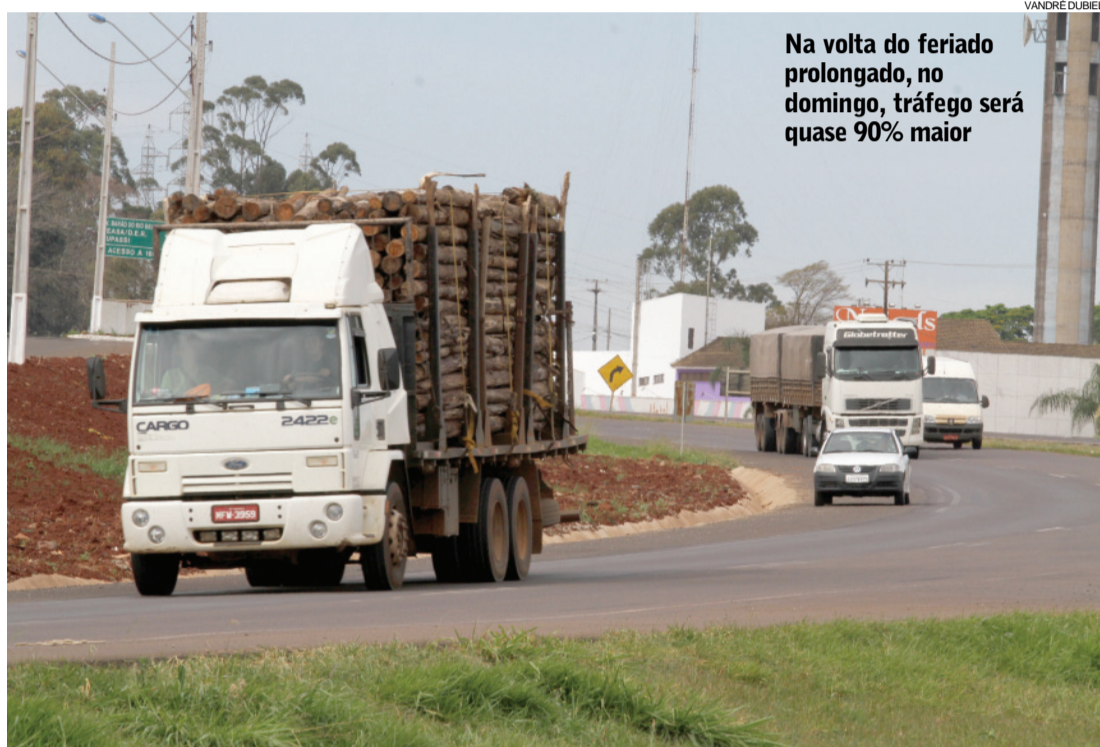
Na volta do feriado prolongado, no domingo, tráfego será quase 90% maior

Cabe ressaltar que nesta quinta-feira também haverá a restrição de tráfego para caminhões bitrem e portadores de AET (Autorização Especial de Trânsito) em todas as rodovias de pista simples. Esses veículos não poderão circular das 14 às 22 horas.