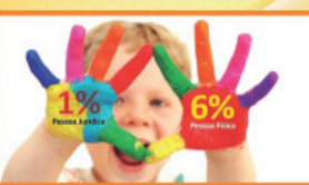
ILUSTRAÇÃO CAMPANHA DE INCENTIVO FISCAL IMPOSTO DE RENDA 2015

Termina hoje prazo para os contribuintes fazerem a destinação do Imposto de Renda 2015 em Palotina. A campanha sensibiliza e orienta empresas e pessoas físicas sobre o incentivo fiscal, visando a captar recursos para projetos infanto-juvenis e de idosos. No site do de Palotina (www.palotina.pr.gov.br) há link para a emissão das guias de receita. Para acessar clique em Campanha de Incentivo Fiscal.