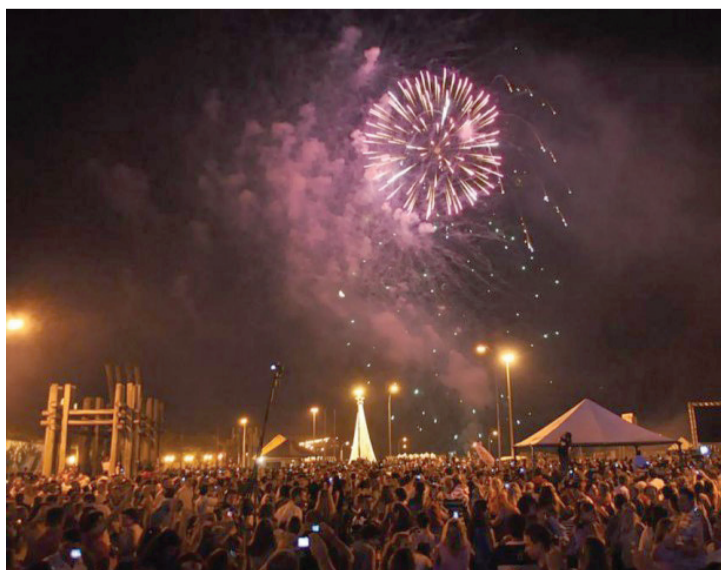
Em Marechal Rondon a festa da virada será no Lago Municipal