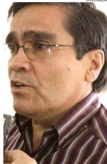
Bugrão diz que dinheiro há para pagar a folha, mas precisa do aval da Câmara

A Câmara está de recesso e ontem os servidores viviam a expectativa da convocação de sessões extraordinárias para recolocar a matéria em pauta. Para dificultar, o Regimento Interno não permite a realização de duas reuniões extras num intervalo menor que 24 horas, o que por maior que seja a pressa e a boa vontade dos legisladores, a questão não poderá mais ser resolvida antes da entrada de 2016.