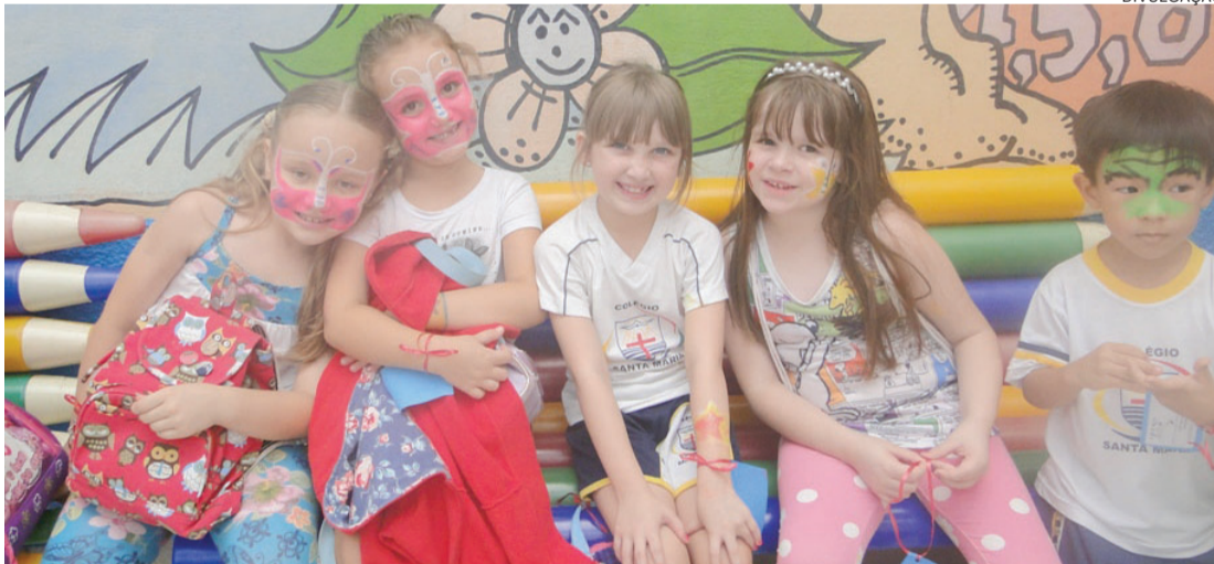
Alunos do Colégio Santa Maria encerraram as aulas em grande estilo e muita diversão