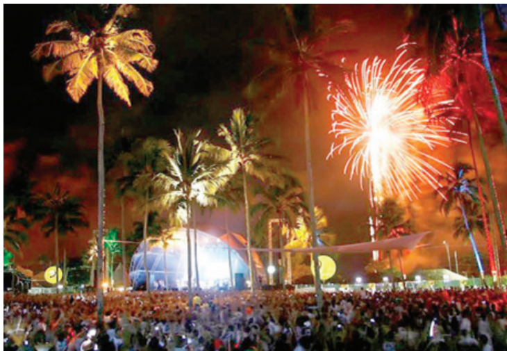
Uma das opções aos cascavelenses será o réveillon do Comercial