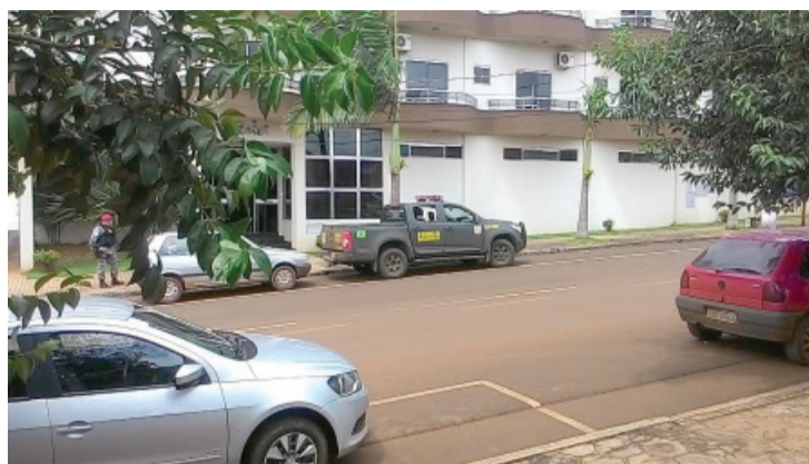
Veículos da Força Nacional já circulam no município

A autorização do uso da Força Nacional foi confirmada pelo processo de número 2004.70.05.2014.404.7007 do Juízo Federal da 1ª Vara Federal de Cascavel. Conforme o próprio ministro Cardozo afirmou a Beto Richa, a operação terá apoio logístico nos termos do Acordo de Cooperação Técnica firmado entre União e o