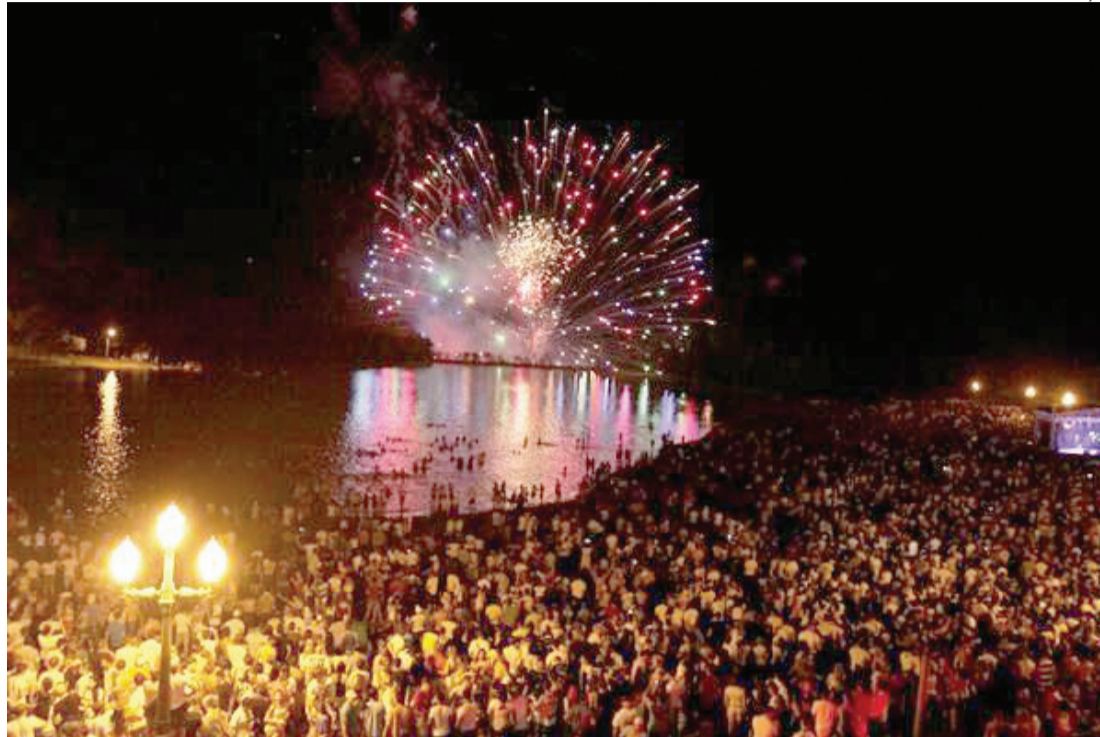
A tradicional queima de fogos em Santa Helena terá duração de 15 minutos

Na cidade mais visitada do Paraná milhares devem passar os últimos dias deste ano e os primeiros do próximo. Mas se a ideia é gastar pouco ou quase nada, Toledo vai ter mais uma vez a tradicional queima de fogos no lago localizado no Parque Ecológico Diva Pain Barth. Serão 18 minutos de show pirotécnico que promete reunir cerca de 30 mil pessoas. O evento se tornou uma tradição e atrairá, inclusive, uma infi-