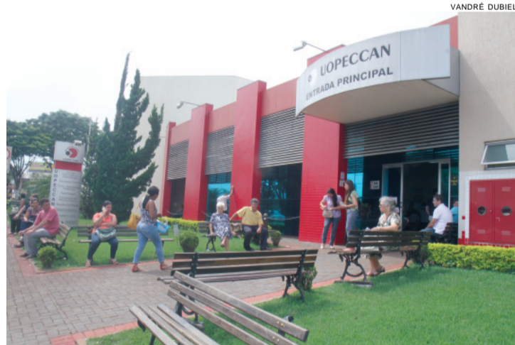
Entre as instituições que podem ser beneficiadas com os recursos do Imposto de Renda, está a Uopecan

Um dos projetos que serão beneficiados com as doações já foi aprovado no valor de R$