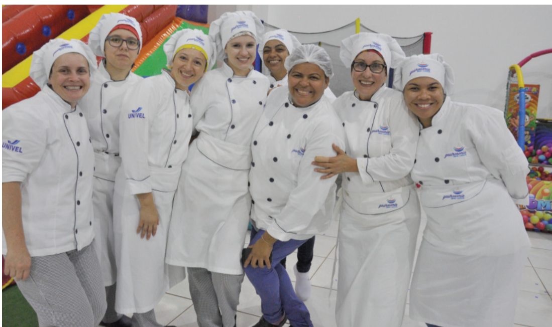
Acadêmicas de Gastronomia da Univel que proporcionaram neste mês de dezembro uma noite de pizzas e muita diversão aos pequenos pacientes da Uopeccan