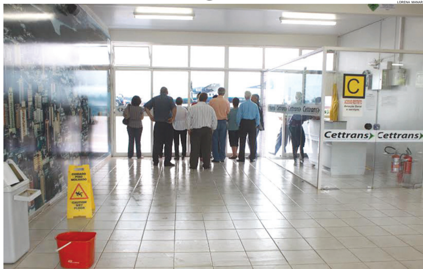
Vítimas de golpes, famílias perdem dinheiro e período de férias para descanso. É preciso desconfiar quando promessa é boa demais