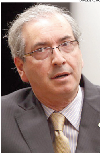
A quebra dos sigilos fiscal e bancário de Cunha atende pedido da PGR

Câmara disse que a quebra de sigilo é uma decisão do ano passado. "A divulgada quebra de sigilos do presidente da Câmara e seus familiares ocorreu há mais de três meses, os documentos foram juntados em 23 de outubro e inclusive, como de praxe, em parte vazados para a imprensa, não se tratando, portanto, de matéria nova que mereça resposta", diz o texto. A nota diz também que Cunha "não vê qualquer problema com a quebra de sigilos, e sempre estará à disposição da Justiça para prestar quaisquer explicações".