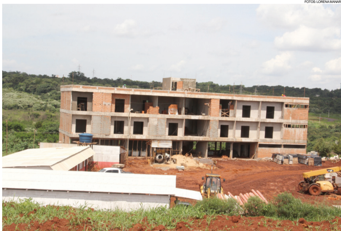
Alojamento do CNTA já chegou ao terceiro piso

“A quarta parcela está quitada e a quinta já tem a parte da União depositada. Na segunda-feira, quando será