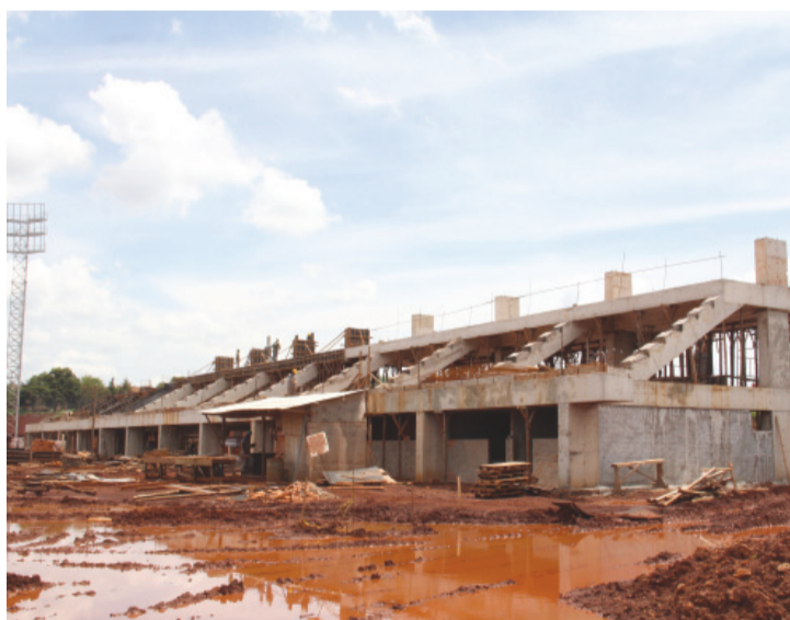
Arquibancadas já tomam forma no canteiro de obras

Em relação às adequações no projeto, com a inclusão de acesso, paisagismo e cercamento, além do realinhamento de preços cotados com o dólar abaixo dos R$ 3, Folador explica que o pedido segue o trâmite legal. “As solicitações já foram protocoladas pela empresa no departamento competente pela obra [Paraná Edificações], que fez a análise técnica e encaminhou para os parceiros financeiros, que são o Estado e a União. Agora, as procuradorias jurídicas de ambos vão dar seu parecer e, sendo este favorável, a diferença já será alocada na próxima fase orçamentária”, explicou.