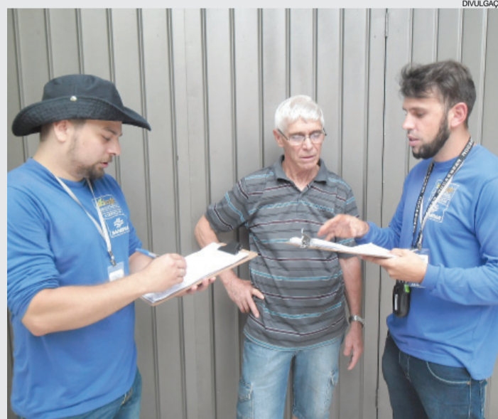
Vistorias das equipes da Sanepar já começaram e vão alcançar mais de 5 mil imóveis em Cascavel

Quando as ligações não estão corretas, há um aumento do volume dos dejetos dentro da rede o que provoca extravasamentos e até refluxo do esgoto para dentro dos imóveis. As ligações de esgoto incorretas causam danos para toda a comunidade, pois o refluxo pode ocorrer em