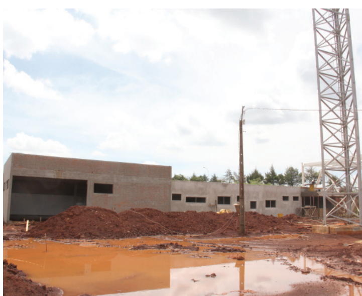
Salas de fisiologia e musculação ficam ao lado das arquibancadas