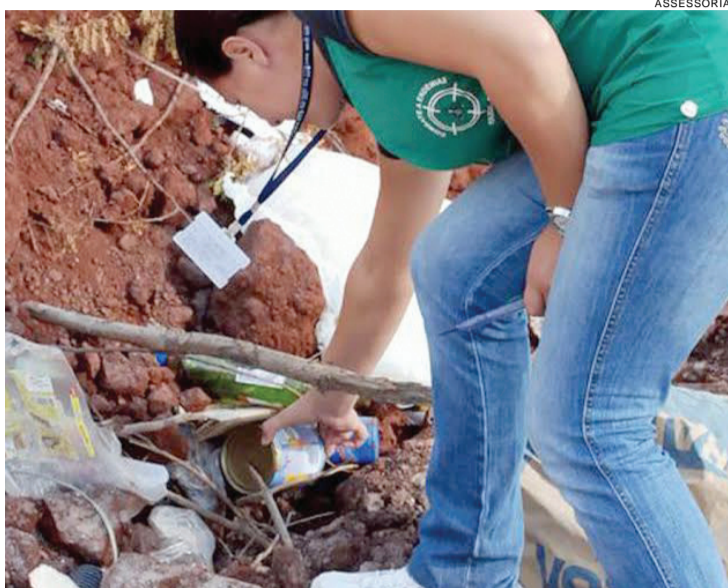
Para fortalecer as ações de combate ao mosquito transmissor foi criado ontem o Comitê Municipal de Mobilização contra a Dengue

A equipe da Praça Willy Barth estará com uma maquete construída pelos alunos da Escola Municipal Anita Garibaldi mostrando como deve ser a disposição e a ma-