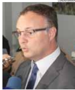
Todas as circunstâncias da fuga serão apuradas com rigor, garantiu Mesquita

Foram entregues diversas cartas escritas por presos e áudios gravados dentro da penitenciária que indicam para a presença do crime organizado na unidade. O secretário afirmou que se houver comprovação de que o Sindarspen agiu com segundos interesses, ele será responsabilizado. "Os agentes penitenciários são fun-