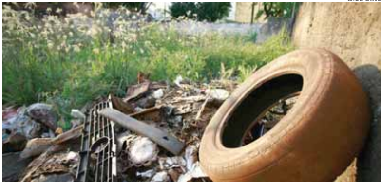
Falta de limpeza em quintais e terrenos baldios ainda é uma das principais causas da proliferação do mosquito