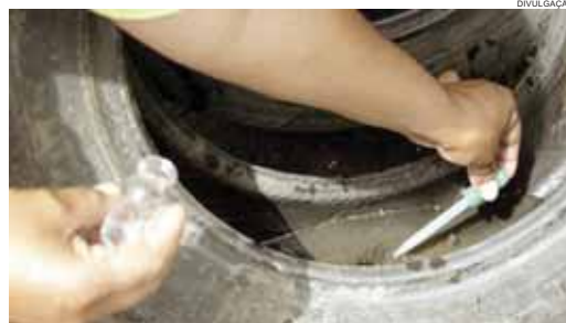
Cascavel já tem oito casos de dengue e mais da metade foi contraída em outras cidades

O resultado do 1º LIRAA (Levantamento de Índice Rápido de Infestação por Aedes Aegypti) apontou 6,8% de infestação em Cascavel. Para controlar a proliferação do Aedes, o Município organiza um mutirão que envolve todas as secretarias municipais e órgãos oficiais.