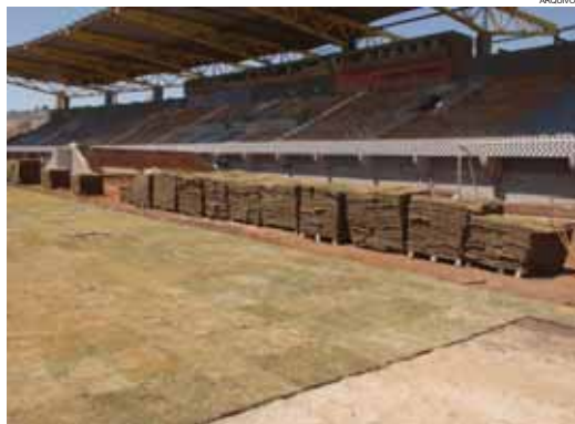
Estádio cascavelense recebe o novo gramado

Por enquanto o estádio passa pelas chamadas “obras civis”, ligadas à estrutura física. Esta etapa deverá ser encerrada até abril.