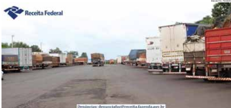
Porto Seco de Foz do Iguaçu é a maior estrutura do tipo no Brasil

Entre os produtos mais importados do Paraguai, destacam-se plásticos, grãos, sementes e cereais, da Argentina o que mais se importou foi malte e amidos, produtos de horticultura e frutas e do Chile, peixes e frutos do mar, além de fru-