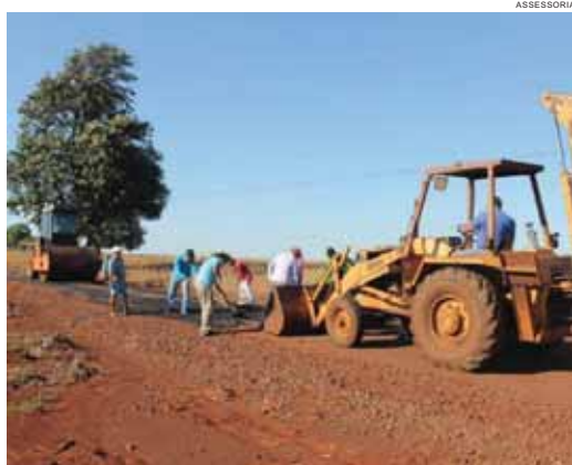
Obras são executadas na região da Linha Catarina

Outras estradas em diversos trechos do município também são recuperadas para garantir um bom escoamento da produção de grãos e aviários.