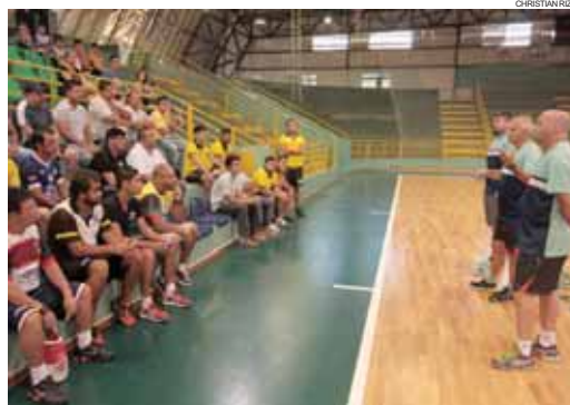
Professores de futsal de Foz e região durante encontro com a comissão da seleção brasileira