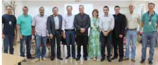
Líderes que debateram o assunto: integração Lindeiros e Itaipu

Um dos objetivos seria desburocratizar os convênios e assim facilitar a realização das obras