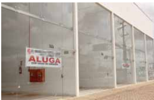
A procura por imóveis para locação é grande em Cascavel neste começo de ano, segundo as imobiliárias

Aproximadamente 2,8 mil crianças aguardavam por uma vaga em um Cmei, de acordo com a fila de espera no Cadun (Cadastro Único) para vagas nos Cmeis em 2016. Em 2015 foram entregues cinco Cmeis e a previsão é de que quatro novas unidades sejam inauguradas este ano.