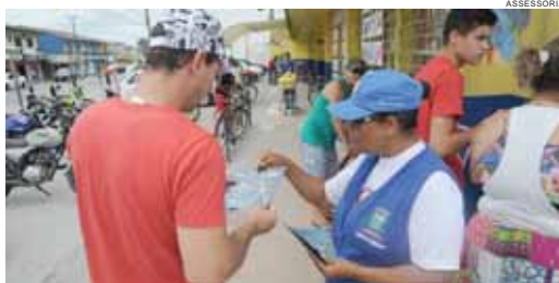
Se cada um fizer a sua parte, o Aedes será derrotado

No Paraná, mais de 90% dos criadouros encontrados pelas equipes de saúde estão dentro de residências e quintais. O principal vilão é o lixo, mas todo objeto ou local que possam acumular água precisam ser verificados e eliminados. Muitos focos do mosquito são identificados em locais de pouca visibilidade, como em ocios de árvore, ralos, reservatórios de água de geladeiras e ar-condicionados e calhas, entre outros espaços.