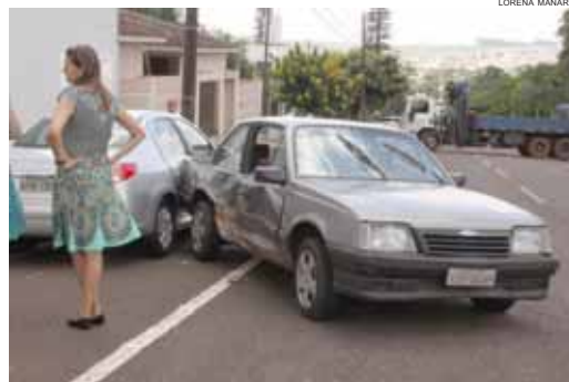
O Monza rodou na pista e atingiu um Peugeot que estava estacionado

nino de 7 anos sofreu um corte na região do supercílio. Já uma menina de 2 anos não tinha lesões aparentes, porém apresentava náuseas e vômito. Após serem atendidas pelo Siate, as duas vítimas foram encaminhadas à UPA Pediátrica.