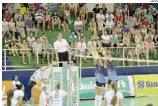
A torcida sempre foi o diferencial do Cascavel em jogos em casa na Superliga B