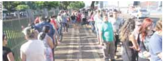
Enormes filas se formaram ontem no Fórum Eleitoral de Cascavel

facilidade até dia 4 de maio, quando expirará o prazo para a transferência de domicílio e para que novos eleitores (principalmente jovens com 16 anos completos) façam o título. Essa será a data limite também para quem está com o título cancelado, por ter deixado de votar no último pleito, regularize a sua situação.