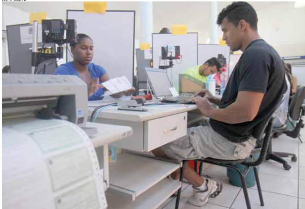
Em torno de 3,2 mil eleitores fizeram o cadastramento ao longo do dia de ontem; biometria será encerrada neste sábado