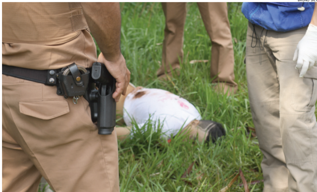
Cascavel tem registrado quedas consecutivas no número de mortes violentas

Cascavel é o principal centro da 15ª AISP (Área Integrada de Segurança Pública), que abrange outros 23 municípios. A cidade tem registrado quedas consecutivas no número de mortes violentas. Segundo levantamento realizado por O Paraná , em 2012, ano mais violento de sua história, Cascavel teve 168 óbitos. Fo-