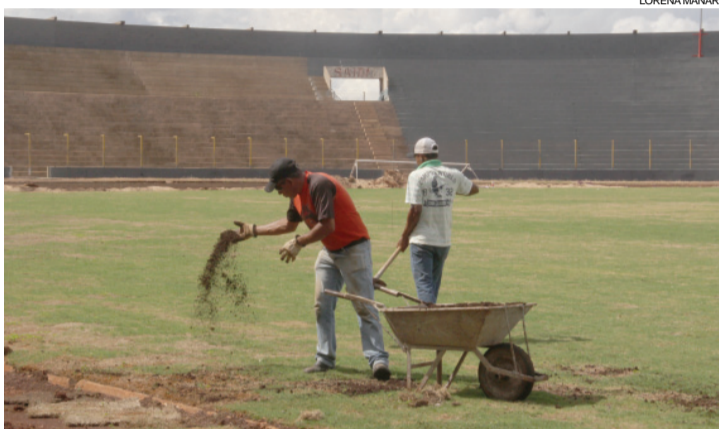
O novo gramado do Olímpico receberá manutenção por pelo menos mais dois meses

Apesar de a obra no estádio apresentar constante evolução, os responsáveis pelo local estudam pedir novo prazo para a entrega, o que esten-