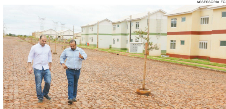
O padrão do conjunto chama atenção e cria nova referência em Foz

nheiros foram planejados com espaço adequado para portadores de deficiência física e idosos. Todas as unidades têm interfone, portaria 24 horas. O Habitacional Grande Lago possui ainda campo de futebol suíço, salão de festas, churrasqueira, parquinho para as crianças, paisagismo e estacionamento para moradores e visitantes.