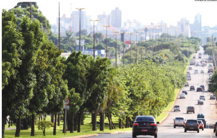
Próxima etapa será a remodelação das avenidas Tancredo Neves (foto) e Barão do Rio Branco

Das licitações previstas para o semestre passado, duas já saíram do papel, mas há poucos dias: a construção do viaduto sobre a BR-277, entre os bairros Pacaembu e Cascavel Velho, e a execução da rede