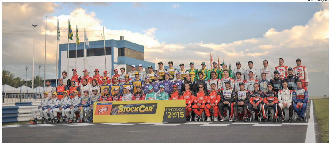
Pilotos da Stock Car, Brasileiro de Turismo e Mercedes-Benz Challenge correrão pela última vez no Autódromo de Curitiba

No sábado, a primeira corrida da temporada do Brasileiro de Turismo terá largada às 14h55, e às 15h45 os carros da CLA AMG Cup do Merce-