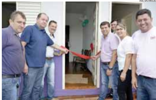
Líderes durante ato que marcou a entrega da unidade básica

inaugurada em 2003. A estrutura ficou interdita por um longo período. A população tinha que se deslocar até a comunidade mais próxima para ser atendida. Desse modo, a prefeitura com recur-