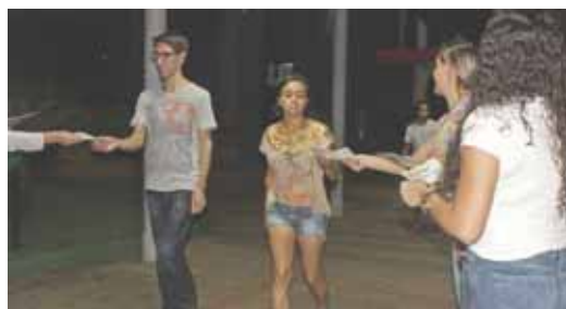
Foram entregues panfletos para os acadêmicos de todos os blocos do Centro Universitário FAG e da Faculdade Dom Bosco

Os alunos de todos os períodos do curso de Enfermagem do Centro Universitário FAG, juntamente com a secretária de Saúde, desenvolveram, na última sexta-feira (19), uma ação social de conscientização contra o Aedes aegypti. Através da entrega de panfletos para os acadêmicos de todos os blocos do Centro Universitário FAG e da Faculdade Dom Bosco, as orientações aconteceram com o objetivo de alertar a todos.