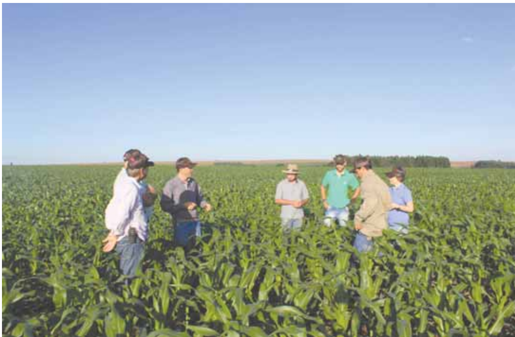
Visita teve o objetivo de analisar e acompanhar a performance e a biotecnologia do milho

Para o gerente da Fazenda Escola, a visita demonstra que "a qualidade do trabalho que