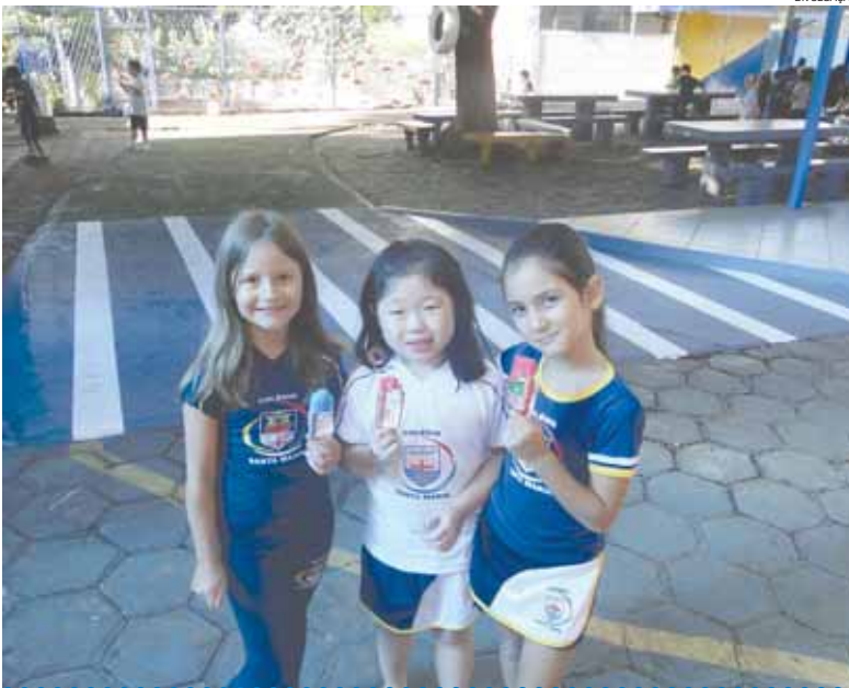
Alunos do Colégio Santa Maria curtindo o retorno às aulas com direito a picolés