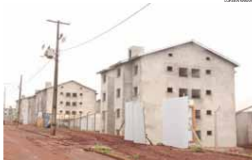
No Residencial Jaborá, seguem em construção 280 apartamentos

Considerando a base de dados da Prefeitura de Cascavel, há 16.828 inscrições ativas, no entanto, as famílias devem procurar o setor para atuali-