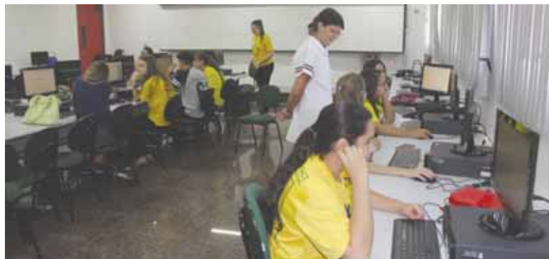
A formação dos jovens se dá através de convênios firmados com as empresas, que matricularam os aprendizes no Programa de Aprendizagem Profissional

que os mesmos realizem as atividades teóricas e práticas. "A proposta Pedagógica do Programa é constituída de forma interdisciplinar e modular com Módulos de Formação Humana e Científica, Informática Básica, Automação de Escritório, Comunicação Oral e Escrita, Matemática Básica e financeira, Meio Ambiente, Noções Básicas de Administração, Departamento Pessoal e Contabilidade", finaliza Salete.