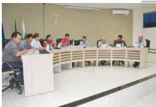
Vereadores de Guaraniaçu se reúnem sempre às segundas

A proposta está em fase final de análise em comissões da Casa e deverá entrar em plenário, em primeiro turno, na sessão ordinária de segunda-feira, 29.