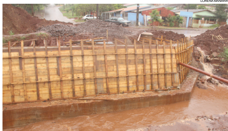
Obras da ponte entre os bairros Periollo e Brasília serão concluídas até a metade do ano, garante o Município