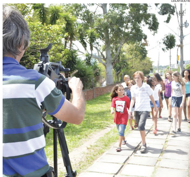
Cenas gravadas durante o curso realizado em Porto Alegre