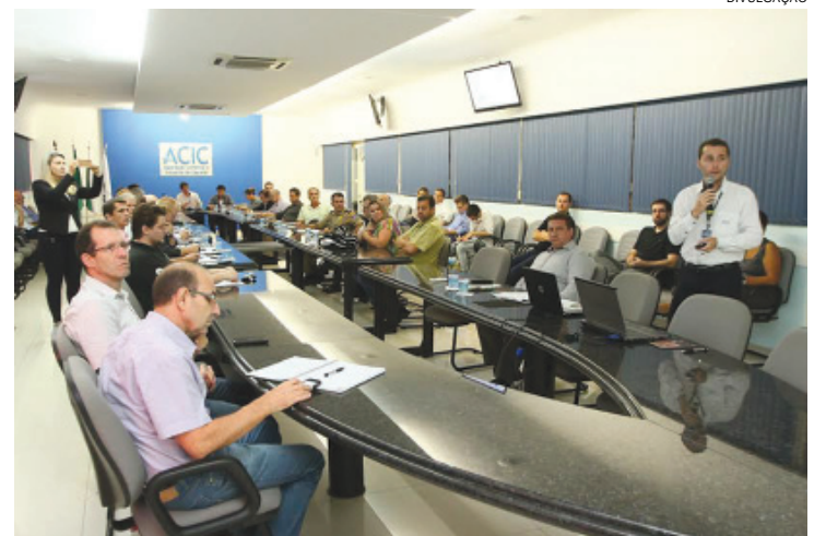
Representantes de entidades organizadas durante encontro na noite de quinta-feira, na Acic

a diretoria será composta por presidente, vice-presidente e secretário.