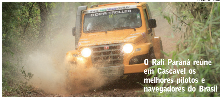
O Rali Paraná reúne em Cascavel os melhores pilotos e navegadores do Brasil

A largada da etapa de Cascavel do Rali Paraná será às 13h, no Posto Maçarico, na Avenida Brasil, 5.276, e a chegada do primeiro carro está prevista para as 17h30. O resultado será divulgado às 20h, na Loja Renovação, na Aveni-