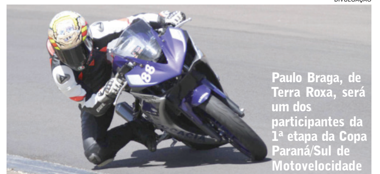
Paulo Braga, de Terra Roxa, será um dos participantes da 1ª etapa da Copa Paraná/Sul de Motovelocidade