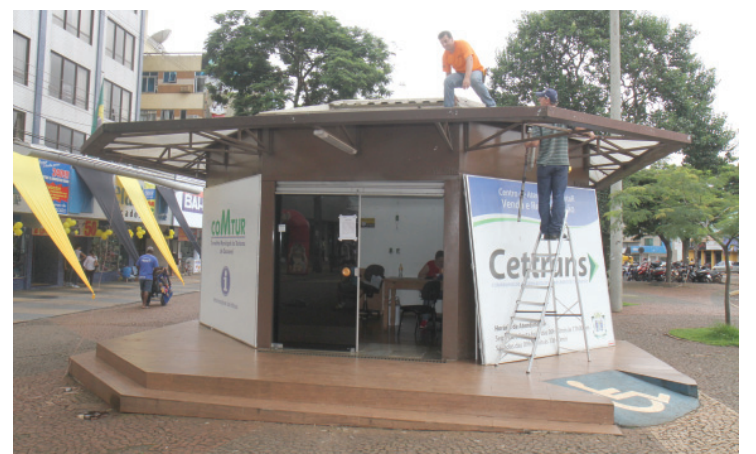
Motivo da desativação do quiosque é o início das obras do PDI no próximo mês no Calçadão da Avenida Brasil

A previsão, de acordo com a administração municipal, é que as obras no trecho que compreende o Calçadão da Avenida Brasil comecem no próximo mês. A primeira fase será a instalação da rede elétrica, que foi licitada há 15 dias. Já toda extensão da avenida deve ficar pronta até o fim de dezem-