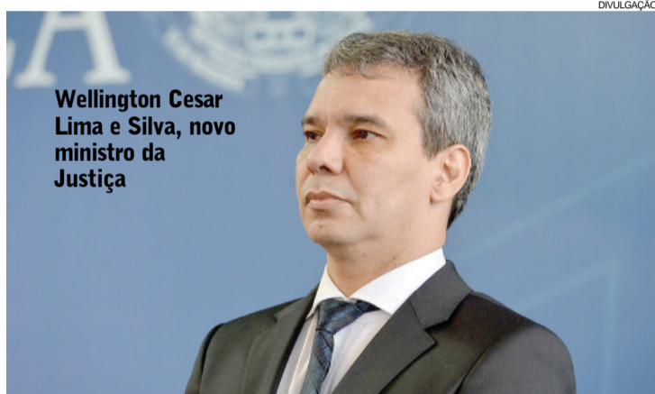
Wellington Cesar Lima e Silva, novo ministro da Justiça

Os ministros acertaram que, em até 20 dias após a publicação da ata do julgamen-