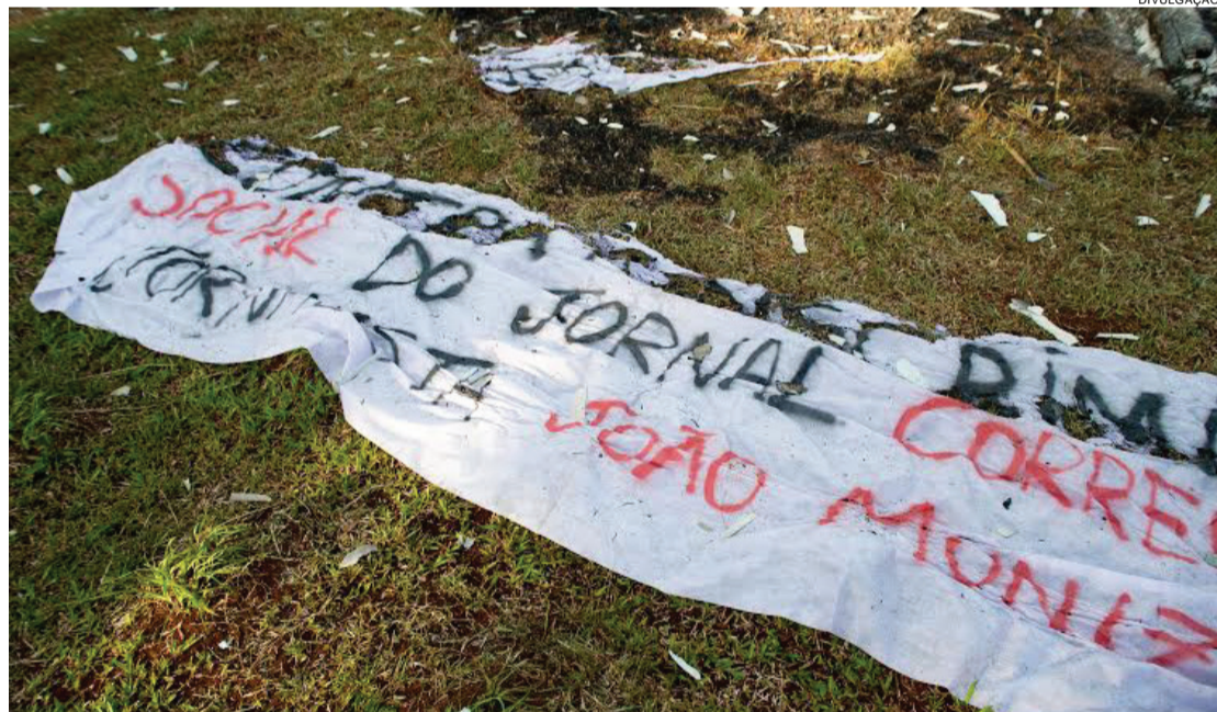
Faixa deixada pelo MST em viveiros da Araupel: ameaça a jornalista e o direito à livre informação