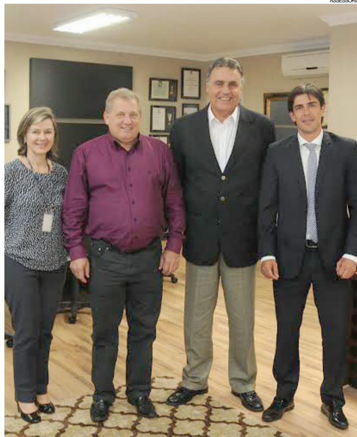
O encontro dos líderes ocorreu na capital