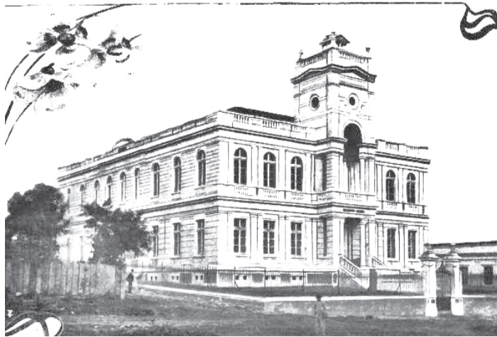
Lyceo Coritibano, futuro Colégio estadual do Paraná