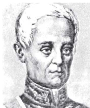
Antônio Carlos de Andrada ironizou a ditadura militar de Pedro I