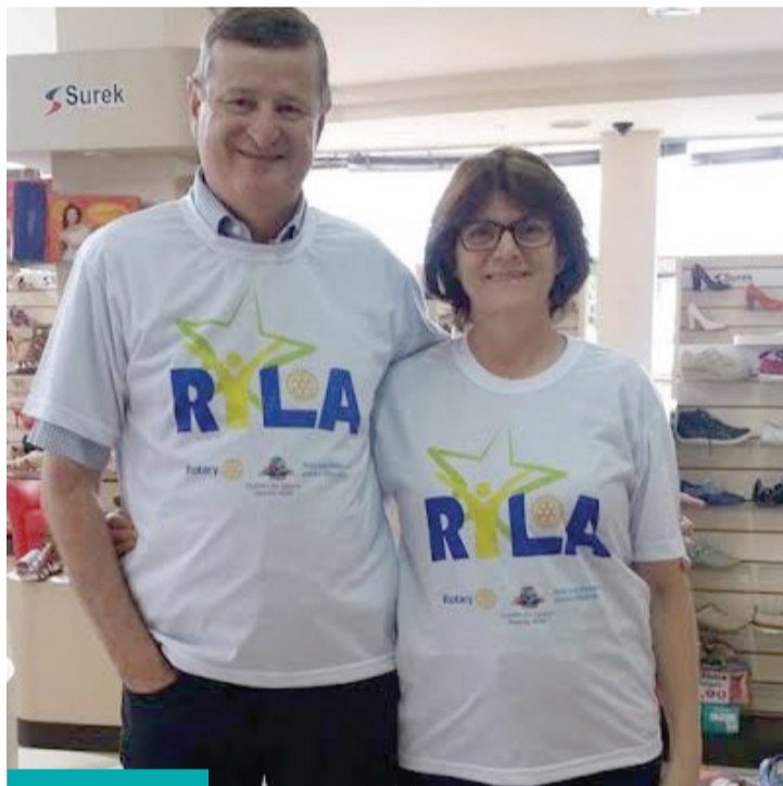
Governador Werner e esposa, preparados para o Ryla

Hoje - Dia do convidado, às 19h, na ASR; Dia 13 - Ação semana mundial, às 16h, no lago municipal de Cascavel; Dia 18 - Debate "Crimes de Ódio", às 20h, na Unioeste de Cascavel, certificado de 2 horas extracurriculares. Entrada: 1 kg de alimento não perecível. Mais informações ou qualquer dúvida: gabrielacascavel@hotmail.com