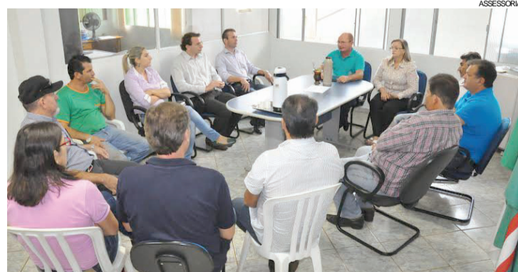
Reunião que debateu o nome prisional da Apac

gia Apac fundamenta-se no estabelecimento de uma disciplina rígida, caracterizada por respeito, ordem, trabalho e envolvimento da família do sentenciado. "Por esse método, temos um alto índice de recuperação dos