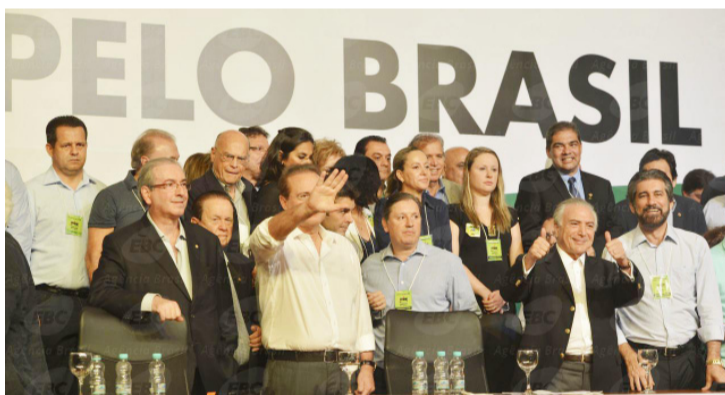
Peemedebistas na convenção realizada ontem em Brasília