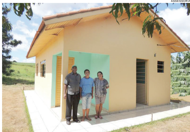
Agricultores familiares agora têm casa própria: conquista

Segundo Dolzan, há uma vedação na legislação brasileira de importação de veículos usados. “Só é possível importar veículos novos. Então, se ele foi emplacado no Paraguai, obviamente ele é usado. Dessa forma, não é possível trazê-lo ao país”, explica.