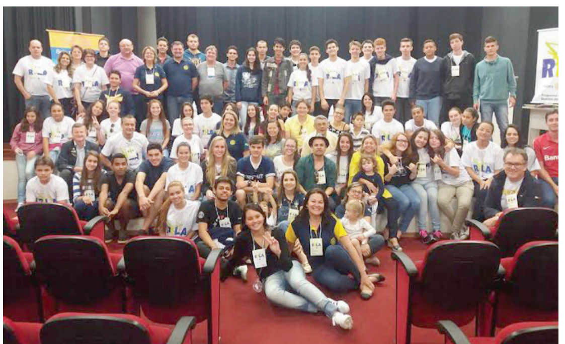
O Ryla 2016 foi realizado em Quedas do Iguaçu