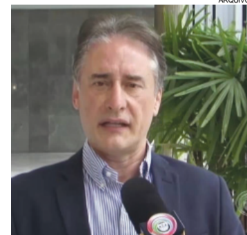
Prefeito Edgar Bueno

Edgar foi condenado em ação proposta pelo Ministério Público por descumprimento da Lei Municipal 4856/2008, que estabelece que metade dos cargos em comissão da administração cascavelense deve ser ocupada por servidores. Segundo a sen-