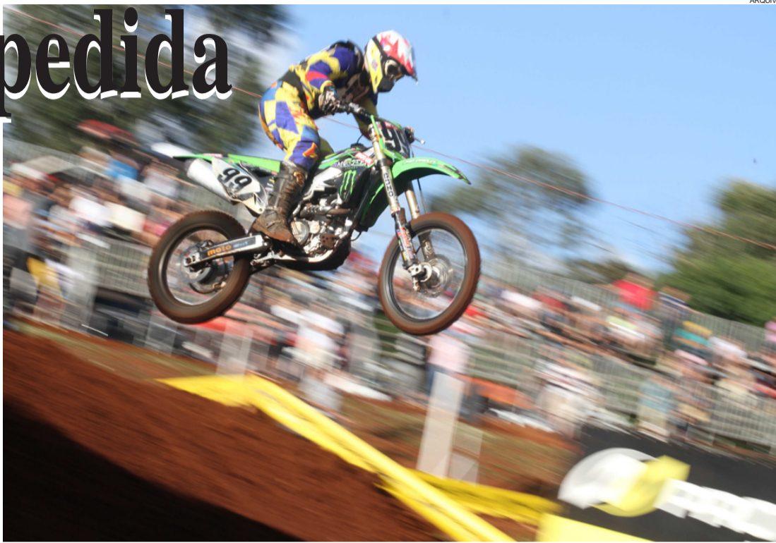
O GP Cascavel de Motocross proporcionará um espetáculo de primeira grandeza

Com boa estrutura, que inclui arquibancadas e espaços kids, a pista localizada no interior do Autódromo Zilmar Beux receberá cerca de 300 pilotos do Brasil, Argentina, Paraguai, Bolívia e Equador. Os brasileiros são oriundos dos estados do Paraná, Santa Catarina, Rio Grande do Sul, Mato Grosso do Sul e São Paulo.