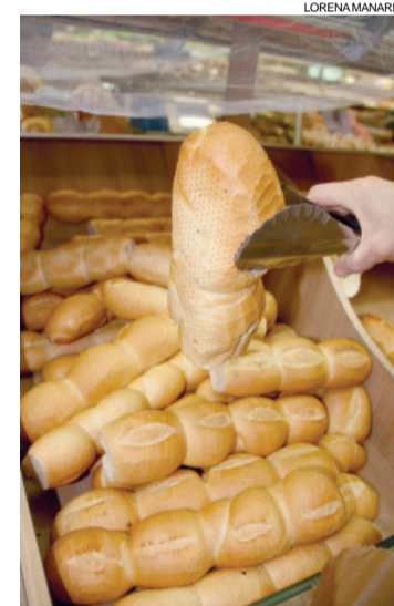
Para as famílias onde o consumo é alto, o jeito é pesquisar

É muito fácil fretar um ônibus padrão Princesa dos Campos