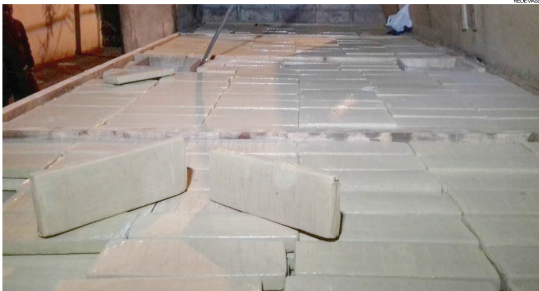
Druga era transportada em um compartimento falso sob o assoalho da carreta

O entorpecente era transportado em um compartimento falso sob o assoalho da carreta, que também levava 32 toneladas de trigo. O motoris-