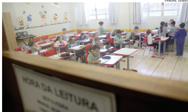
Professores precisam improvisar para dar sequência aos conteúdos programados