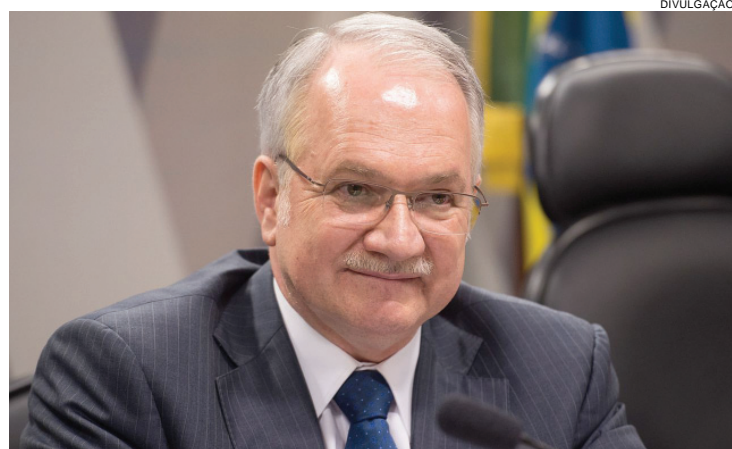
Ministro Luiz Edson Fachin se declarou "suspeito" para julgar

Além dos advogados de defesa de Lula, também as-