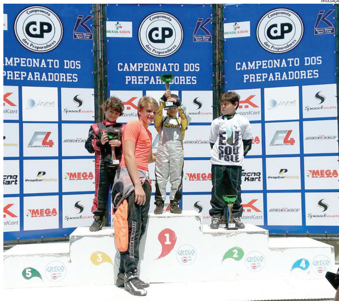
Akyu Myasava conquistou sua primeira vitória na Copa dos Preparadores

quando quebrou a corrente de seu kart e se obrigou a abandonar.