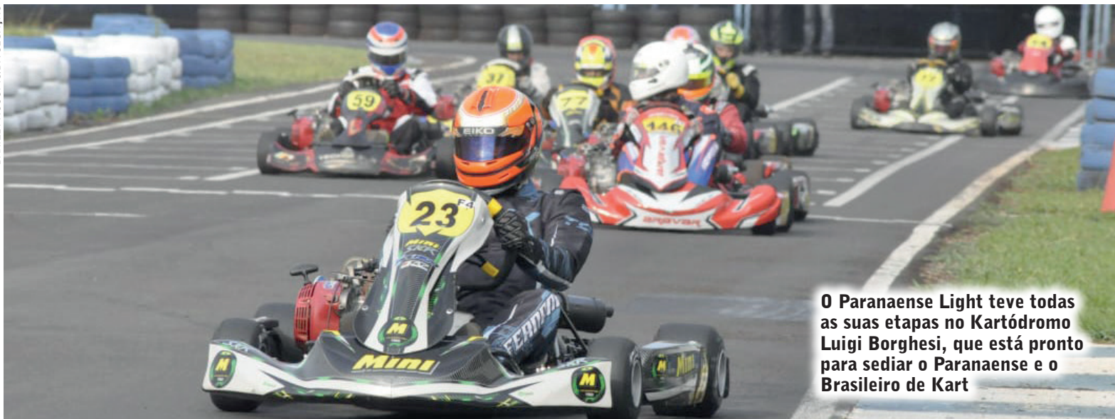
O Paranaense Light teve todas as suas etapas no Kartódromo Luigi Borghesi, que está pronto para sediar o Paranaense e o Brasileiro de Kart