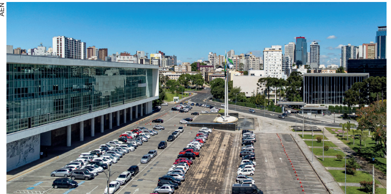
Governo encaminhou Anteprojeto de Lei Orçamentária de 2025 à Assembleia Legislativa

Segundo ele, houve um trabalho muito próximo com os