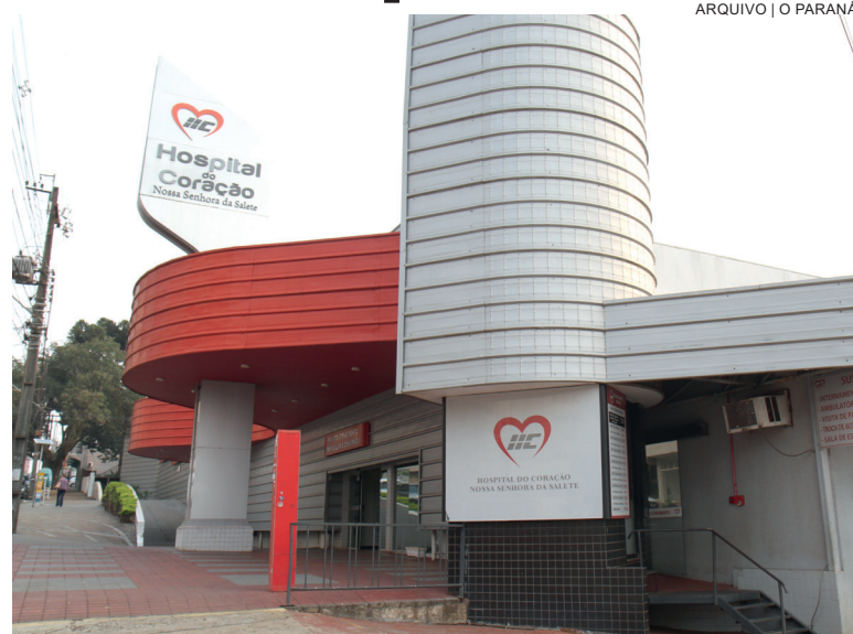
O antigo Hospital Nossa Senhora da Salette e Hospital do Coração encerrou as atividades em 2022

Entre os problemas identificados no local estão sistema elétrico precário, fiação exposta, ausência de sistema contra incêndios, ausência de manutenção de telhado, paredes, pisos e janelas e afins. Conforme o relatório da autoridade sanitária, os prontuários estão “acondicionados em envelopes, dentro de sacos plásticos lacrados e dispostos sobre o piso e encostados na parede, próximo à porta e janela e, embora tivessem uma sequência numérica, não possuem sistema de organização, tampouco prontuário eletrônico”. As adequações a serem promovidas pelo Hospital deverão ser aprovadas e fiscalizadas pela 10ª Regional de Saúde.