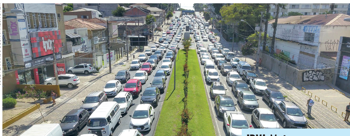
De acordo com o Departamento de Trânsito do Paraná (Detran/PR), atualmente são 8.528.604 veículos ativos no Estado