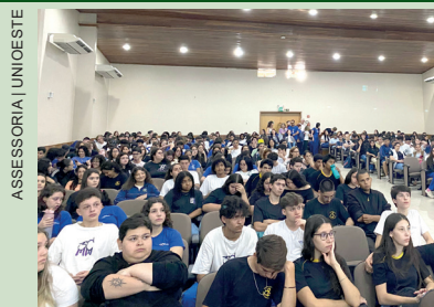
ASSESSORIA | UNIOESTE

A Universidade Estadual do Oeste do Paraná (Unioeste), campus de Cascavel, realizou nesta quinta-feira (24), a UnioXP – Feira das Profissões da Universidade. Uma oportunidade para que estudantes de toda região conheçam um pouco da força da Unioeste. Ao longo do dia, mais de cinco mil estudantes de Cascavel passaram pelo campus. As próximas edições acontecem no campus de Marechal Cândido Rondon, no dia 29 de outubro e no campus de Toledo em 06 de novembro. O vestibular Unioeste 2025 acontece no dia 15 de dezembro e as inscrições estão abertas até o dia 11 de novembro, às 17h. São mais de 60 cursos, distribuídos em cinco campi (Cascavel, Foz do Iguaçu, Francisco Beltrão, Marechal Cândido Rondon e Toledo).