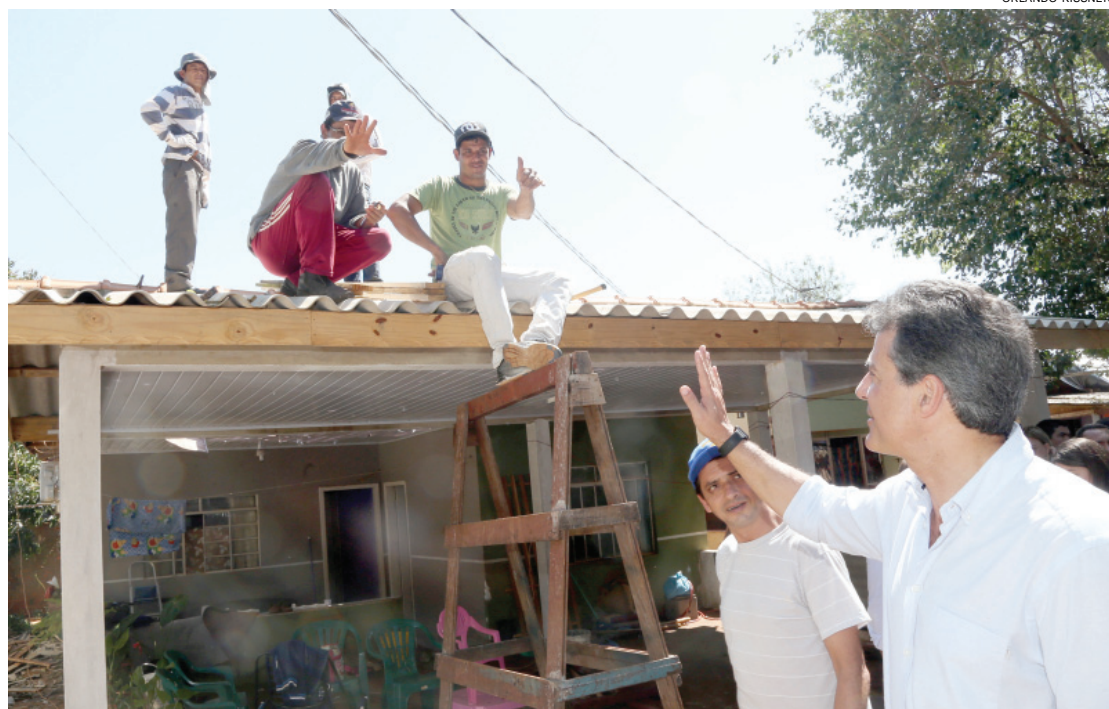
O governador Beto Richa visitou Foz do Iguaçu para acompanhar os trabalhos da Defesa Civil

NÚMEROS NO PARANÁ 39 municípios atingidos 112.425 afetados 25.134 casas danificadas 3.309 pessoas desalojadas 72 desabrigados 27 feridos 62 permanecem desabrigados