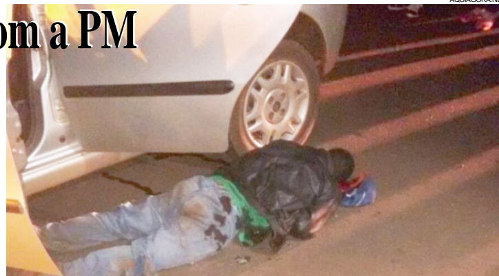
Homem foi morto ao reagir à abordagem policial depois de um assalto

Com a prisão do homem, os policiais descobriram que a dupla teria praticado um assalto em Santa Helena, onde roubaram uma caminhoneta S10 e eletrônicos. O veículo foi