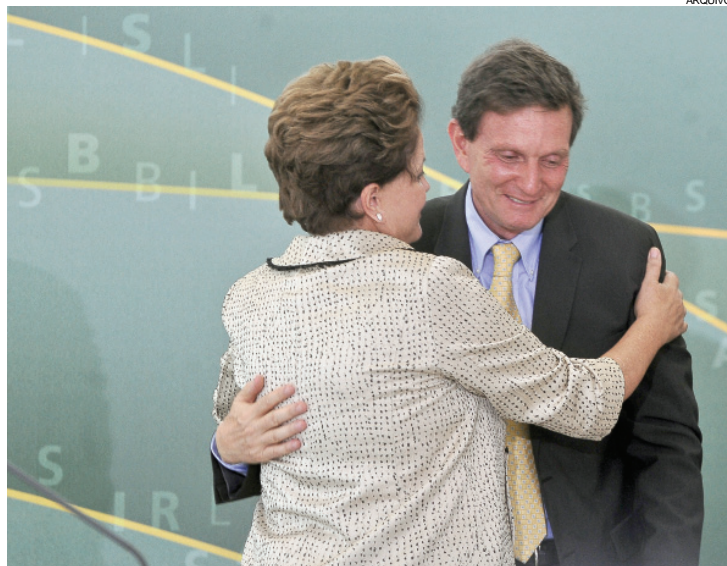
A passagem de Crivella pelo ministério de Dilma não deixou saudades

nização das Nações Unidas para Agricultura e Alimentação e a ICCAT (Comissão Internacional para Conservação do Atum Atlântico). Os números, segundo o relatório, foram divulgados mesmo com manifestação contrária da área técnica do ministério sobre a confiabilidade dos dados.