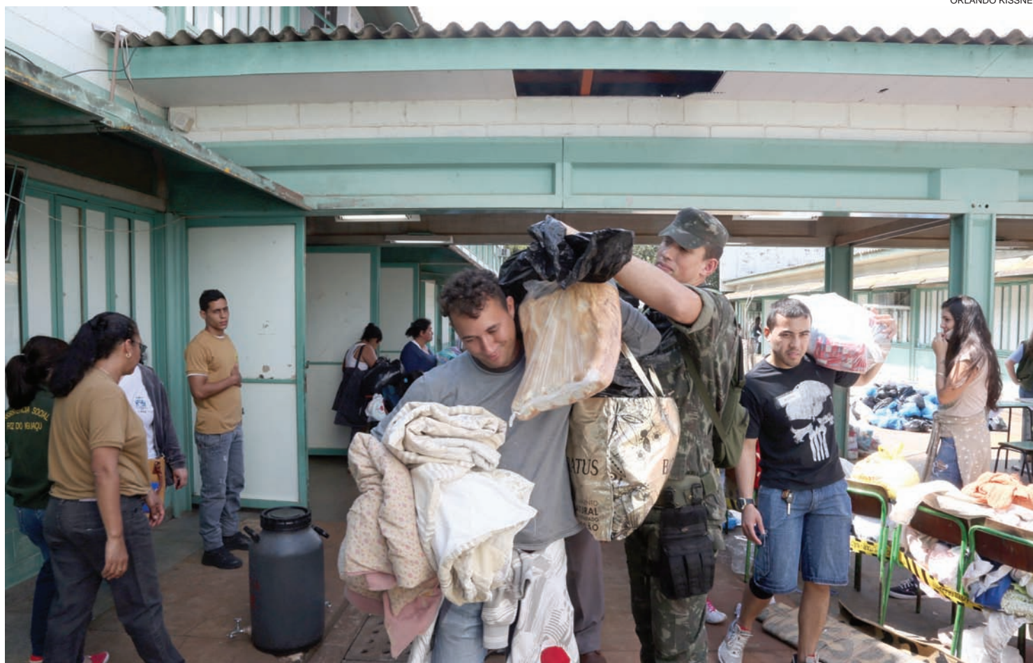
Em Foz do Iguaçu, ontem foi mais um dia de muito trabalho para socorrer as vítimas do temporal do início da semana