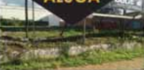
Centro. terreno com 1.390 m 2 do lado de shopping, posto de combustível e toda a comercial local. R$4.000,00 REF: TE0092