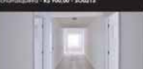
Centro. sala comercial com 70m 2 na Rua Paraná. R$ 10.000,00 - SA0119

São Cristóvão. 250 m 2 , 3 salas, copa, cozinha suíte e 2 quartos, lavanderia dependência de empregada, edícula, e garagem para 06 carros descoberto. R$1.500,00 CA0342