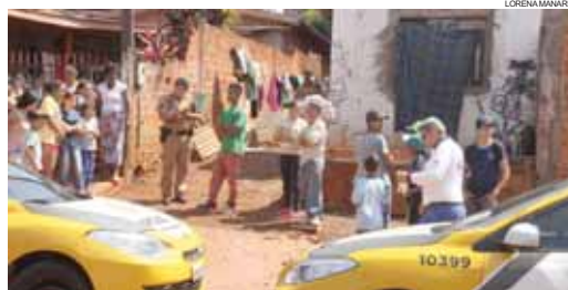
Testemunhas contaram que o criminoso não deu nenhuma chance de defesa à vítima

Outras sete pessoas, sendo três adultos e quatro crianças, estavam na casa no momento do crime. Segundo elas, o homicida usava capacete preto e camisa listrada. Ele teria dito para que todos ficassem em si-