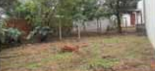
Parque São Paulo. com 352 M 2 de festada principal, sendo 12m x 46m, com casa em madeira contendo 4 dormitórios + 01 1/2 suíte. R$ 400.000,00. Ref: TE0132.

estar e jantar, cozinha independente, área de serviço, churrasqueira e garagem para 02 veículos. R$175.000,00. CA0300