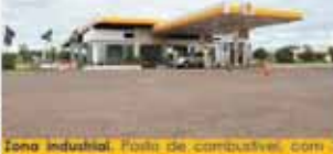
Zona Industrial. Posto de combustível, com 32 bicos de abastecimento, tançagem para 180 mil litros, loja de conveniência, churrasqueira, restaurante, barbearia e mecânica. Escritório, sistema telemed, padão novo exigido pelo IAP e rampas. R$ 15.000.000,00. Ref: PT0009

dormitórios, sala de estar e jantar, cozinha, bwc social, área de serviço, 01 vaga de garagem. R$: 155.000,00. Ref: SO0176.