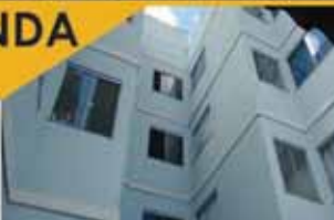
Canadá. 2 quartos, sala, Wc social, Cozinha e 1 vaga de garagem coberta. R$: 138.000,00. Ref. AP0329.