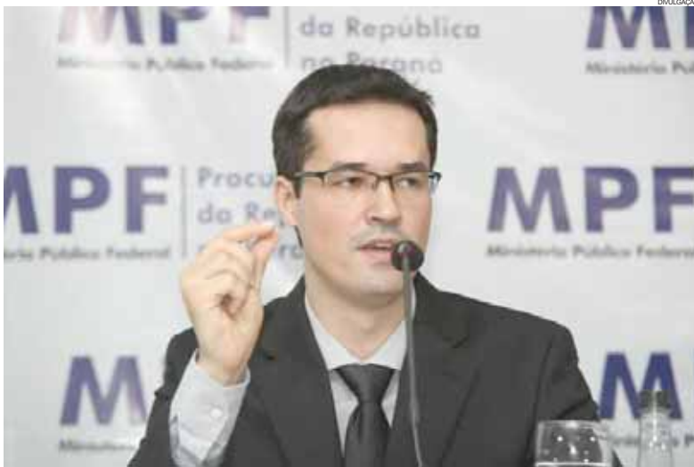
Para Dallagnol, o momento é oportuno para apertar o cerco aos corruptos

São Paulo - O procurador da República Deltan Dallagnol, chefe da força-tarefa da Operação Lava Jato, disse ontem que os crimes de corrupção no Brasil matam mais do que os de homicídio. Em sua exposição no lançamento oficial da campanha "10 Medidas contra a Corrupção" em São Paulo, ele acrescentou a Lava Jato chegou a tal ponto no País que o tema corrupção virou corrente em