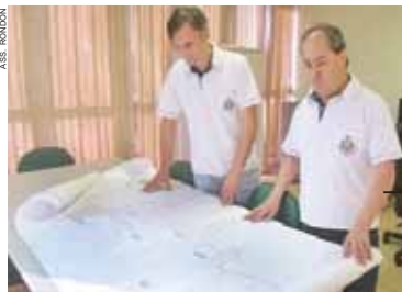
Técnicos analisam mapa do perímetro urbano de Rondon

“A recomendação é que, antes de ser realizada uma compra de imóvel, deve-se verificar o estado legal do local, junto ao registro de imóveis e na prefeitura, por meio do Departamento de Urbanismo. Nunca se deve comprar uma área rural menor que 20 mil metros, pois essa área deve ser destinada a produção agrícola e não para constituir um núcleo habitacional”, aponta Mauro Donha.