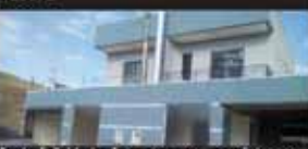
Santa Felicidade. Sobrado novo, com sala copo cozinha conjugada, Lavanderia, 02 quartos com sacada e Banheiro, Garagem fechada. Área com churrasqueira - R$ 900,00 - SO0213