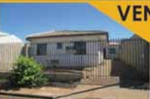
Santa Felicidade. sendo 03 casas com a mesma planta, contendo 02 dormitórios, sala e cozinha conjugada, BWC social. R$200.000,00. Ref. CA.0097

Canadá. 70 M 2 de área construída, contendo, 02 quartos, sendo uma suíte, banheiro, sala de