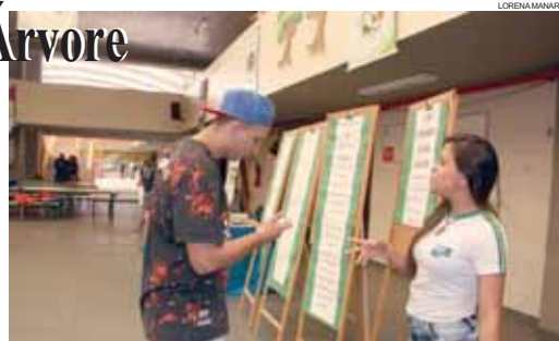
Orientações foram repassadas à comunidade escolar no dia de ontem

a quantidade de folhas de caderno descartadas, sendo algumas sem nada escrito, surpreendeu os estudantes. "Nós não temos noção do tanto de papel que é descartado. Pensamos que não é muito e por meio desse monitoramento tentamos conscientizar os colegas. Lembramos também que para se produzir uma folha são necessários 540 litros de água", relata a aluna do 2º ano do curso Técnico em Meio