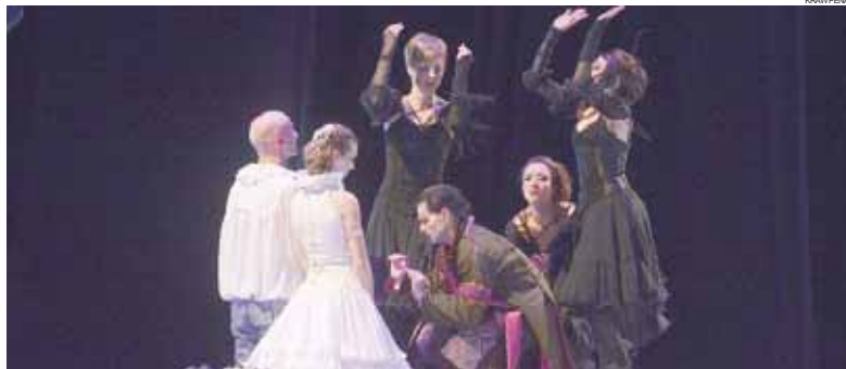
O espetáculo está marcado para as 20h e a entrada será gratuita

dança do mundo, como o Bolshoi. Cada participante terá que pagar R$ 30 e inscrições. Mais informações pelo telefone 3902-1370.