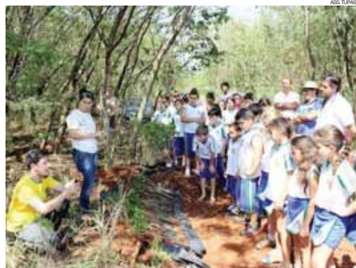
Antes de colocar mãos à massa, alunos aprenderam sobre como fazer o cultivo. Projeto busca reflorestar áreas degradadas

Nos últimos dias, os alunos participaram de atividades de educação ambiental em sala de aula, com o objetivo de mostrar a importância de se plantar uma árvore. Nos próximos dias, mais turmas devem participar do projeto para reflorestamento e recuperação de áreas do município.