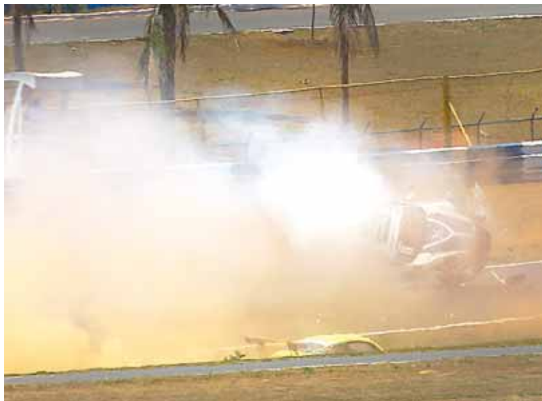
Dados do carro indicam a saída do solo a 169,3 km/h e que a aceleração no ar atingiu 12,7 vezes a força da gravidade

ração combinada máxima (momento em que o carro está girando) atingiu 12,7 G. Para efeito de comparação: um piloto de caça enfrenta forças de até 8 G, enquanto um astronauta tem treinamentos para fazer o corpo suportar até 9 G.