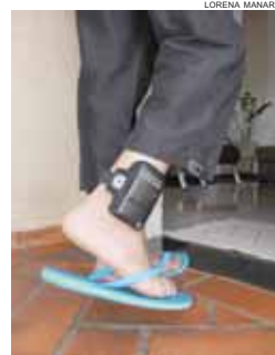
Equipamento reduz custo de cada preso de R$ 2 mil para R$ 241 mensais