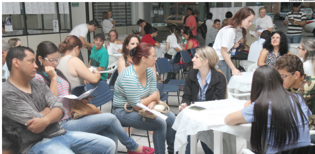
Movimento nas agências do trabalhador aumentou. Busca é por novas oportunidades de trabalho

“Infelizmente, as vagas no mercado de trabalho caíram bastante. Neste último mês, tivemos vários setores com saldo negativo, principalmente serviços, comércio e construção civil, que vinham de boas séries”, relata o gerente da Agência do Trabalhador de