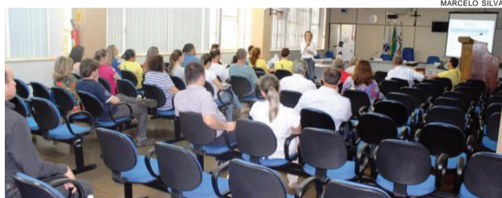
Sintrascoopa realizou duas assembleias para votar proposta patronal, encerrando as negociações

Negociações duraram cerca de 90 dias na região; ameaça era parar atividades nos abatedouros