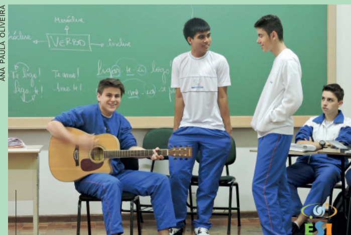
Alunos encantaram a turma com suas vozes

Para encerrar o 3º bimestre, unindo o conteúdo à música, os alunos foram até a 3ª série do Ensino Médio interagir com os colegas a fim de dividir a experiência da troca de conhecimento e de acolhida.