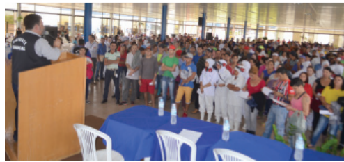
Audiência foi realizada nesta semana, na Câmara de Palotina