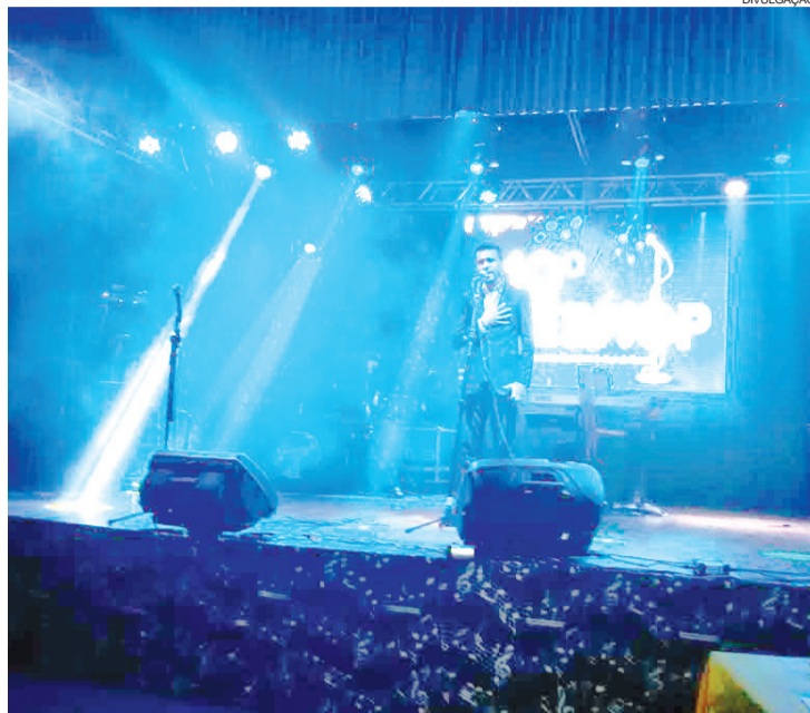
Vinte e um candidatos estarão disputando o título em três categorias