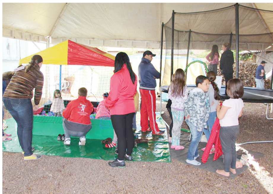
Crianças participam de brincadeiras na piscina de bolinhas e na cama elástica