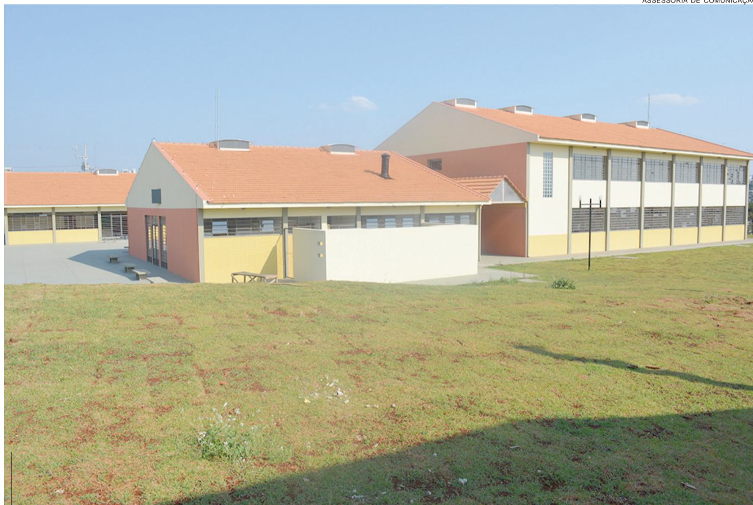
Escola terá capacidade para atender 1.080 alunos