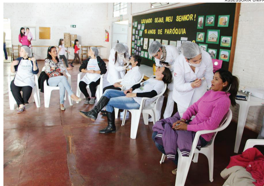
Estética e Cosmética oferece maquiagem e limpeza facial

Toledo - Os acadêmicos dos cursos de Educação Física e Estética e Cosmética da Unipar, com a supervisão dos professores das duas áreas, participaram de uma tarde cultural no Jardim Coopagro, em Toledo.