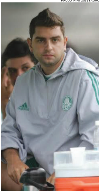
Lulinha confirmou o recebimento de recursos da M&M

Para ser publicada, a MP passou pelo crivo da então ministra da Casa Civil, Dilma Rousseff. Anotações de um dos envolvidos no esquema descrevem também uma reunião com o então ministro Gilberto Carvalho para tratar da norma quatro dias antes de o texto ser editado.