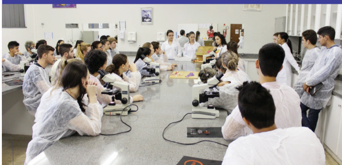
Tecido sanguíneo – Turma conhece laboratório de Hematologia