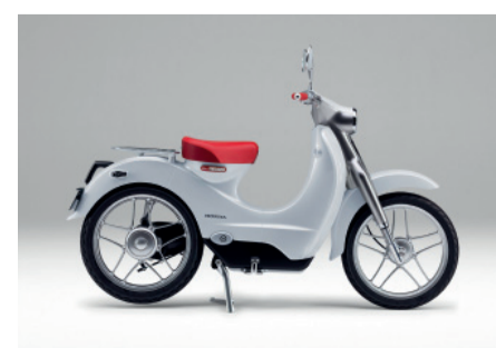
EV-Cub Concept 2015.09.30