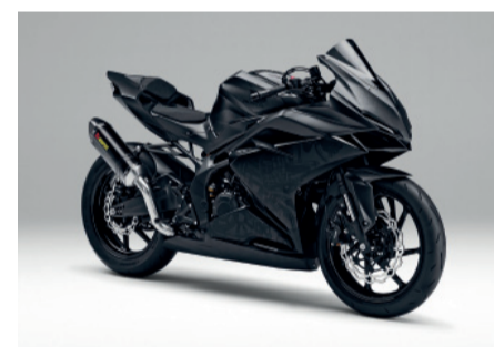
Light Weight Super Sports Concept 2015.09.30