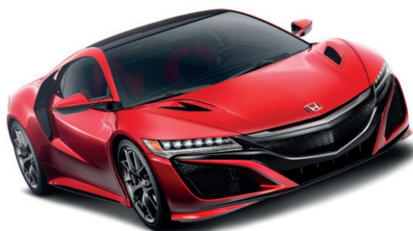
All-new NSX 2015.09.30