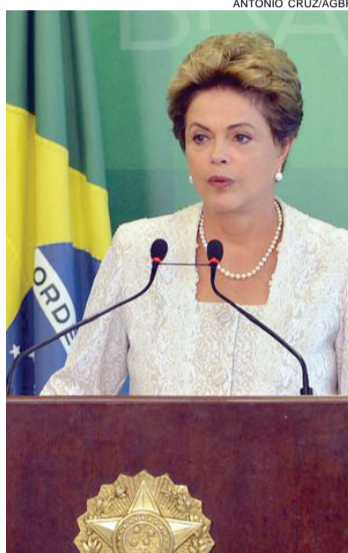
A reforma de Dilma ampliou o espaço no PMDB no governo

“O Estado brasileiro, em especial o Executivo, deve estar preparado para assumir uma dupla função. De um lado, ser o parceiro da iniciativa privada. E de outro assegurar igualdade de oportunidades a todos os cidadãos e cidadãs brasileiros. Por isso, melhorar a gestão pública federal é um desafio constante”, disse Dilma ao anunciar as mudanças. “A fusão de alguns ministérios tem um objetivo claro: fortalecer e dar maior eficiência e maior foco às políticas públicas”, reforçou.