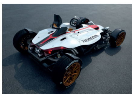
Honda Project 2&4 powered by RC213V 2015.09.30