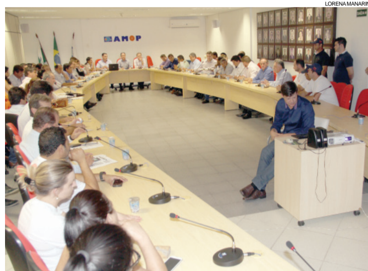
Prefeitos se reuniram ontem na Amop para definir aporte ao Consamu

O deputado federal Zeca Dirceu anunciou na quarta-feira que o Ministério da Saúde autorizou investimentos mensais de R$ R$ 673,3 mil no Consamu. O documento que garante a liberação regular dos recur-