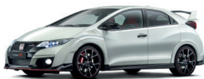
All-new Civic Type R 2015.09.30