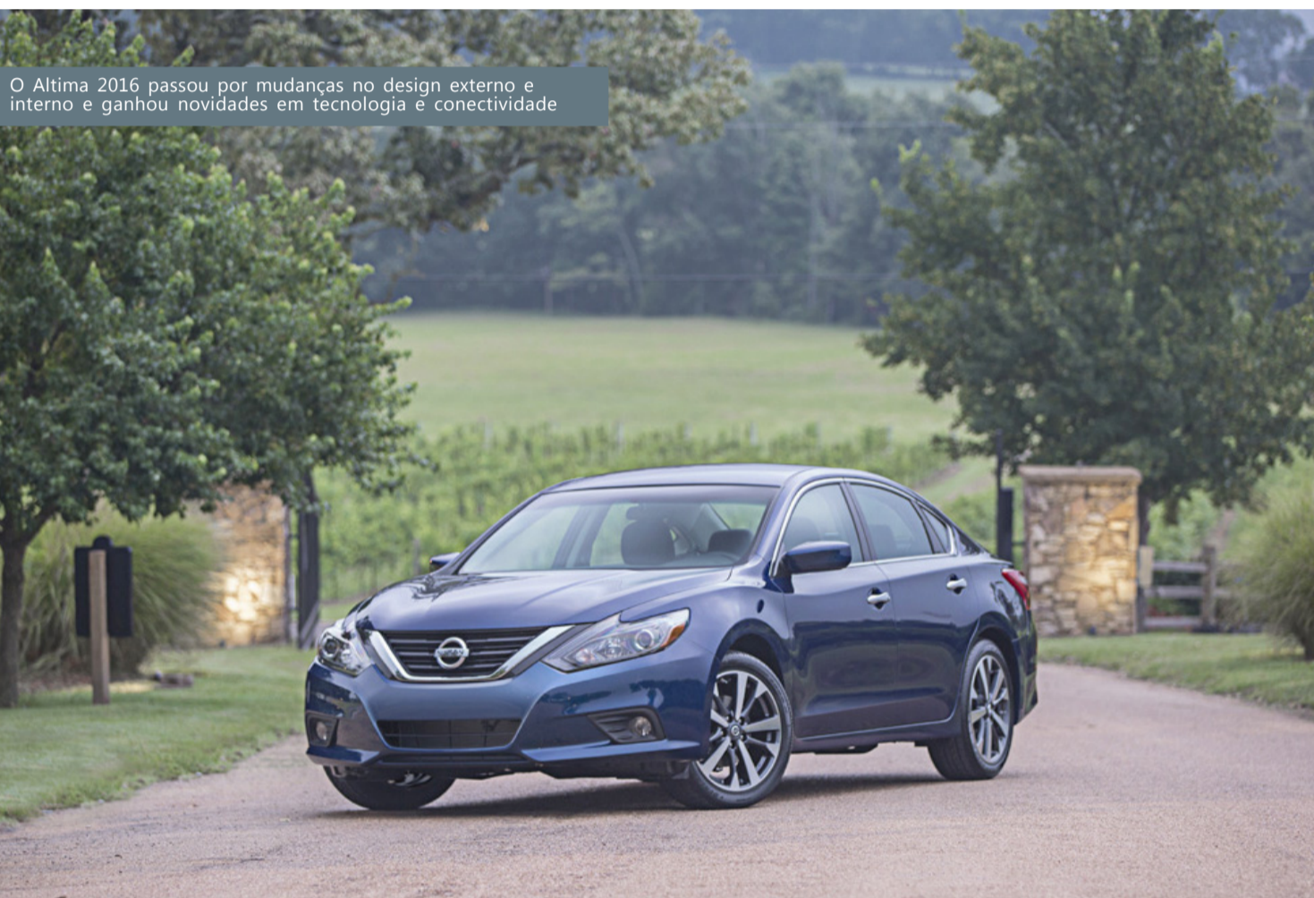
O Altima 2016 passou por mudanças no design externo e interno e ganhou novidades em tecnologia e conectividade

O sensor de oxigênio, também conhecido como sonda lambda, é responsável pela análise da condição da queima de combustível, sendo imprescindível no controle de emissão de poluentes e no consumo. A peça compara a concentração de oxigênio nos gases do motor com o ar ambiente, possibilitando o ajuste da quantidade de combustível injetado na câmara de combustão. Este processo promove a melhor relação entre desempenho, consumo e emissões. A sonda com funcionamento irregular pode acelerar a deterioração de outras peças, como o catalisador.