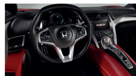
All-new NSX 2015.09.30