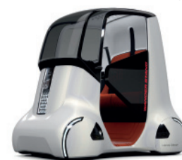
Honda WANDER STAND CONCEPT 2015.09.30