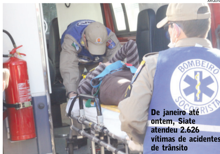
De janeiro até ontem, Siate atendeu 2.626 vítimas de acidentes de trânsito