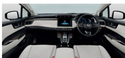
All-new FCV (tentative name) 2015.09.30