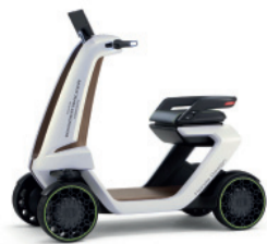
Honda WANDER WALKER CONCEPT 2015.09.30