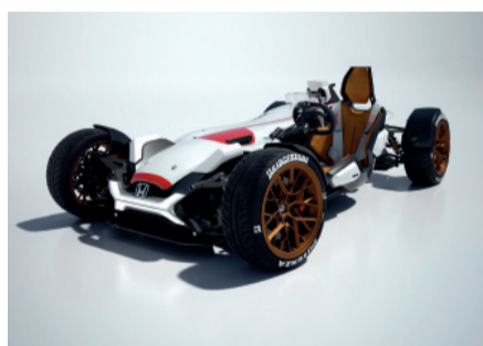
Honda Project 2&4 powered by RC213V 2015.09.30