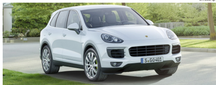
A Cayenne S E-Híbrida plug-in é o primeiro híbrido plug-in no segmento SUV Premium

bateria em 15 minutos - no Salão do Automóvel internacional em Frankfurt, a Porsche Brasil também mostrará em seu estande as impressões do carro conceito e do campeão da Le Mans deste ano, o 919 Híbrido, enfatizando o comprometimento da marca em ser pioneira no que diz respeito a tecnologia de carros híbridos e elétricos.