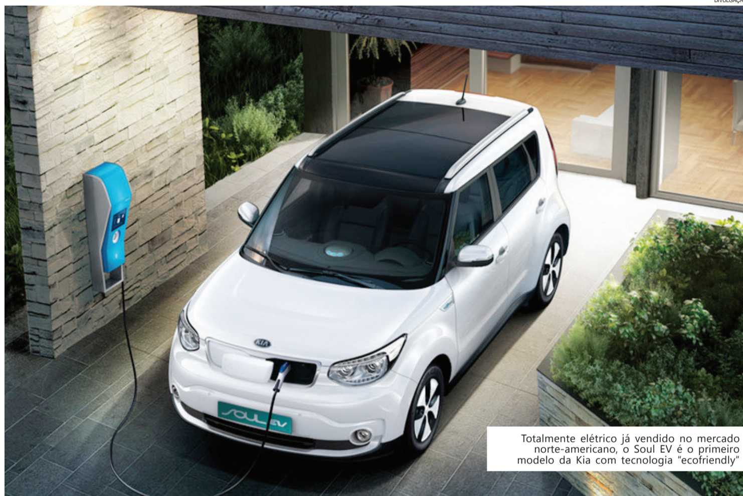
Totalmente elétrico já vendido no mercado norte-americano, o Soul EV é o primeiro modelo da Kia com tecnologia "ecofriendly"

apresenta um novo e diferenciado desenho da grade dianteira, iluminação com LED exclusiva, novo logo híbrido e bancos de couro.