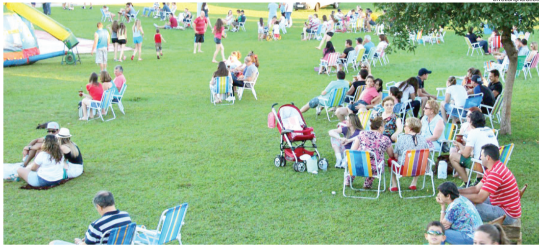
Parque Ecológico Diva Paim Barth será um locais que sediará a Virada Cultural de Toledo

Toledo - A Virada Cultural de Toledo ocorrerá de 8 a 15 de novembro e já está com inscrições as inscrições de artistas e grupos abertas desde quinta-feira. Os interessados podem se inscrever por meio do link https://goo.gl/forms/GJ9gMeHB2H até o próximo dia 16. O Município bancará sozinho o evento, que será realizado no palco do Teatro Municipal, no Parque Ecológico Diva Paim Barth e em outros locais.