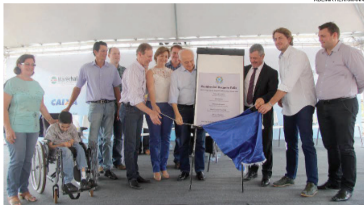
Autoridades por ocasião do descerramento da placa que marcou a entrega das 200 residências: acesso mais fácil à casa própria

Rondon - O semblante de felicidade e satisfação em estar realizando o sonho de ter a casa própria esteve evidente no rosto das famílias contempladas com unidades habitacionais do Conjunto Residencial Recanto Feliz. Integrantes da Caixa Econômica Federal e da Secretaria de Assistência Social estiveram na manhã de ontem supervisionando a assinatura dos contratos e a entrega das chaves a 200 famílias de Marechal Cândido Rondon que foram contempladas.