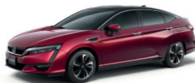
All-new FCV (tentative name) 2015.09.30