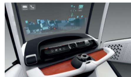
Honda WANDER STAND CONCEPT 2015.09.30