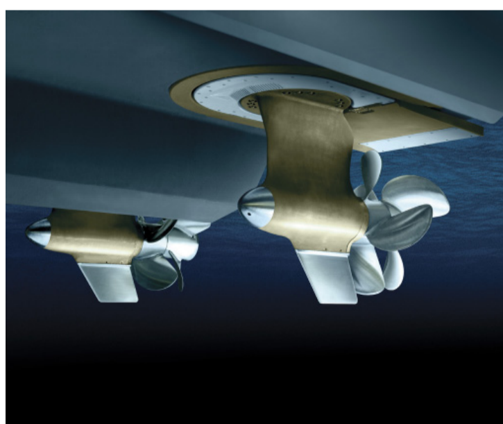
A maior embarcação já produzida pela Real Power Boats traz duas motorizações Cummins, totalizando 1.200 hp de potência