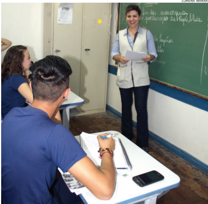
Manter o foco de alunos no conteúdo é desafio na era tecnológica

O dever de mostrar às turmas o quanto o estudo é importante para um futuro melhor, faz parte da sua missão. “A questão cultural e os ideais mudaram muito. Verifico que falta maturidade e parte dos alunos vem à sala por obrigação. O ide-