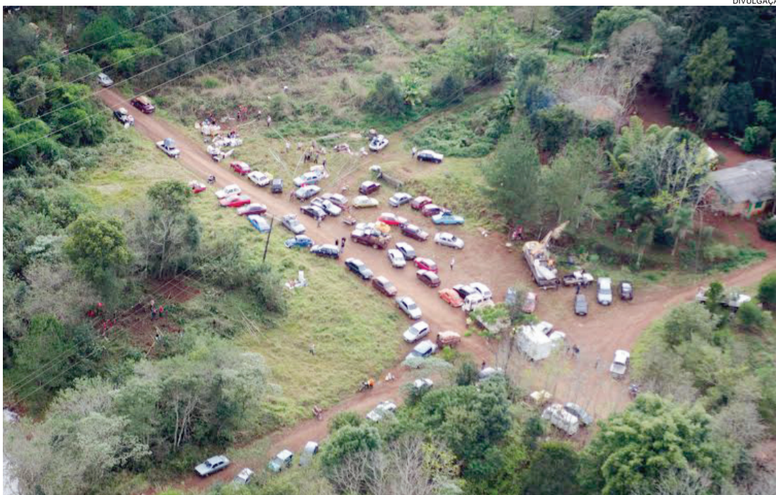
Justiça determinou a reintegração de posse de duas áreas à Araupel

O MST é uma das provas contundentes do sério estado de enfermidade do Brasil, que raras vezes enfrentou tão aguda crise de ética, de moral e de estabilidade política e jurídica. O MST virou uma espécie de cartel ao enriquecimento ilícito de seus líderes. Até os minimamente letrados sabem o que governo e setores da Justiça parecem não compreender e aceitar, que o MST é uma facção criminosa que espalha medo, desordem e terror por onde passa.