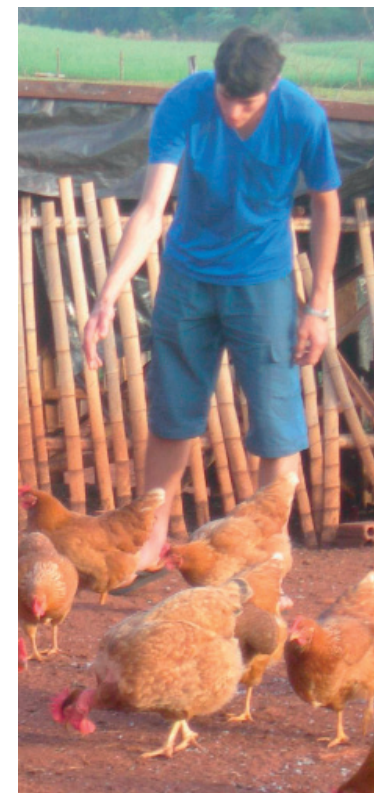
A agricultura familiar é uma atividade bastante explorada na região Sudoeste

O limite de venda por agricultor familiar pessoa física é R$ 20 mil por ano, independentemente de já fornecerem para outras modalidades do Programa de Aquisição de Alimentos ou do Programa Nacional de Alimentação Escolar. O limite para pessoas jurídicas – cooperativas ou associações –