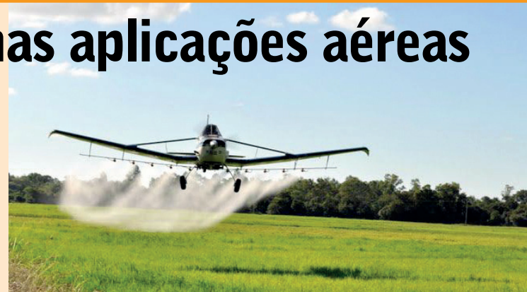
Objetivo é conscientizar pilotos e empresas de aplicação aérea da necessidade de conter os eventuais riscos ambientais existentes no trabalho de pulverização