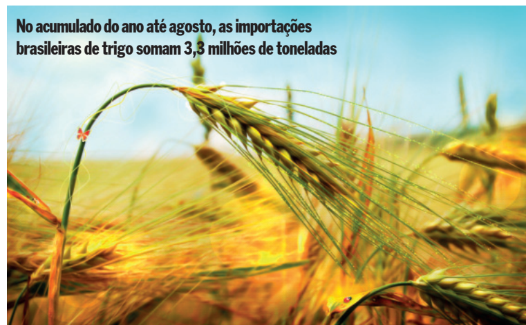
No acumulado do ano até agosto, as importações brasileiras de trigo somam 3,3 milhões de toneladas

O último dado da Conab (Companhia Nacional de Abastecimento) aponta uma colheita de 7 milhões de toneladas em 2015, aumento de pouco mais de 1 milhão de toneladas ante 2014, segundo previsão divulgada no início de setembro.