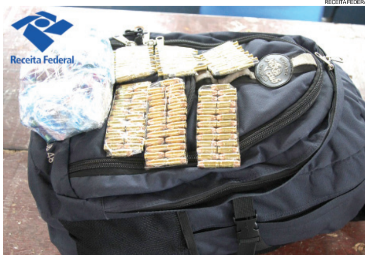
Munições de diferentes calibres foram encontradas em uma mochila

No estacionamento de um hotel foi encontrada uma Montana com placas de São Bento do Sul (SC) com a carroceria repleta de roupas, eletrônicos, brinquedos, acessórios para videogame e celulares, avaliados em R$ 9.400. Já em uma mochila na cabine do veículo os servidores encontraram 780 comprimidos de medicamentos e 99 munições calibre 32, 75 munições de calibre 380 e 25 munições calibre 36.