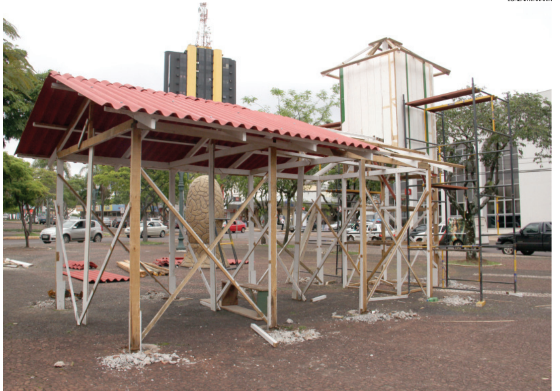
Estação de trem é o primeiro cenário natalino que está sendo montado pela prefeitura