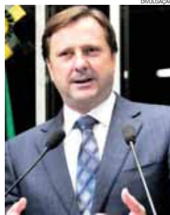
Senador Acir Gurgacz

ocorreu em 2002, quando concorreu a governador de Rondônia. Quatro anos mais tarde Acir disputou pela primeira vez uma vaga no Senado Federal e, apesar de obter mais de 210 mil votos, ficou em segundo, mas seis meses depois acabou assumindo diante da cassação do primeiro colocado, Expedito Júnior. Ele está agora no segundo mandato como senador e também é presidente estadual do PDT de Rondônia.