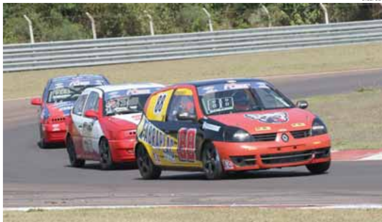
Marco Romanini e Beto Monteiro irão disputar a Cascavel de Ouro com um Renault Clio

dendo bem e isto nos dá boas perspectivas de vitória", completa.