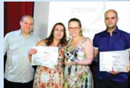
A agência Helg Assessoria de Comunicação & Marketing e a produtora Objetiva Cinema e Vídeo faturaram os prêmios ouro e prata na categoria Varejo

Cascavel - A RPC, empresa que faz parte do GRPCOM (Grupo Paranaense de Comunicação) e afiliada Globo do Paraná, divulgou na noite de quarta-feira os vencedores da sétima edição do Prêmio GRPCOM de Criação – Regional Cascavel, durante uma festa realizada no Holligans, para profissionais do mercado publi-