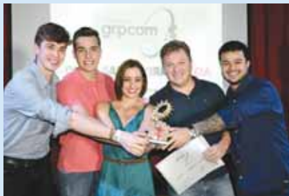
A agência M2COM Comunicação Integrada e a produtora Checkrel Productions foram as grandes vencedoras da categoria Institucional