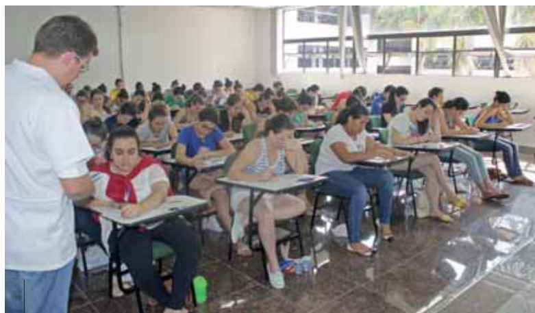
O resultado do vestibular já está disponível no Portal da FAG ( www.fag.edu.br/vestibular )

O resultado do vestibular já está disponível no Portal da FAG ( www.fag.edu.br/vestibular ). As matrículas, em primei-