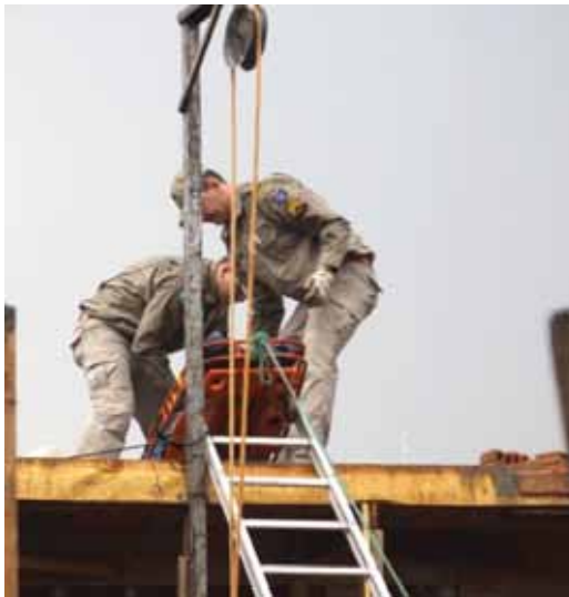
A garota tentou fugir escalando uma construção, mas morreu em seguida

Cascavel - A violência em Cascavel tomou proporções gigantescas nas últimas horas. Entre a noite de quarta-feira e a tarde de ontem, quatro pessoas foram assassinadas e uma sofreu uma tentativa de homicídio num intervalo de apenas 18 horas.