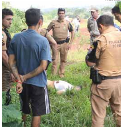
Adolescente estava em casa com amigos quando o criminoso chegou atirando

Poucas horas mais tarde, por volta da meia-noite, no Jardim Bela Vista, Mizael Pa-