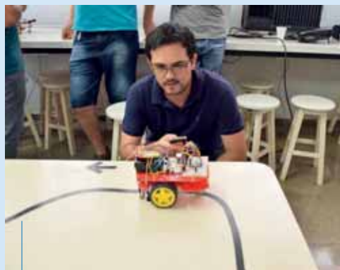
Depois de pronto, estudante faz teste em robô