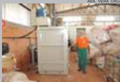
ASS. VERA CRUZ

A Associação de Catadores de Material Reciclável de Vera Cruz do Oeste recebeu prensa e três carrinhos de movimentação com big bag para reforçar suas atividades. Os materiais foram repassados pelo Projeto Resgatando Esperança da Cooperativa dos Agentes Ambientais de Foz do Iguaçu.