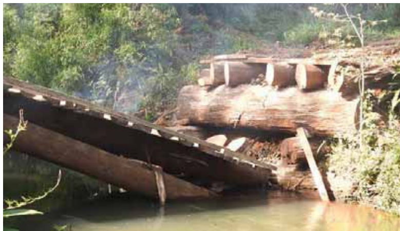
Ponte destruída pelo MST para forçar desapropriação da área

Julgamento de Carli Filho é marcado após mais de 6 anos