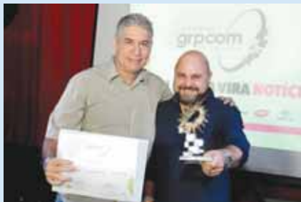
A agência Turbo Ideias conquistou o prêmio ouro na categoria Produtos e Serviços