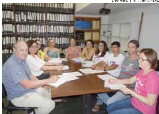
Representantes do NRE Toledo na escolha da comissão consultiva regional

Podem ser candidatos a diretores e auxiliares, servidores que pertençam ao quadro próprio do magistério, quadro único de pessoal, quadro de funcionários da Educação Básica ou ao quadro próprio do Poder Executivo. O prazo final para o registro das chapas é