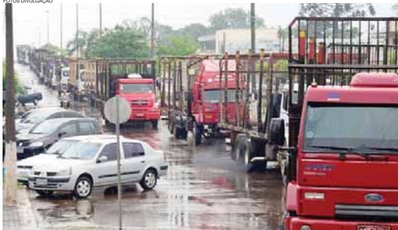
Caminhoneiros protestaram ontem fechando ruas no centro

Um protesto de transportadores autônomos de madeira bruta, terceirizados da Araupel, deu ontem uma dimensão do clima de tensão enfrentado por empresários, moradores e trabalhadores em Quedas do Iguaçu. O MST impede o acesso de caminhões a áreas de corte desde o último dia 4 e, sem matéria-prima, a reflorestadora reduziu drasticamente seu volume de trabalho. Sem receber, os transportadores temem não ter dinheiro para honrar os financiamentos dos caminhões. | Oeste 10