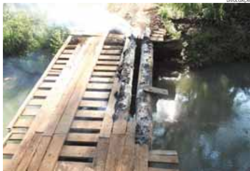
Ponte que leva a áreas de corte de madeira queimada por ação do MST. Araúpel tem reintegrações das áreas. Ordem cabe a governo estadual

O problema é agravado desde o último dia 4 com o bloqueio por membros do Movimento Sem-Terra de acessos à principal área de extração de madeira de reflorestamento da Araúpel. A região, conhecida por Lambari, fica no interior de Rio Bonito, divisa com Quedas. Os transportadores não conseguem passar devido a barricadas e à presença de sem-terra armados, que os impedem de seguir viagem. “Só queremos trabalhar, ga-