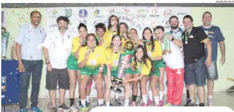
Equipe feminina de Cascavel é a maior vencedora do Paranaense de Handebol