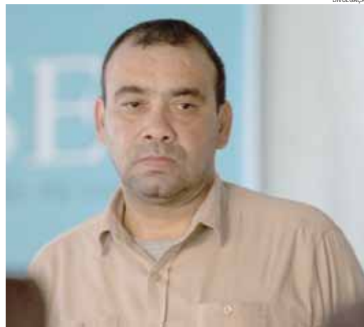
Wanderlei dos Anjos sofreu infarto fulminante no domingo

Cascavel - Morreu na manhã de domingo, em Cascavel, o ator e produtor teatral Wanderlei dos Anjos, 48 anos. Ele sofreu infarto fulminante. O corpo foi velado na capela mortuária central da Aceso e foi enterrado no