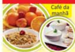
Café da manhã