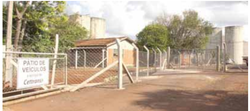
Novo pátio tem capacidade para dois mil veículos e conta com videomonitoramento