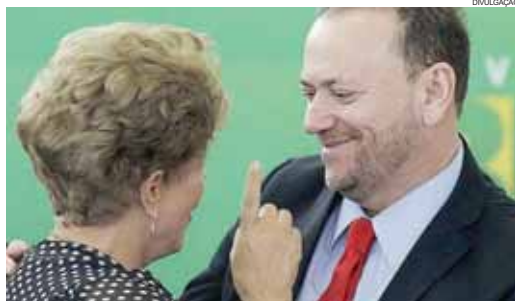
Presidente Dilma Rousseff e o ministro Edinho Silva

bate, que o projeto possa tramitar dentro do Congresso e esperamos que ele seja aprovado porque é fundamental para a construção da estabilidade fiscal".