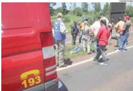
Quando os socorridos chegaram, a vítima já estava sem vida

A segunda aconteceu na noite de sexta-feira, quando uma mulher foi atingida por uma viatura do Serviço Re-