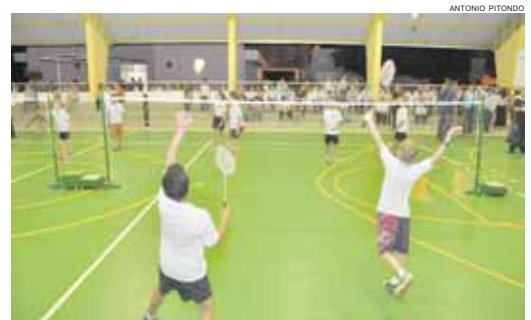
Após a solenidade, alunos da escola estream o novo espaço com uma partida de Badminton