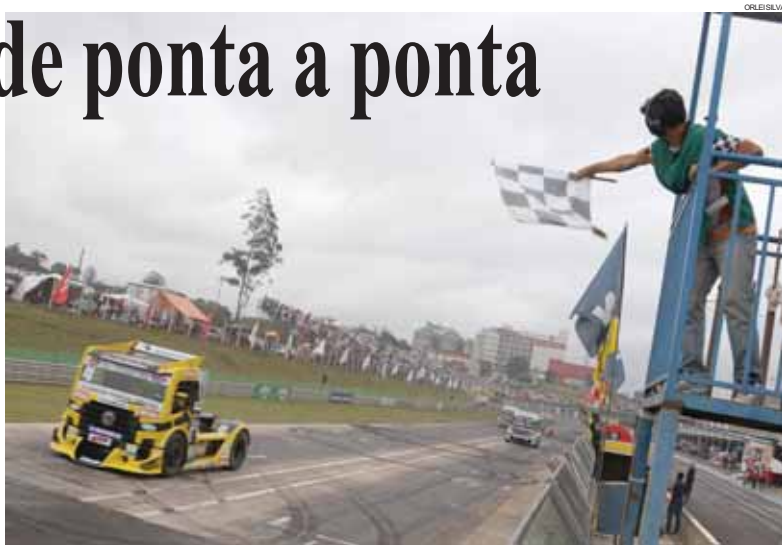
Felipe Giaffone largou na pole position e venceu a Fórmula Truck em Cascavel de ponta a ponta