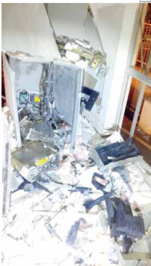
Além do prejuízo em dinheiro, a explosão deixou parte da estrutura comprometida