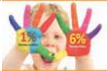
ILUSTRAÇÃO CAMPANHA DE INCENTIVO FISCAL IMPOSTO DE RENDA 2015

Palotina lança nesta quinta-feira uma campanha para estimular contribuições ao Fundo da Criança e do Adolescente. Pessoas físicas e jurídicas podem participar.