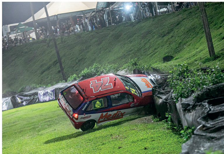
Os acidentes também fazem parte do show da Cascavel de Ouro