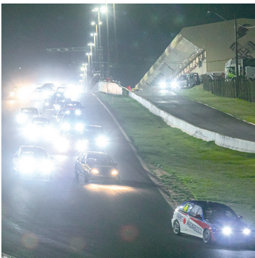
A prova à noite superou todas as expectativas