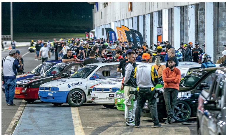
A agitação dos boxes mostrou a grandiosidade da Cascavel de Ouro