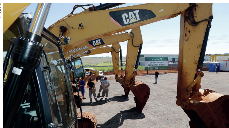
O Ecoparque Bairro Integrados deu início aos trabalhos para a construção de 4.600 apartamentos de até três quartos