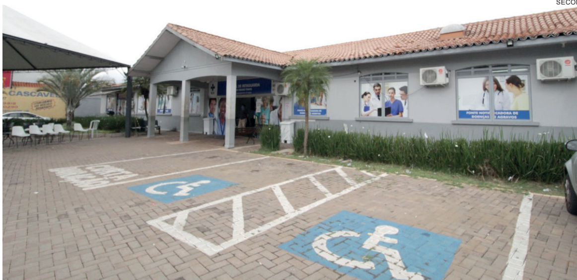
A reforma do Hospital da Retaguarda Allan Brame Pinho apresenta apenas 2,93% de conclusão

Entre as obras também foram apresentadas a revitalização do Terminal Rodoviário de Cascavel. Com um orçamento de R$ 19,49 milhões e previsão de conclusão para setembro de 2025, a obra iniciou em abril de 2024 e atingiu 19,25% de execução.