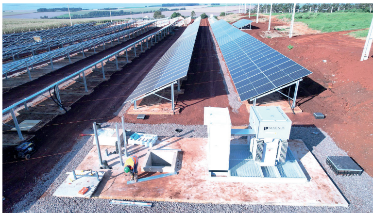
A construção da usina fotovoltaica está 78,37% concluída e deveria ser entregue em maio de 2024

Entre as obras também estão investimento em sustentabilidade, com a construção