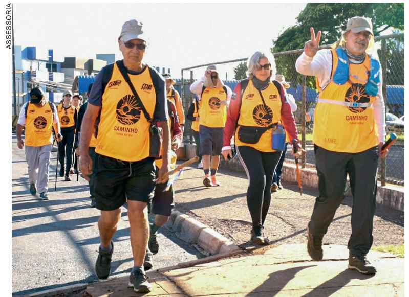
Os 42 peregrinos percorrerão pelo menos 33 km por dia

“O reconhecimento que o Caminho recebeu é algo muito gratificante. Não só pela organização do evento, mas pela transformação que ele gera em todos os participantes. Estamos cumprindo uma missão de conectar pessoas e oferecer uma