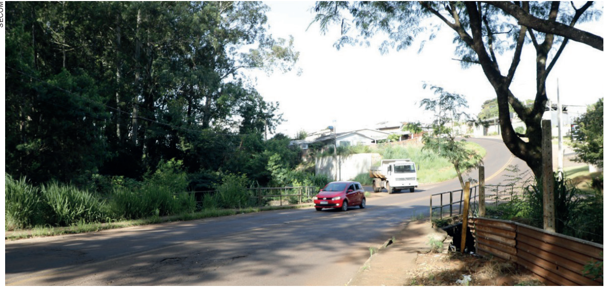
O local é conhecido por alagar em dias de chuva

Para isso, o projeto será executado em duas etapas, mas neste início não será necessário fechar a via. “A comunidade do 14 de Novembro não precisa ficar preocupada, não vamos fechar a rua. Inicialmente, vamos executar as vigas de concreto naquela rua ao lado do