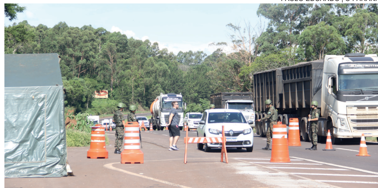
Foram montados pontos de bloqueio nas rodovias estaduais e federais em torno de Cascavel

investigações, outros questionamentos não puderam ser esclarecidos, como por exemplo, se ocorreu a vistoria na entrada e saída dos soldados que estavam de serviço, o que é um procedimento padrão do Exército Brasileiro. Contudo, o general disse que foram solicitados os celulares dos militares, e que posteriormente os aparelhos serão devolvidos para que os mesmos possam falar com seus familiares. "Todos estão bem alojados, sendo alimentados, orientados pelos seus comandantes, preparando seus equipamentos, ou participando de operações internas para também auxiliar nas buscas do material que está desaparecido", disse.