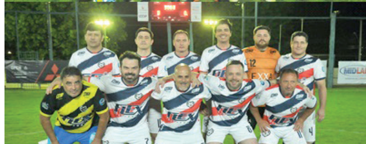
Os times entram em campo para a grande final do Campeonato de Futebol Suíço da AMC