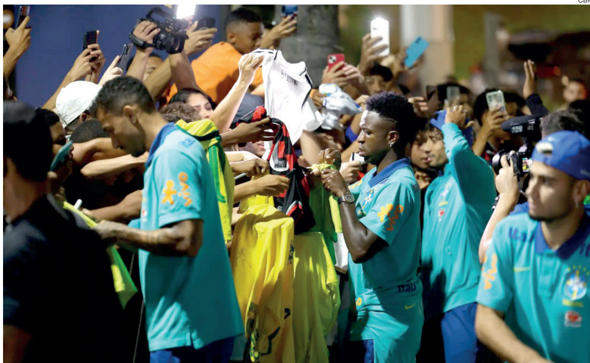
Seleção encara jogo difícil contra o Uruguai, mas conta com a torcida baiana

Com 17 pontos, o Brasil é o quarto colocado nas eliminatórias sul-americanas para a Copa de 2026, atrás de Argentina (22), Uruguai (19) e Colômbia (19). O confronto com a Celeste acontece na terça-feira, às 21h45 (de Brasília), na Fonte Nova, em Salvador, pela 12ª rodada.