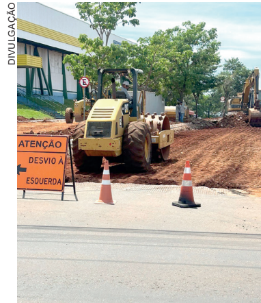
As quadras da Rua da Lapa estão bloqueadas pelo menos até o final do mês

Nesta segunda-feira (18) completou 14 meses do início dos trabalhos que começou na Travessa Cristo Rei no dia 18 de setembro de 2023. A previsão era de concluir os trabalhos em 15 meses, prazo que terá que ser prorrogado. Conforme Rancy, dentro do prazo será possível concluir toda a pavimentação, mas eles farão um aditivo no contrato de 140 dias para que a empresa conclua os trabalhos nas calçadas, ciclovia e coloque o ajardinamento no canteiro central. Com isso, a obra que teria que ser entregue no dia 18 de dezembro deste ano, terá até o começo de maio