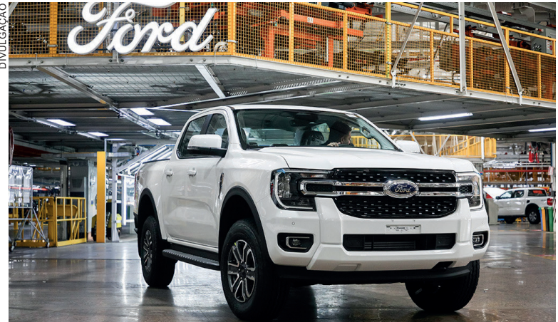
A Nova Ranger redefiniu o segmento de picapes médias, com uma aceitação extraordinária em todos os mercados da região e recorde de vendas no Brasil

Em 2024, a Ford comemora 110 anos de presença na Argentina e com esse investimento reforça o seu compromisso com o desenvolvimento do país e da região.