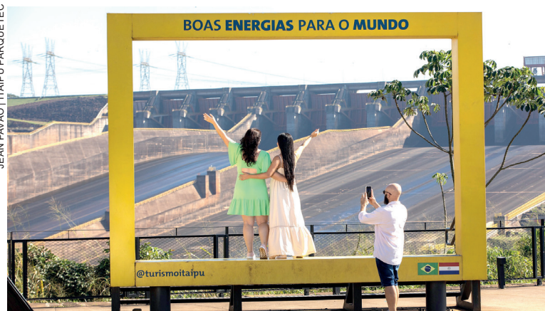
O movimento foi 27% maior do que o registrado no mesmo período do ano passado

Com 20 unidades geradoras e 14 mil MW de potência instalada, a Itaipu é líder mundial na geração de energia limpa