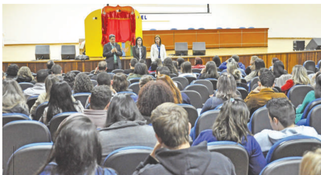
Alunos foram recebidos em evento para comemorar o Dia do Profissional do Rh

mesmo de ela iniciar" completa. Segundo a coordenadora, o evento possibilita a integração da teoria e da prática, tendo em vista que a apresentação de cases de empresas e dos depoimentos de egressos que estão atuando na área fazem com que os alunos percebam as dificuldades e necessidades práticas da profissão. Além disso, foram oferecidas palestras com profissionais diferentes daqueles da sala de aula, para que tenham contato com os mais diversos temas que possam contribuir para melhorar seu conhecimento. Os alunos gostam muito dessas oportunidades e da aprendizagem proporcionada de forma diferente do habitual", enfatiza Caroline.