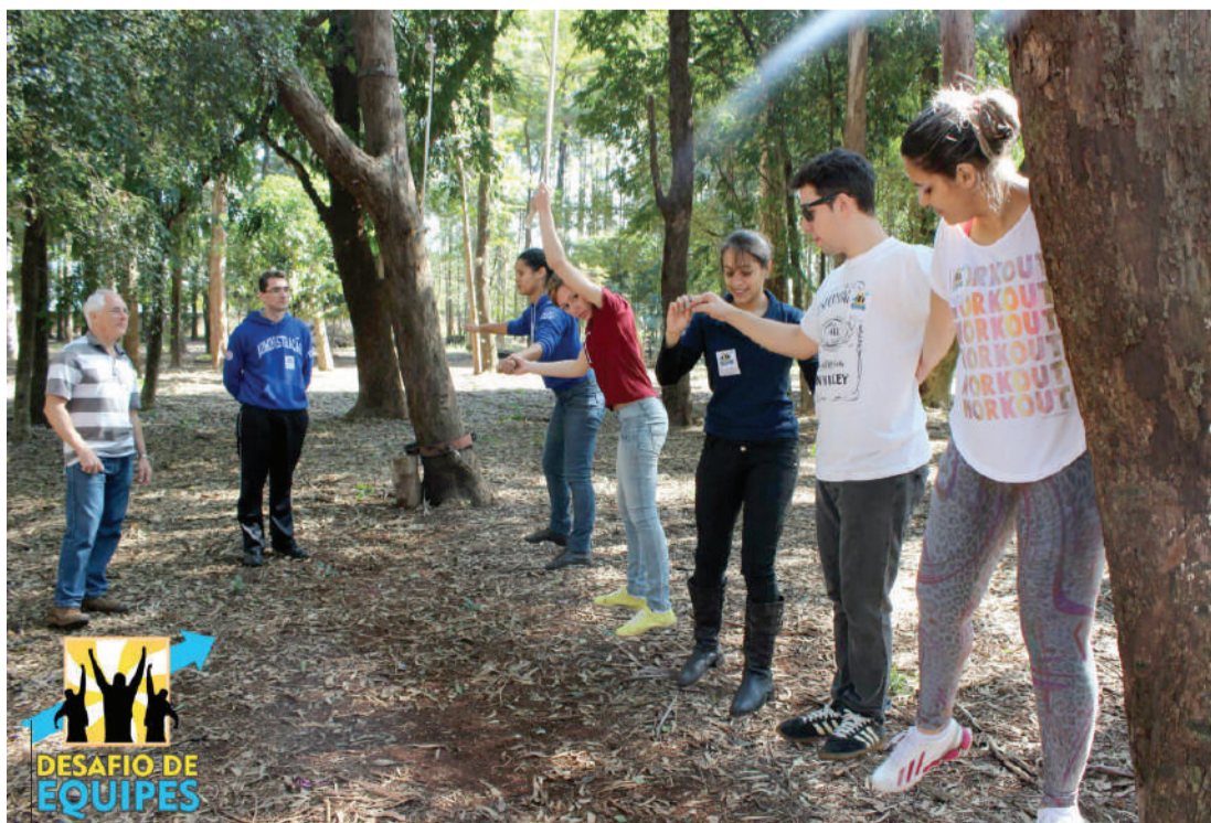
Estudantes da Unipar e PUC vivenciam atividades que serão trabalhadas no projeto