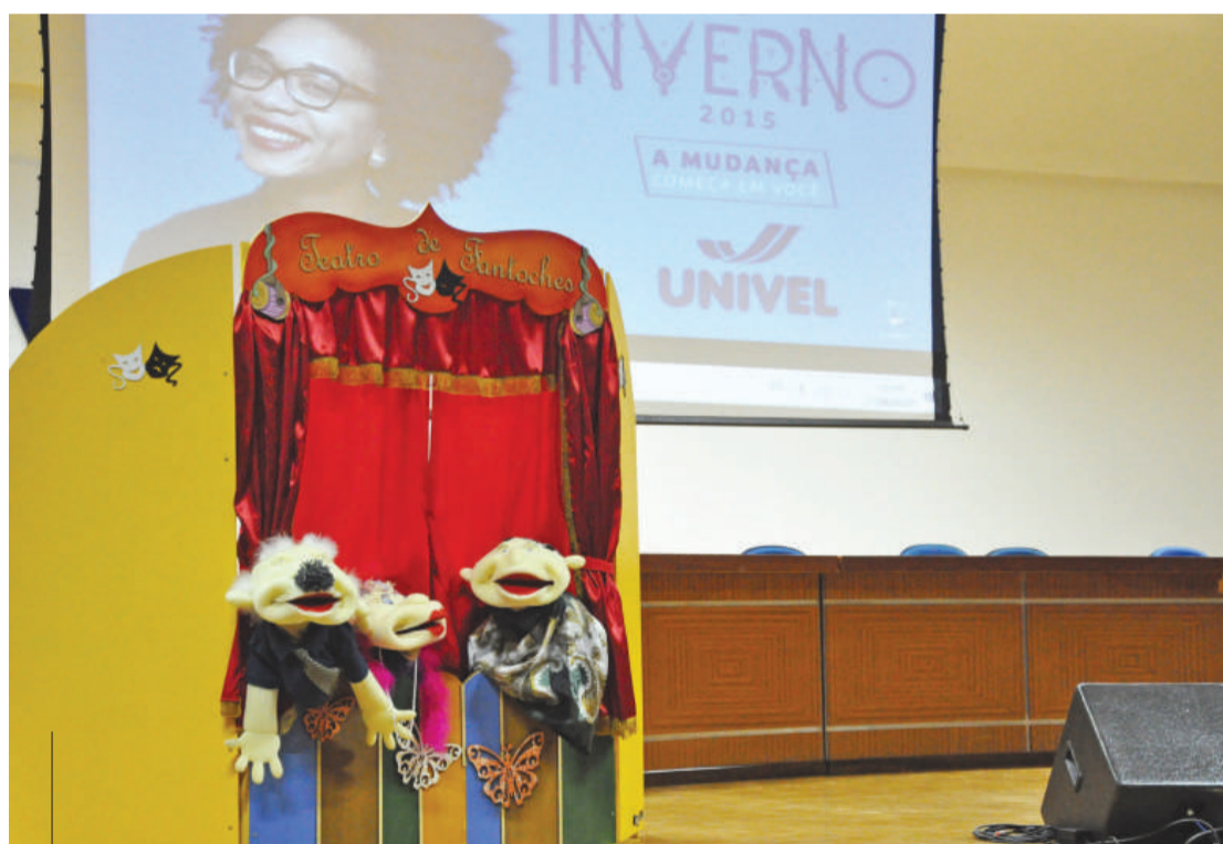
Fantoches trouxeram mensagens positivas envolvendo questões atuais