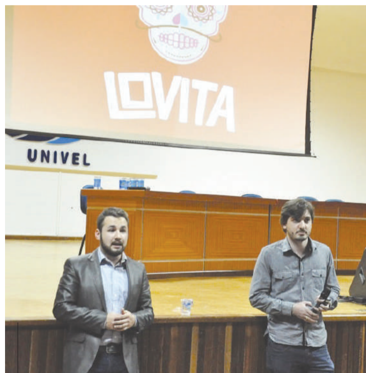
Egresso compartilharam experiência com os participantes