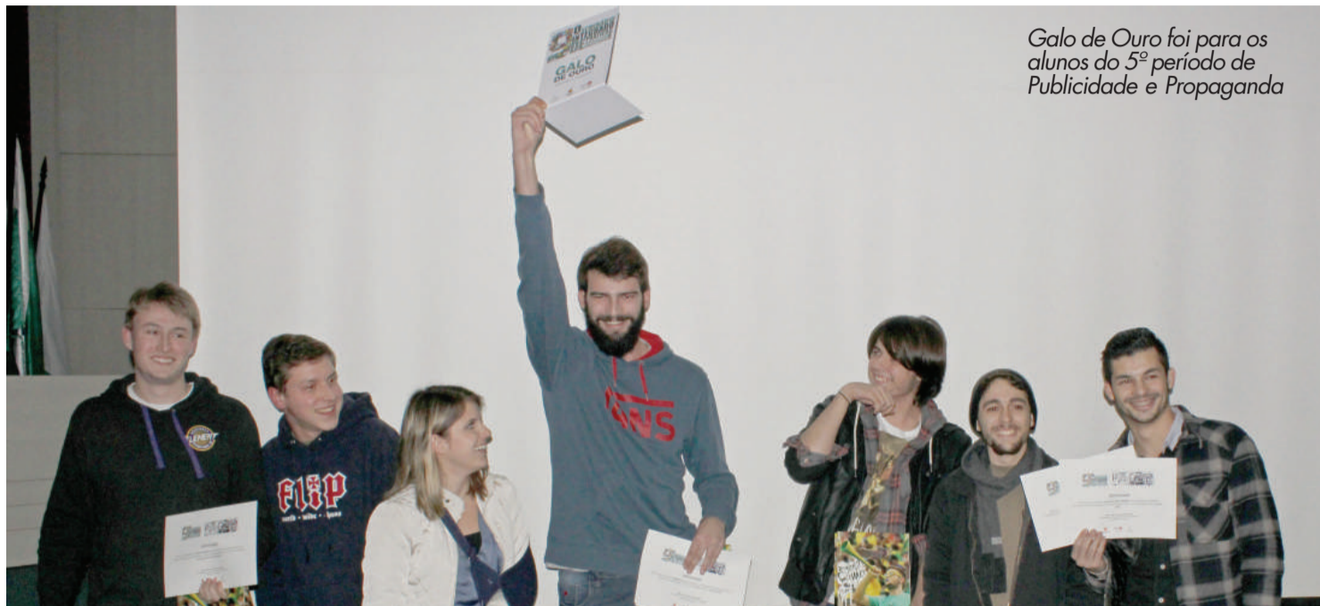
Galo de Ouro foi para os alunos do 5º período de Publicidade e Propaganda