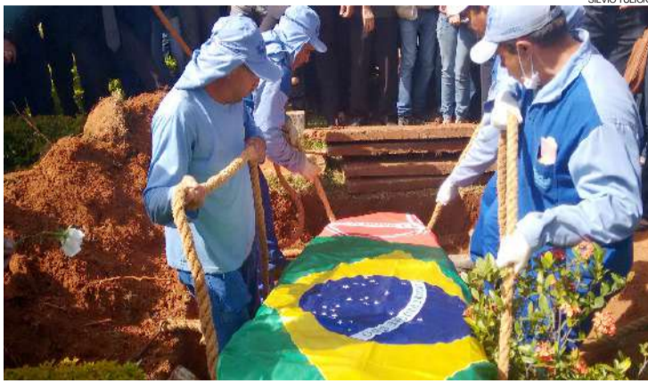
Cristiano Araújo é enterrado com as bandeiras do Brasil e do Vila Nova sobre o caixão

Diferente do previsto inicialmente, o corpo da namo-