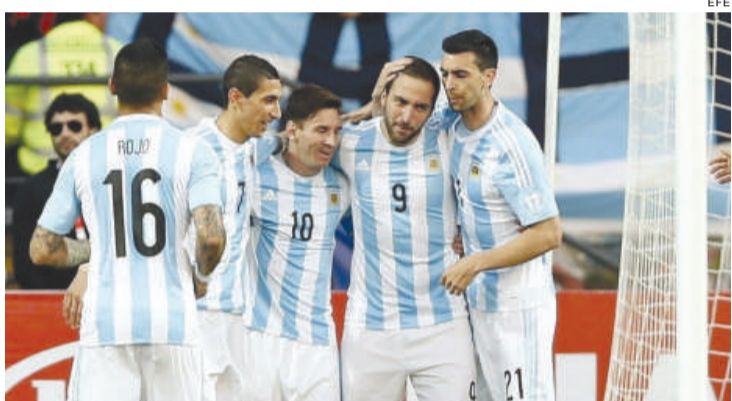
A estrelada seleção argentina ainda não apresentou o futebol esperado

O confronto é rico em história, e os colombianos são responsáveis por algumas humilhações passadas pelos argentinos. O mais comentado duelo entre os dois times foi em 1993, pelas Eliminatórias da Copa do Mundo de 1994, nos Estados Unidos. A Colômbia, em Buenos Aires, não tomou conhecimento da Argentina e aplicou uma humilhante goleada por 5 a 0. Seis anos depois, a humilhação seria de um famoso artilheiro argentino. Martín Palermo conseguiu o feito de desperdiçar três pênaltis no mesmo jogo e não evitou os 3 a 0 para a Colômbia pela fase de grupos da Copa América do Paraguai. Porém, no duelo mais famoso pelo torneio continental os argentinos levaram a melhor, ganhando por 2 a 1 na última rodada do quadrangular final de 1991, no Chile. O resultado deu o título da Copa América para os hermanos.