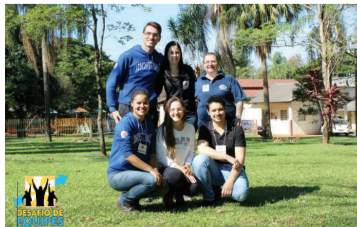
Equipe da Unipar auxiliará nas atividades

Unipar e PUC. O grupo conheceu o percurso e as atividades que serão trabalhadas no projeto.