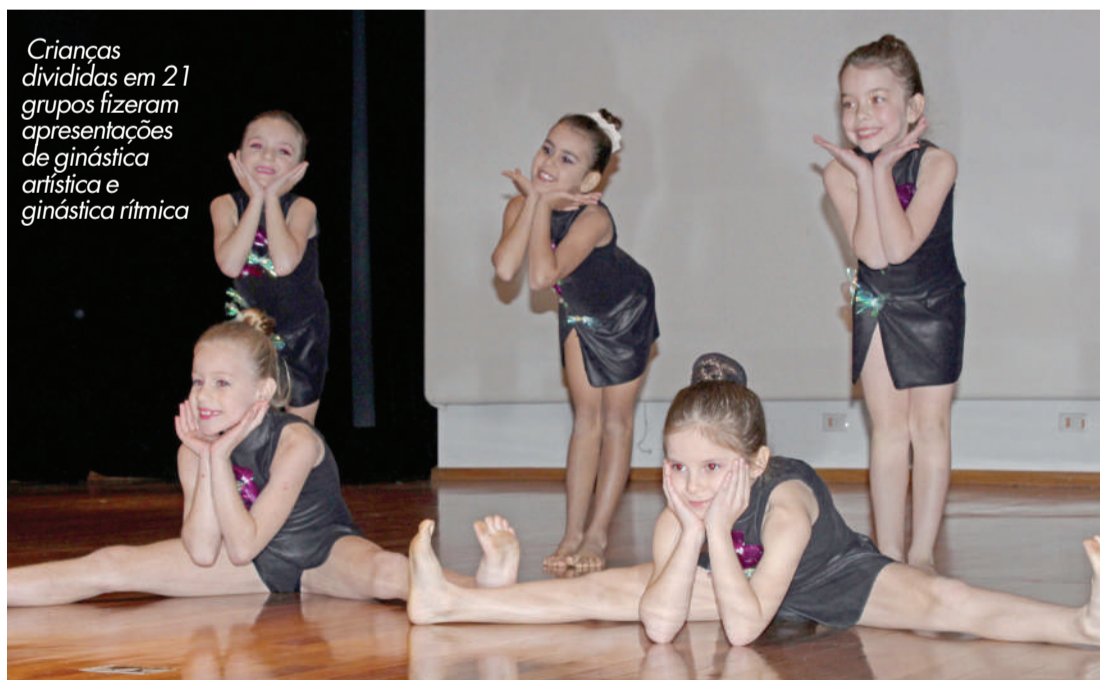
Crianças divididas em 21 grupos fizeram apresentações de ginástica artística e ginástica rítmica