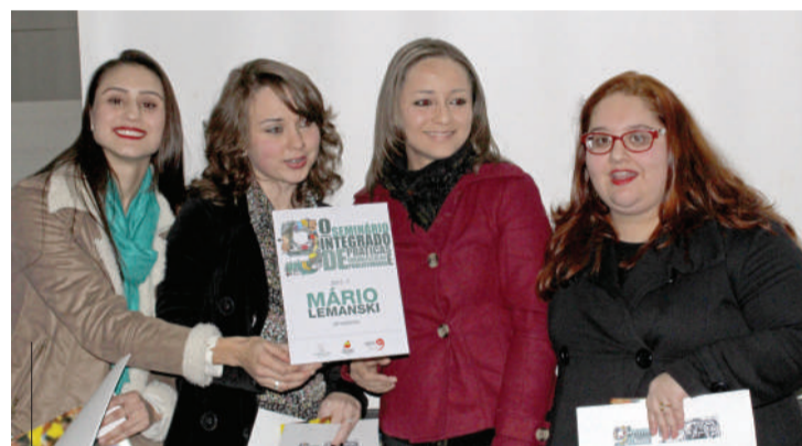
Com a Web reportagem "Biografia do cigarro", acadêmicas do 5º período de Jornalismo conquistaram o Mário Lemanski

O prêmio Galo de Ouro foi entregue aos alunos do 5º período, da Agência Estúdio Criativo, que desenvolveram o trabalho para o Hemocentro, na disciplina de Identidade Visual Corporativa. E o prêmio Mário Lemanski ficou com o grupo do 5º período de Jornalismo, com a Web reportagem "Biografia do cigarro", na categoria de Jornalismo Online.