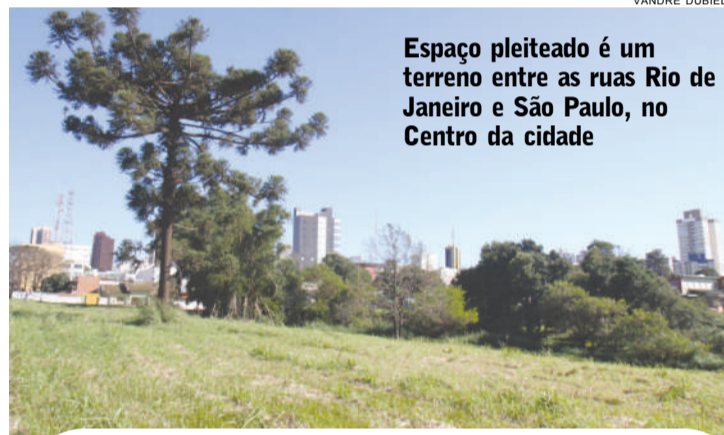
Espaço pleiteado é um terreno entre as ruas Rio de Janeiro e São Paulo, no Centro da cidade