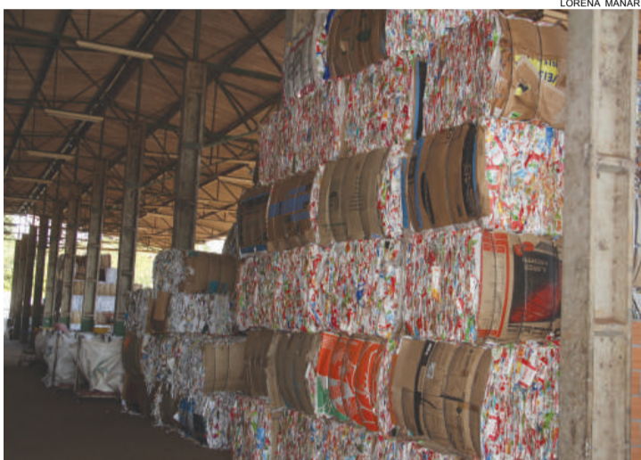
Com estoque lotado, programa arrecada quase 300 toneladas por mês