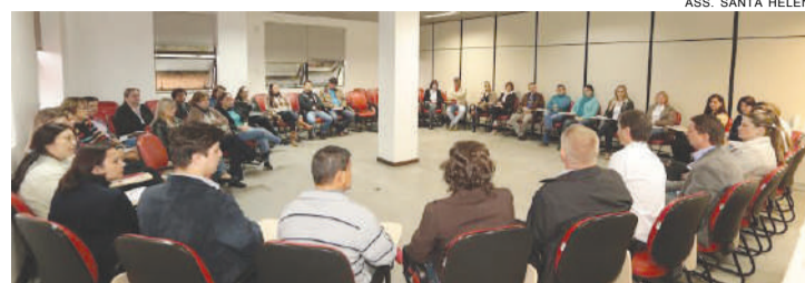
ASS. SANTA HELENA

gos dos Excepcionais, Apae, segundo o secretário.