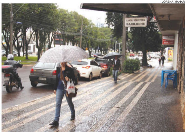
Média de chuva no Oeste é de 269,85 mm nos primeiros 14 dias de julho. Índice faz deste mês um dos mais chuvosos das últimas décadas