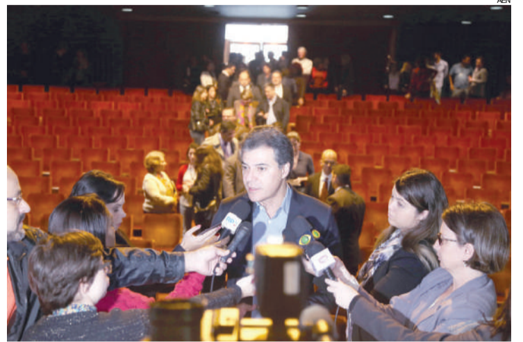
Richa: “Eu estou muito tranquilo, absolutamente despreocupado”

Beto disse ainda que não teme o resultado das investigações e tem “absoluta confiança na Justiça”. “Está aí toda a minha trajetória de vida, da minha vida pública, pautada de forma ilibada, reta e decente. Eu não tenho o que