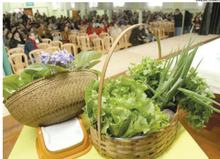
Cerca de 260 pessoas da região Oeste participaram da Conferência

Também ontem, os 168 delegados que representaram os municípios da região participaram da 2ª Conferência Regional de ATER (Assistência