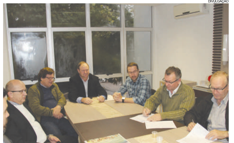
O contrato com a Emdur terá expressiva economia de recursos