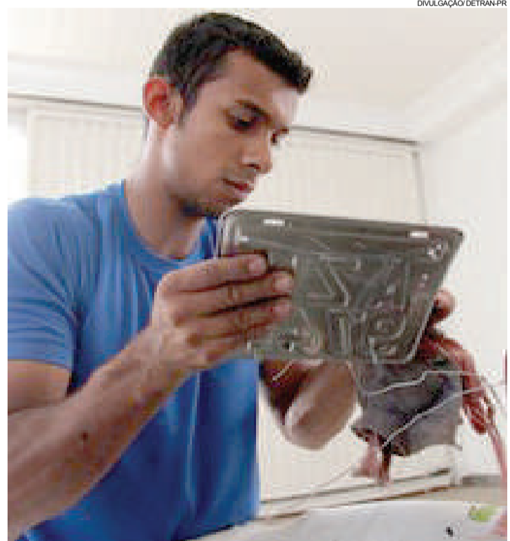
Queda foi mais significativa no interior do Estado

O principal setor atingido foi o de veículos pesados, como caminhões, com queda de