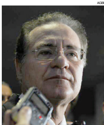
Renan também é réu em três inquéritos da Operação Lava Jato

A operação para busca e apreensão de bens e documentos foi feita contra o ex-presidente Fernando Collor (PTB-AL), o presidente do PP, Ciro Nogueira (PI) e o ex-ministro de Dilma, Fernando Bezerra (PSB-PE).