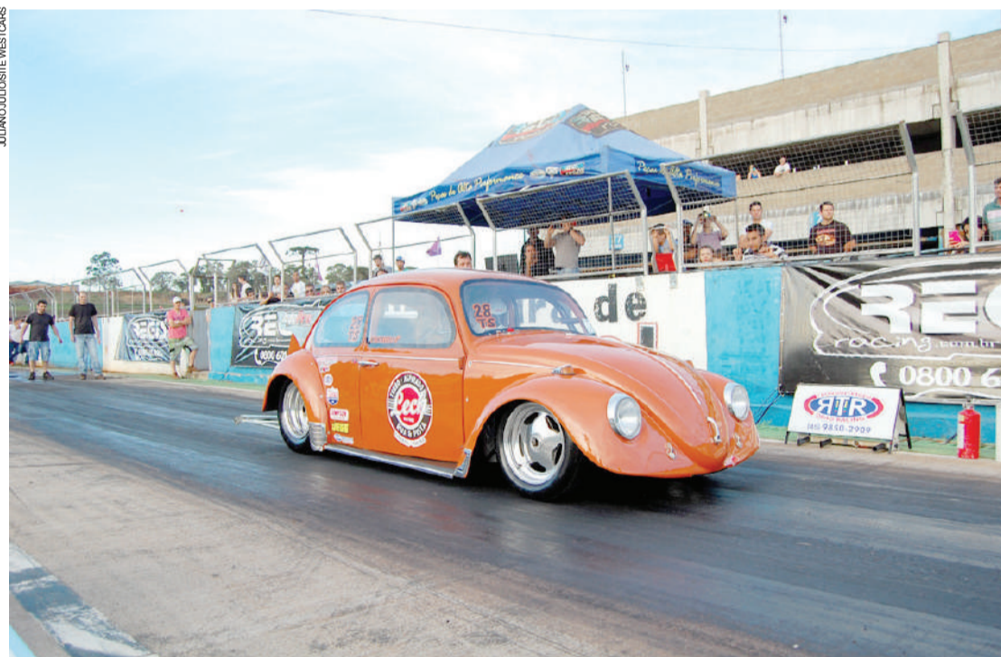
Alfredo Montecelli, da categoria Traseira Super, será um dos muitos cascaavelenses na competição

As emoções da arrancada estão de volta a Cascavel. Sábado e domingo será disputada a 3ª etapa do Campeonato Paranaense de Arrancada de 201 Metros, na pista de concreto do Autódromo Zilmar Beux, com promoção e orga-