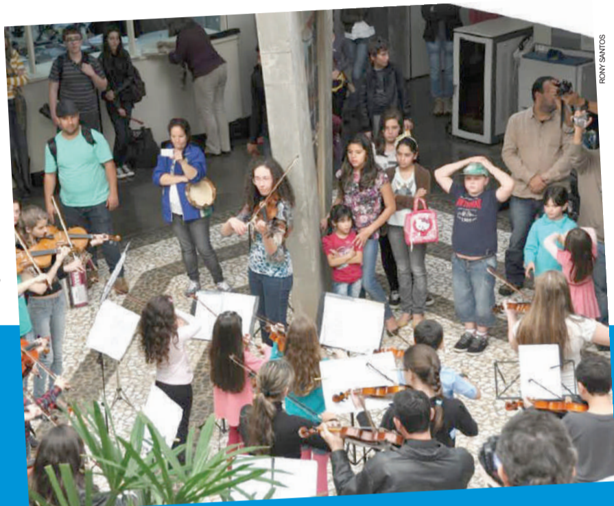
“Noite dos Alunos” já se tornou tradicional no Festival de Música de Cascavel

15h30 no Colégio Estadual Horácio. Ao todo, mais de 100 músicos participarão das intervenções musicais.