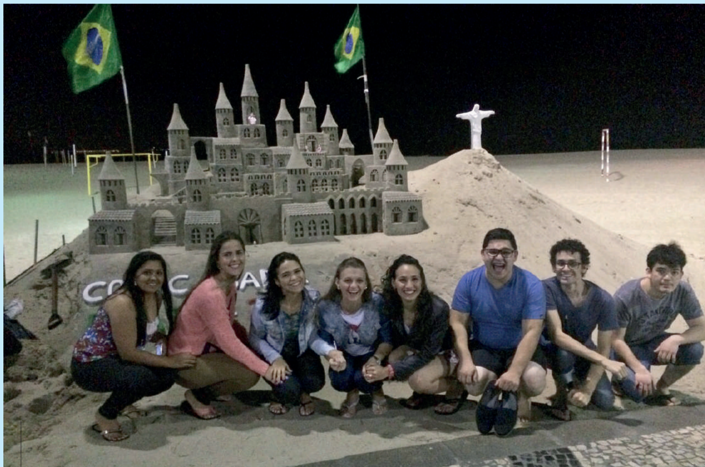
Viagem se estendeu à cidade do Rio de Janeiro, e o grupo pode conhecer vários pontos turísticos