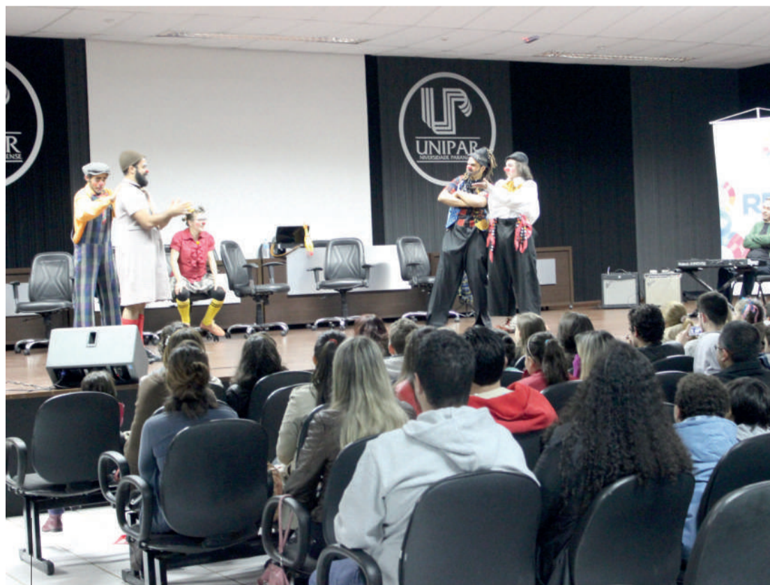
Pais e crianças curtiram programação

Cascavel - O tempo chuvoso e frio não foi obstáculo para que a comunidade de Cascavel fosse apreciar a apresentação cultural realizada na Universidade Paranaense – Unipar, na última semana. A Unipar teve a honra de receber a Companhia de Teatro dos Risologistas – Doutores do Riso, com Balelas Improvisadas, um show gratuito para toda a família. Quem se interessou pôde doar brinquedos, que serão distribuídos a uma entidade.