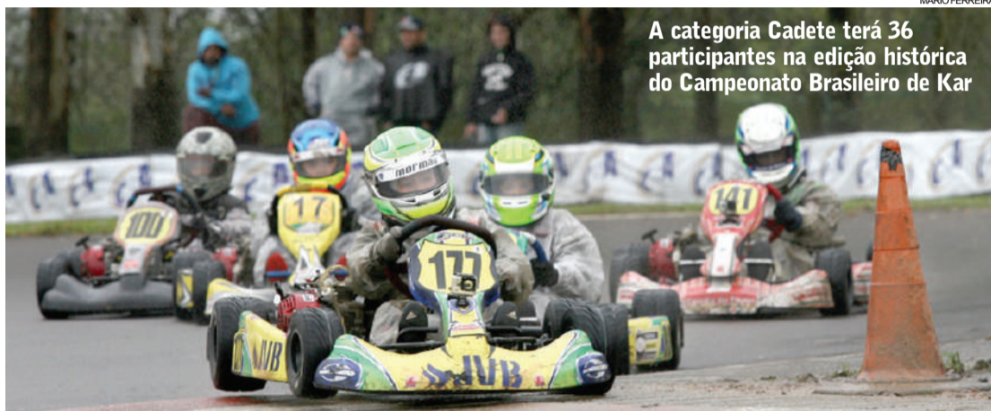
A categoria Cadete terá 36 participantes na edição histórica do Campeonato Brasileiro de Kart

O 50º Campeonato Brasileiro de Kart tem promoção da CNK (Comissão Nacional de Kart), órgão da CBA (Confederação Brasileira de Automobilismo), e apoio da FGA (Federação Gaúcha de Automobilismo) e Instituto Latino Americano de Desenvolvimento do Esporte a Motor.