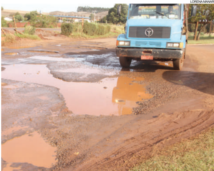
Para não cair nas crateras, motoristas desviam quando conseguem

Em relação ao Município, o orçamento não prevê verbas para tal finalidade e nem existe dinheiro disponível. Mas afirmou que em várias oportunidades o Município