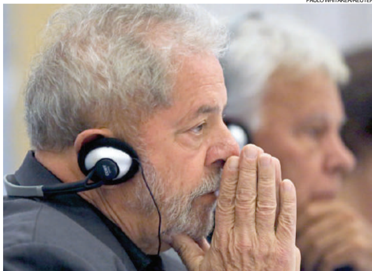
Ex-presidente Lula, suspeito de tráfico de influência internacional

Além de abrir o inquérito, o MPF do Distrito Federal solicitou o compartilhamento de provas da Lava Jato para incluir na investigação criminal envolvendo Lula.