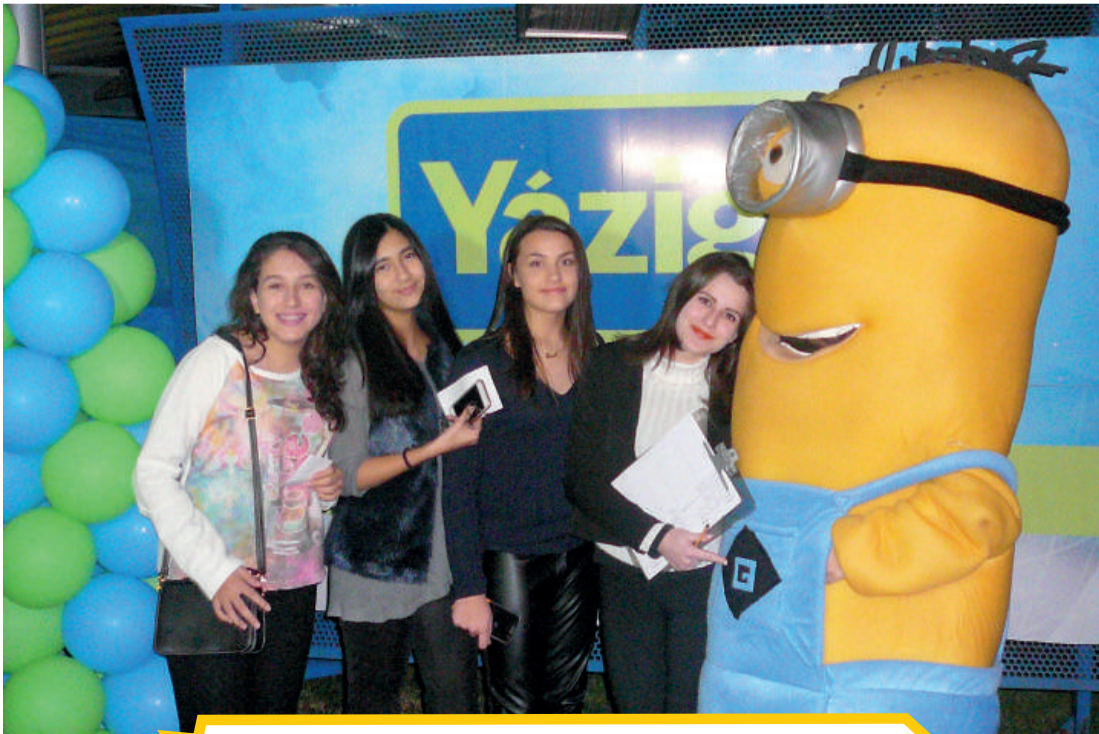
Alunas Yáziği no Dia do Amigo 2015