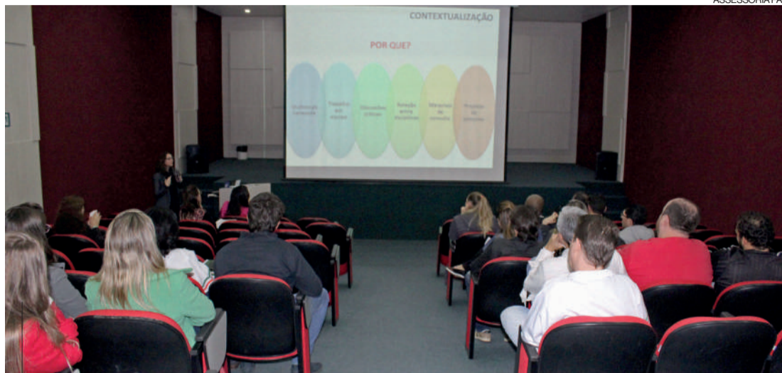
Na segunda noite, professores de diversos cursos relataram suas experiências em sala de aula