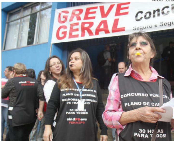
Servidores realizaram apitação ontem, em frente à agência

O membro sindical ainda alerta que a informação que o INSS repassa por meio do serviço telefônico 135 aos segurados, de que a agência está aberta, é inverídica. “Orientadas, as pessoas buscam o atendimento, mas acabam