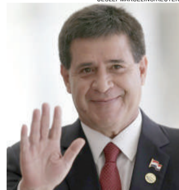
Horacio Cartes, presidente do Paraguai, durante a cúpula do Mercosul

Coletamos suas encomendas em São Paulo e entregamos em Toledo, Cascavel e região.