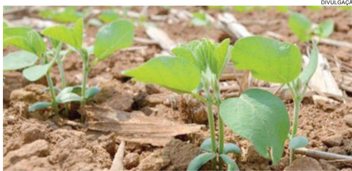
Propriedades onde for encontrada soja viva durante o vazio sanitário correm o risco de serem multadas