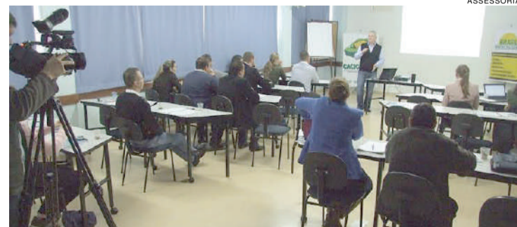
O segundo módulo da capacitação foi realizado ontem, na Acic, em Cascavel; programa segue hoje na Acit em Toledo