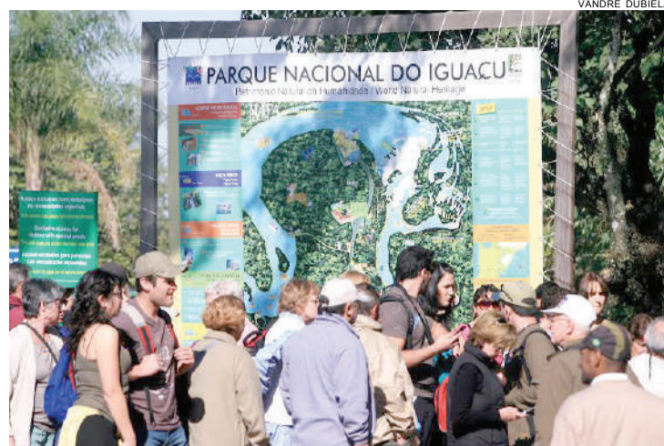
Turistas optaram por privilegiar pontos turísticos brasileiros como as Cataratas devido à alta do dólar

Em Foz do Iguazu, a rede hoteleira deve registrar 61% de ocupação nas férias de julho, segundo levantamento feito pelo Sindhotéis (Sindicato de Hotéis, Restaurantes, Bares e Similares). O estudo considera as reservas feitas entre os dias 10 a 25 deste mês. Entre as nacionalidades de hóspedes, predominam os brasileiros, que correspondem a 85% das ocupações. A pesquisa foi realizada com base no movimento projetado em 28 estabelecimentos. Foz possui 176 meios de hospedagem e 27,5 mil leitos, conforme a versão 2014 do inventário da Secretaria Municipal de Turismo. (RG)