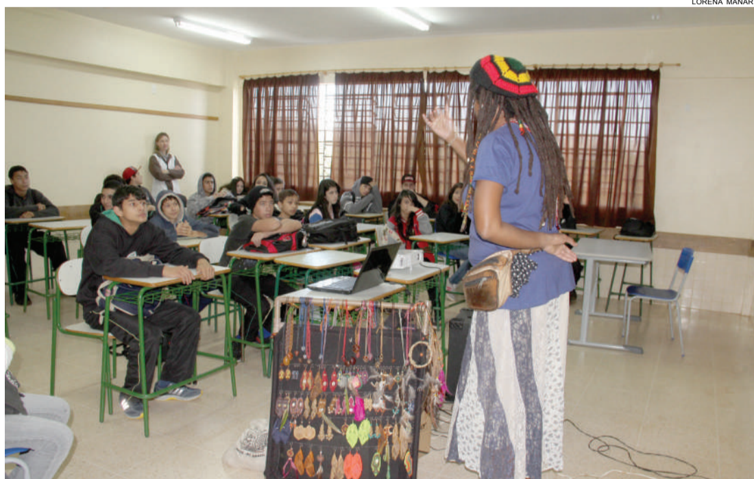
Alunos participaram de oficinas de conscientização ontem em Cascavel