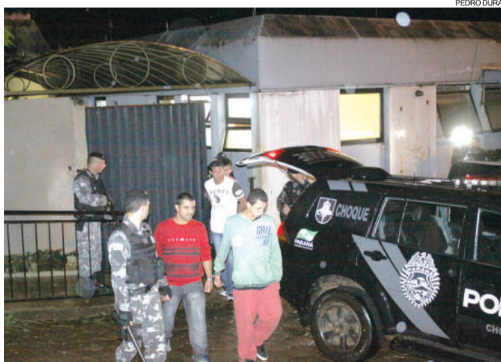
Presos que estavam no parlatório tentaram uma fuga em massa