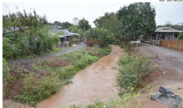
Rios em São Miguel: dragagens aprofundam canais e reduzem riscos