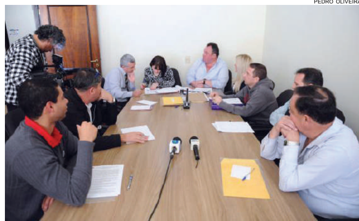
A licitação, em forma de pregão presencial, foi realizada na manhã de ontem

A LBSX Comércio de Produtos Alimentícios Ltda. tem agora 48 horas para apresentar as amostras dos produtos apresentados na licitação ao Departamento de Apoio Técnico da Assembleia e concluir o processo licitatório. Caso as amostras não sejam aprovadas, a licitação será reaberta.