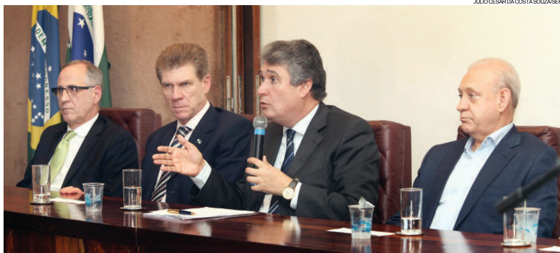
O Governo do Paraná lançou, ontem, o Programa Especial de Parcelamento

O objetivo é estimular o pagamento de débitos decorrentes de fatos geradores ocorridos até 31 de dezembro de 2014. Além de favorecer o contribuinte, a medida vai permitir o incremento nas receitas do Paraná em um momento de redução da atividade econômica no país, possibilitando que o Estado possa prestar serviços de melhor qualidade. “É uma oportunidade única de os contribuintes regularizarem suas pendências”,