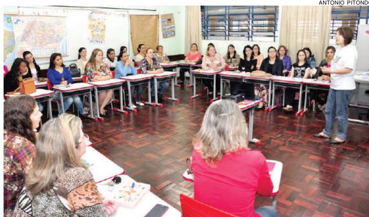
Atualização é necessária em um mundo em constante mudança

cognitivo, psicomotor e afetividade; no 2º e 3º ano o tema é língua portuguesa, com ênfase na fonética, leitura e produção textual; no 4º e 5º ano a abordagem é matemática: contextualizada e fração.