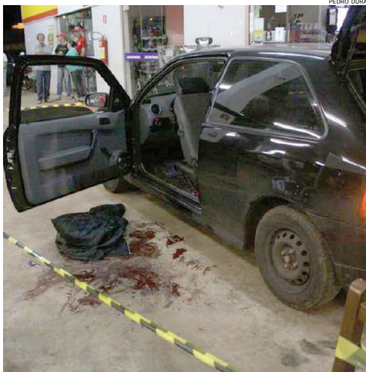
Ferido, jovem pediu ajuda em um posto de combustíveis