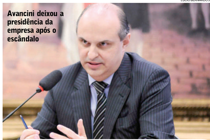
Avancini deixou a presidência da empresa após o escândalo

irmão do ex-ministro das Cidades do Governo Dilma Mário Negromonte - da imputação do crime de pertinência à organização criminosa e de lavagem de dinheiro.