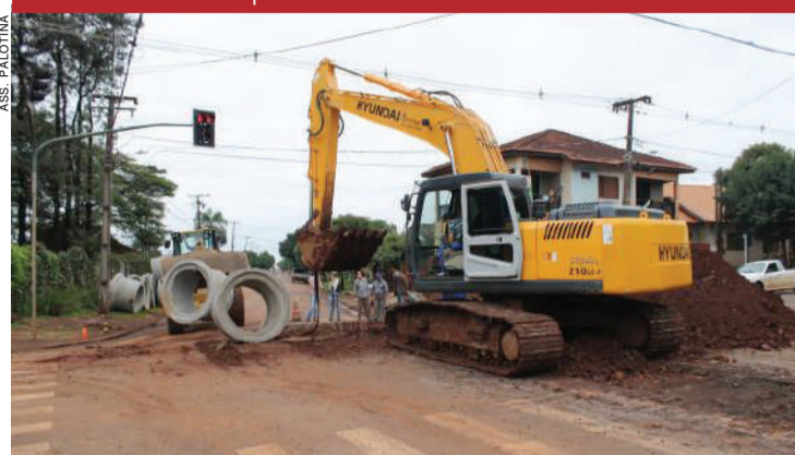
Prefeitura de Palotina amplia a rede de galerias pluviais na rua Pioneiro esquina com a 1ª de janeiro. São instaladas 118 metros de rede, com tubulações de concreto. O investimento, segundo o prefeito Jucenir Stentzler, é de R$ 122 mil.