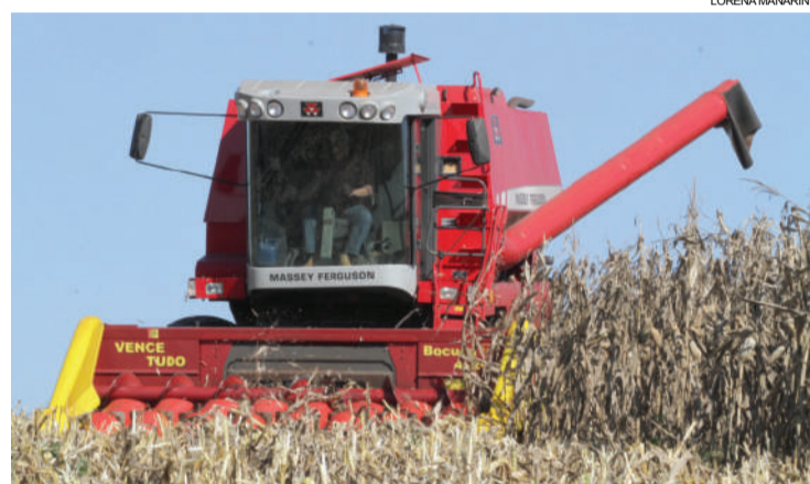
Com a volta do sol, produtores intensificam a colheita de milho