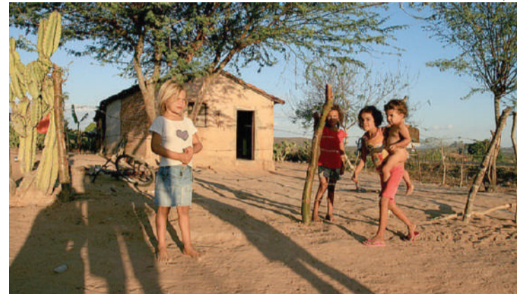
O sertão nordestino é um dos locais com maior concentração de pobreza extrema no Brasil