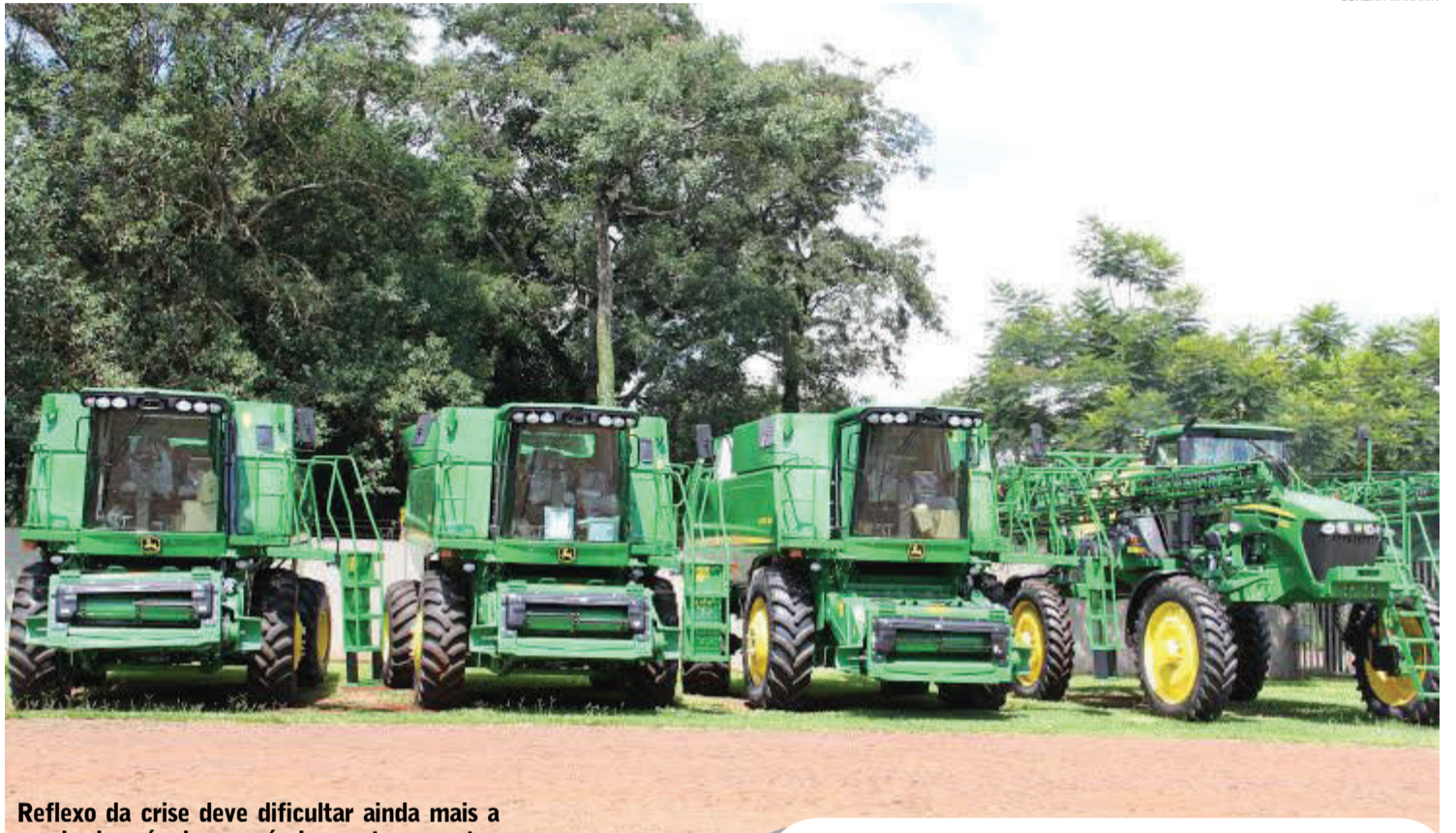
Reflexo da crise deve dificultar ainda mais a venda de máquinas agrícolas neste semestre

Segundo o gerente, a procura por colheitadeiras, que deveria ser intensificada a partir deste mês, tem ficado muito abaixo das expectativas. "As vendas normalmente começam a melhorar em julho e seguem ao longo do ano. No entanto, estamos muito longe do ritmo esperado. Com a economia ruim, aumento de juros e custos nos insumos da agricultura, o produtor não tem investido na compra de colheitadeiras e nem