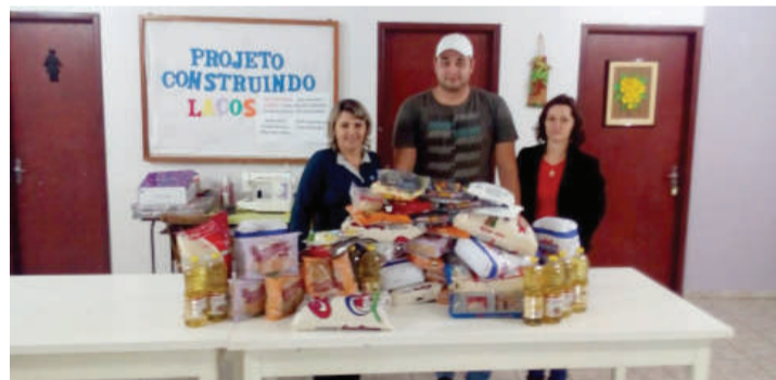
Grupo doou cerca de 130 kg de alimentos que serão entregues a famílias carentes

130 kg de alimentos doados pelo grupo da Deutsches Net Stressiat. A arrecadação foi