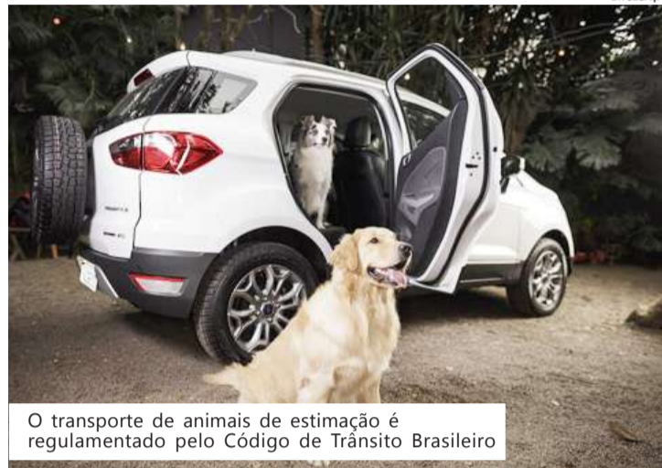
O transporte de animais de estimação é regulamentado pelo Código de Trânsito Brasileiro

"É comum ver pessoas levando cães no colo ou mesmo soltos dentro do carro. A forma mais indicada é usar uma coleira peitoral e prendê-la no cinto de segurança, ou levá-los em uma caixa de