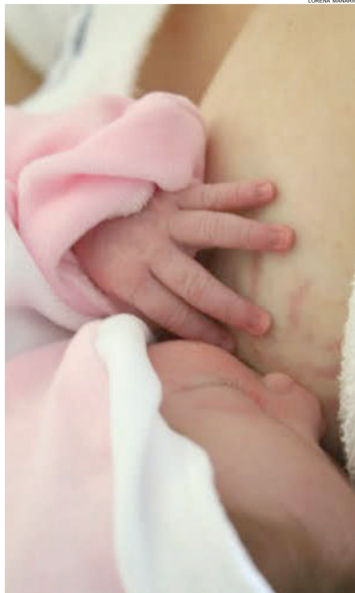
Licença maternidade é um direito de mães para garantir a amamentação

ça dos motoristas, a concessionária instalou dispositivos orientando sobre o desvio, além de placas indicando a redução de velocidade neste segmento (30km/h) e dos itens de sinalização noturna. A previsão da concessionária é de que o desvio seja mantido por aproximadamente 60 dias.