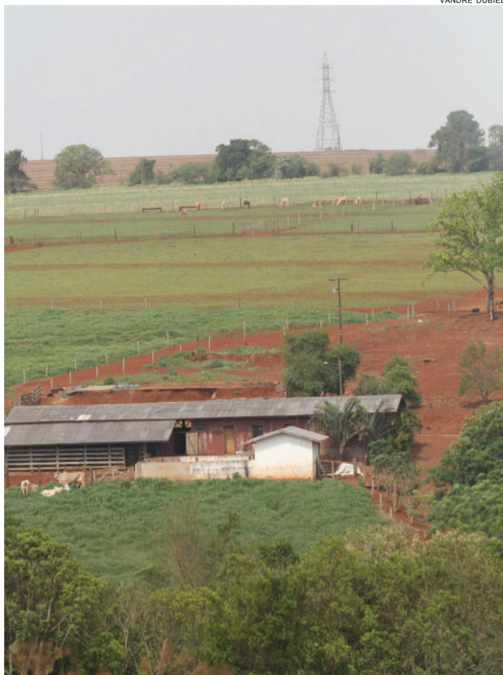
Oeste é a região paranaense com maior número de imóveis rurais cadastrados. Prazo expira no dia 5 de maio do ano que vem