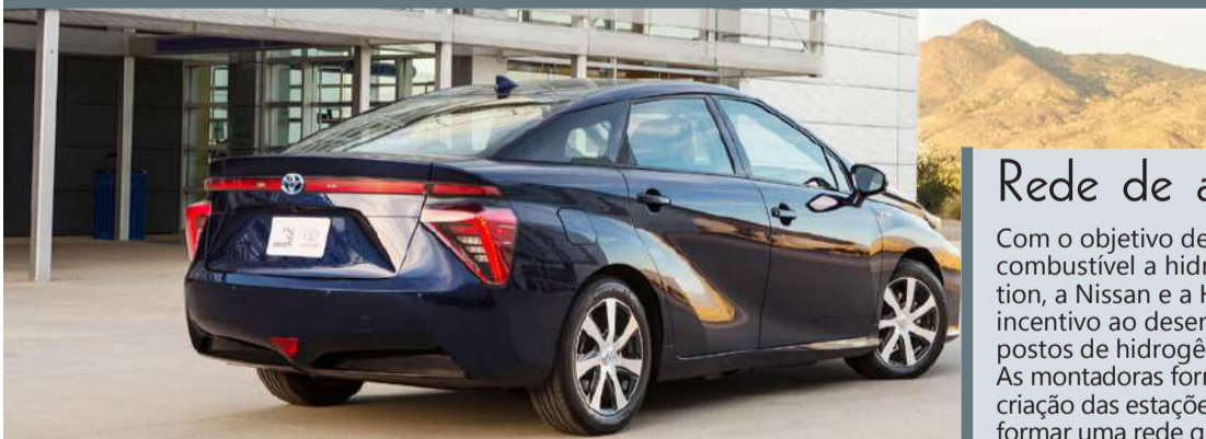
O Toyota Mirai movido a hidrogênio percorre 502 km liberando apenas vapor d'água na atmosfera

O futuro da mobilidade está pronto para pegar a estrada e percorrer longos trajetos. O Toyota Mirai, veículo movido a hidrogênio, quebra recorde de distância e prova ter autonomia para atravessar mais de 500 km, com zero emissão de gases poluentes, liberando na atmosfera nada mais do que água em forma de vapor.