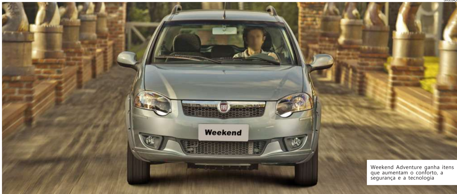
Weekend Adventure ganha itens que aumentam o conforto, a segurança e a tecnologia