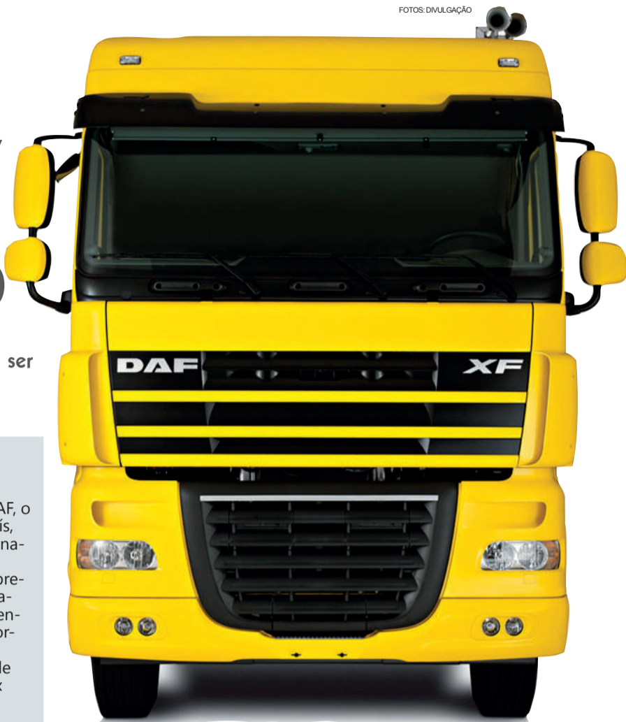
O DAF XF105 é um caminhão extrapesado que terá agora a opção da versão com motor de 12,9 litros, com potência de 510 cv

A opção de motorização está disponível para as versões 6x2 e 6x4, cabine Space e, futuramente, na Super Space Cab, com 2,10 metros de altura interna – uma das maiores do mercado.