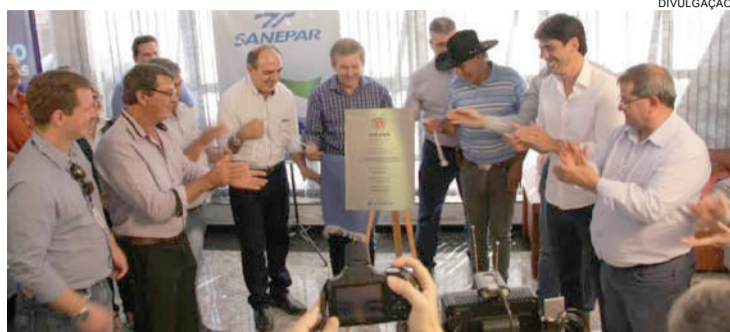
Autoridades durante uma das inaugurações na região Oeste do Paraná: parceria que beneficia moradores com água de qualidade

Em Assis, a Sanepar fez a entrega oficial das obras de ampliação do sistema de abastecimento de água, com investimentos da ordem de R$ 5 milhões. Em Jesuítas, foi inaugurado o sistema de abastecimento de água da Linha Estrada Medianeira, cujo inves-