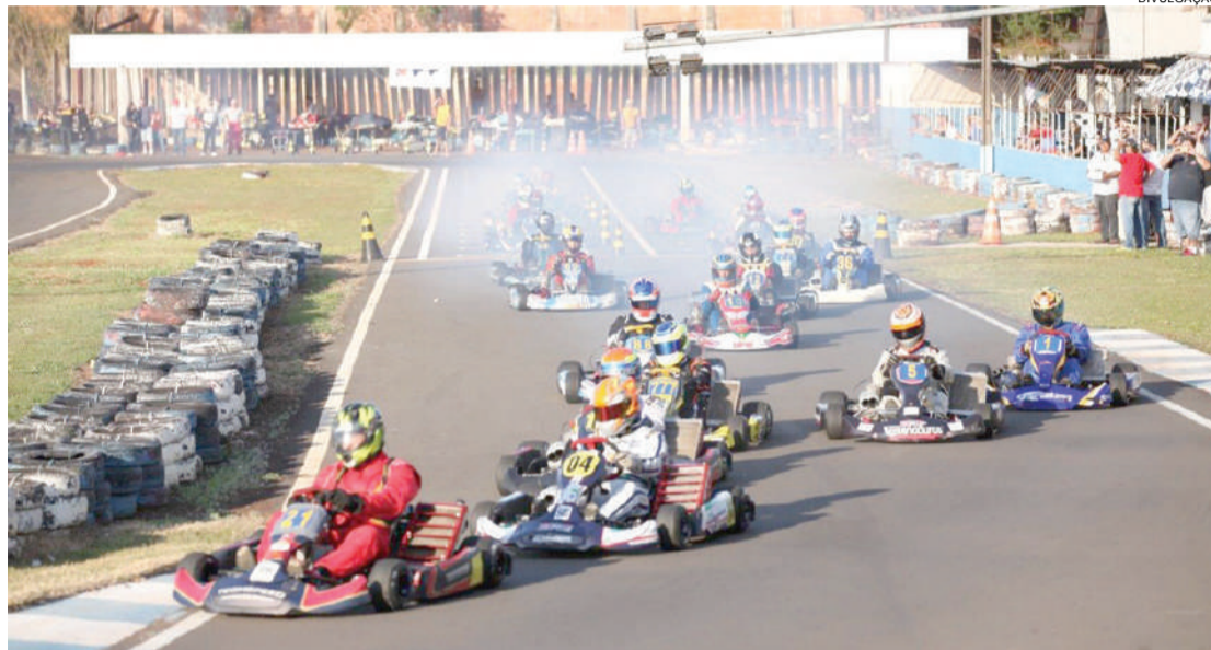
O Kartódromo Luigi Borghesi será o palco do Paranaense Light de Kart