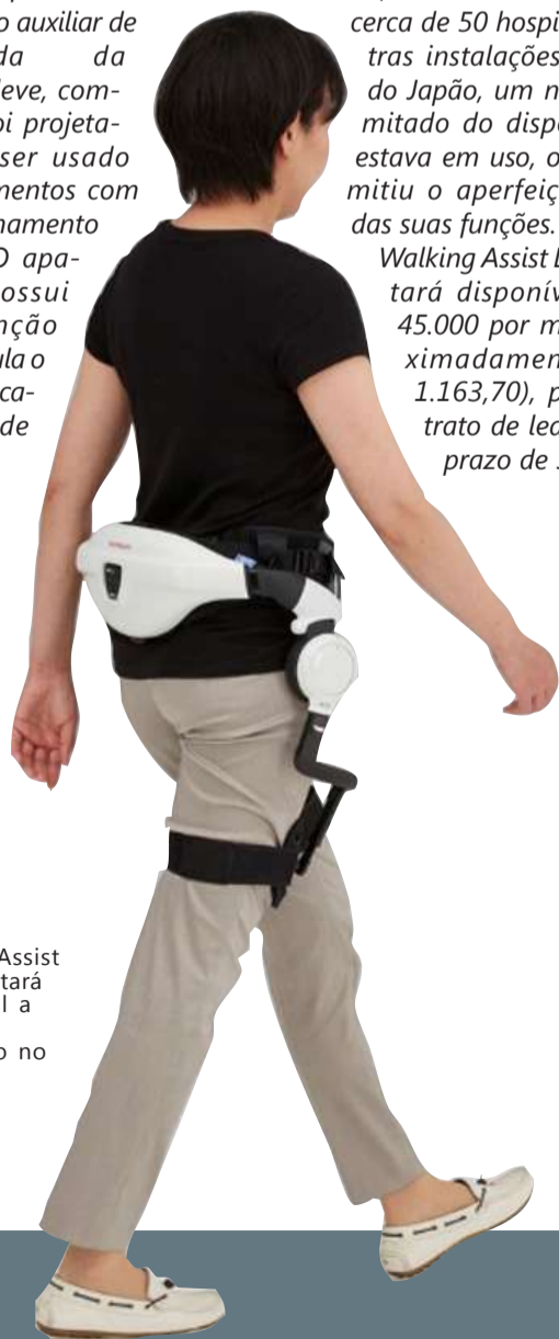
O Honda Walking Assist Device estará disponível a partir de novembro no Japão

O aparelho vem sendo pesquisado desde 1999, quando a Honda também investigava a teoria de caminhada humana para o desenvolvimento do ASIMO, avançado robô humanoide da marca. Desde 2013, com a colaboração de cerca de 50 hospitais e outras instalações médicas do Japão, um número limitado do dispositivo já estava em uso, o que permitiu o aperfeiçoamento das suas funções. O Honda Walking Assist Device estará disponível por ¥ 45.000 por mês (aproximadamente R$ 1.163,70), para contrato de leasing pelo prazo de 36 meses.