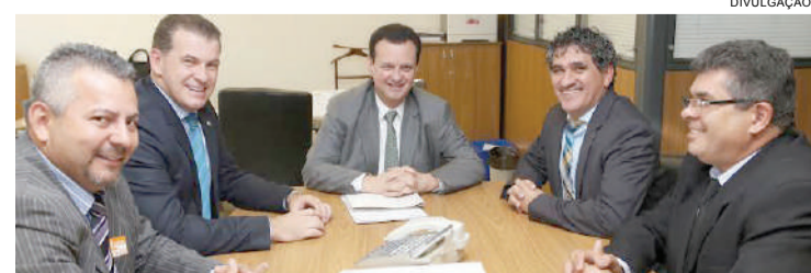
Líderes de Tupãssi com o ministro das Cidades e o deputado Roman

gado ao ministro uma reivindicação para melhorias na área urbana do município, especialmente para construção de calçadas, entre outras vias públicas, na ordem de R$ 600 mil.