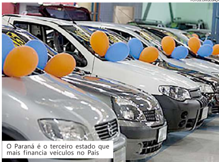
O Paraná é o terceiro estado que mais financia veículos no País

Com um total de 539.781 financiamentos no primeiro semestre do ano, a região Sul manteve-se como a segunda que mais financia veículos no País. Ao todo, foram 462.008 autos leves vendidos a crédito, 49.820 motos e 25.803 pesados.