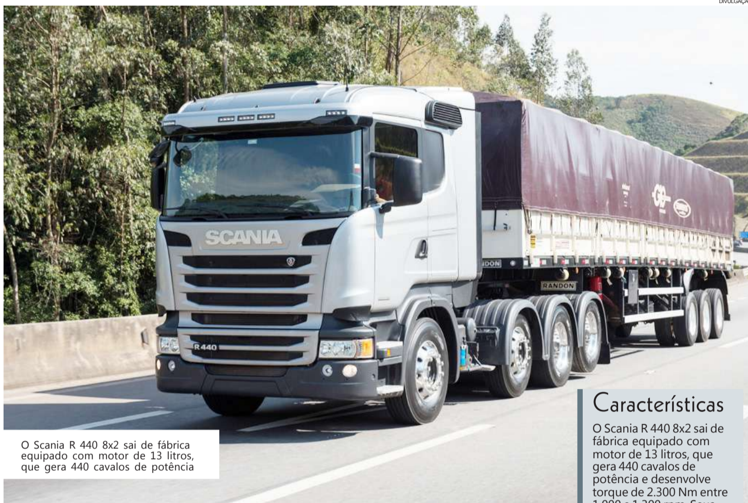
O Scania R 440 8x2 sai de fábrica equipado com motor de 13 litros, que gera 440 cavalos de potência

De olho na redução de custos, o Grupo G 10, transportador rodoviário de Maringá (PR), adaptou um cavalo mecânico 6x2 para transformá-lo em 8x2, e trafegar com carretas de três eixos. A empresa fez a adaptação em oficinas independentes, e a alternativa foi copiada por outras transportadoras. A configuração 8x2 rodoviária permite o aumento de capacidade de carga em comparação à 6x2 com "vanderleia" e menor custo operacional em relação a