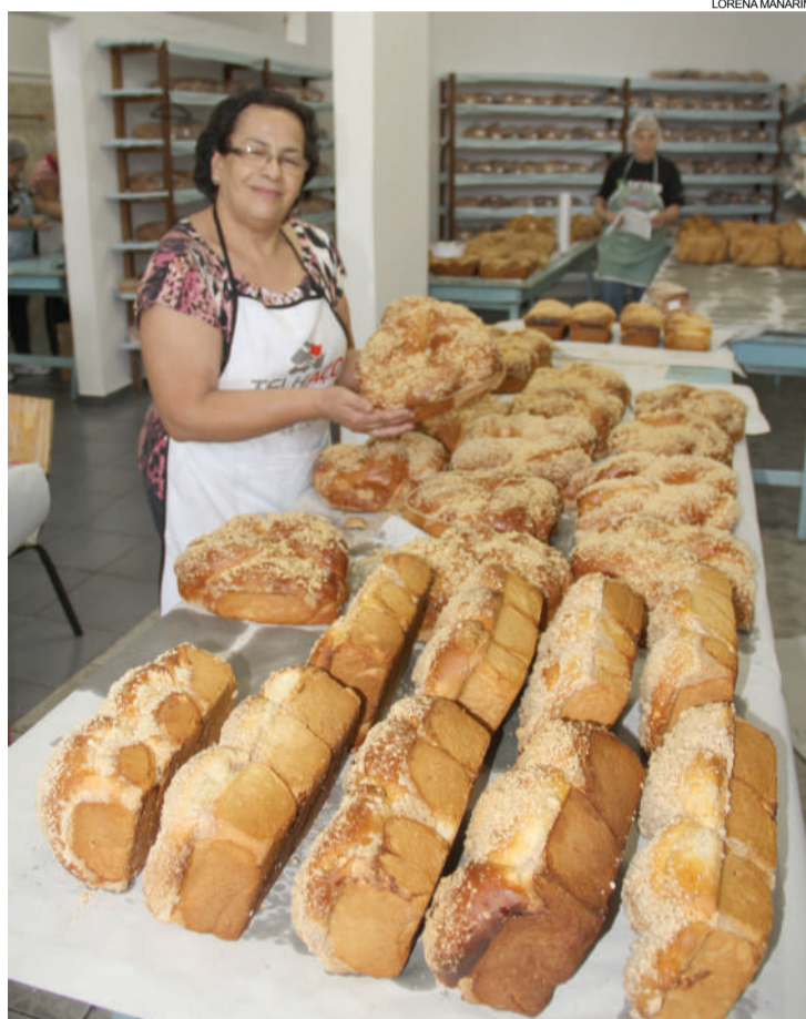
Mais de 700 pães e cucas serão vendidos nos três dias de festa

Hoje, às 16h, um passeio de motociclistas sairá do Lago Municipal em direção à Paró-