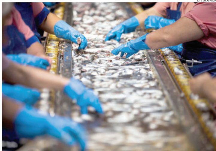
Em junho contra maio deste ano, a indústria do Paraná cresceu 0,8% e fechou o terceiro mês seguido de alta

até junho. Em 12 meses, o recuo na produção desse setor é de 27,6%.