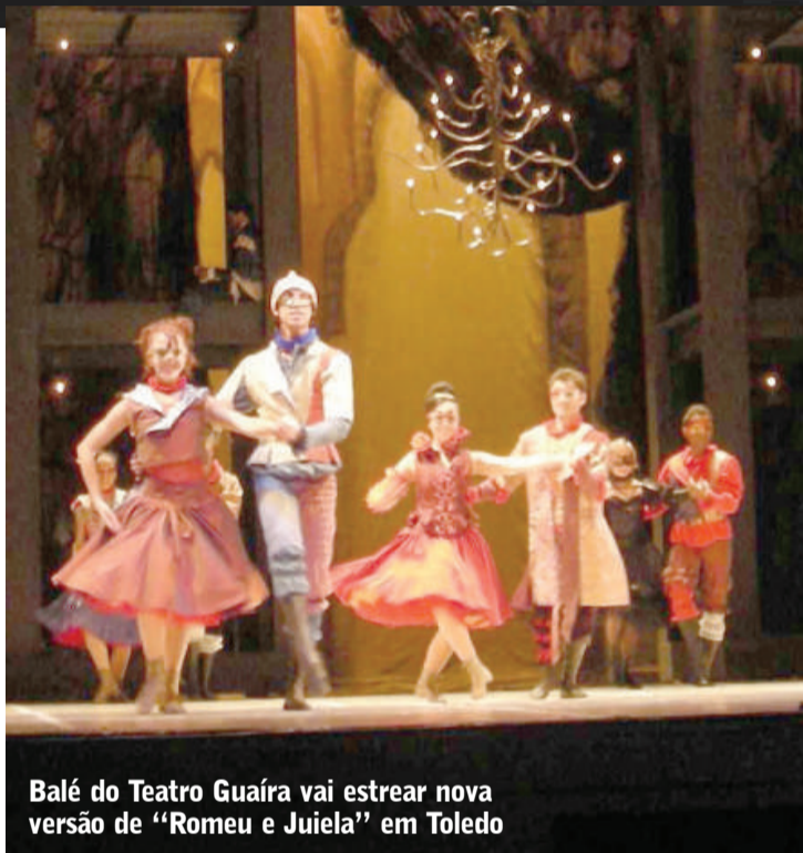
Balé do Teatro Guaíra vai estrear nova versão de “Romeu e Julieta” em Toledo