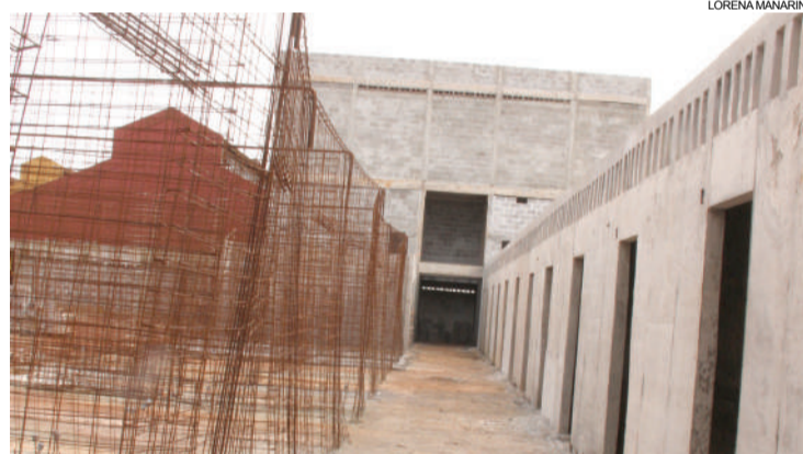
Estado garantiu os recursos para terminar a obra na PIC, no valor