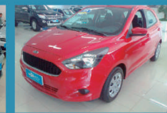
FORD KA 1.5 SE 2015 - SLAVIERO TOLEDO R$ 42.900,00