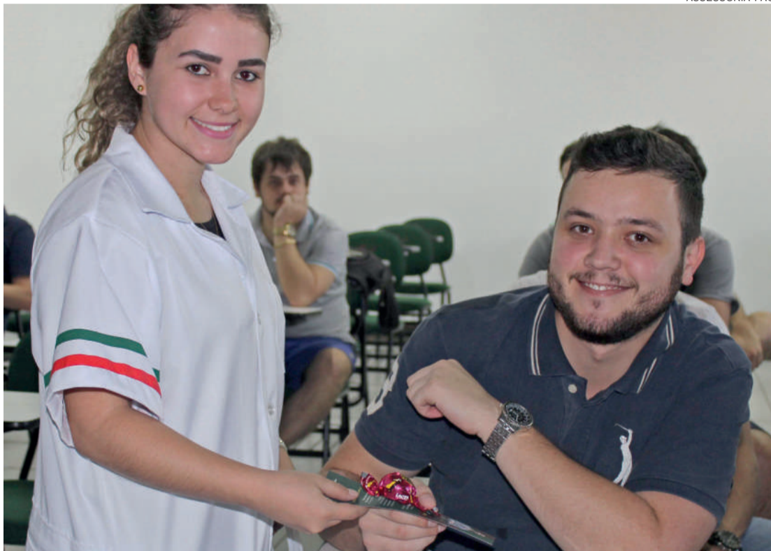
Todos os acadêmicos da FAG e Dom Bosco receberam um bombom e um marca páginas