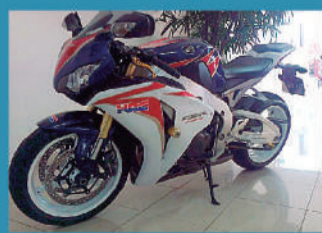
HONDA CBR 1000 RR - HRC 2011 - SLAVIERO TOLEDO R$ 46.900,00