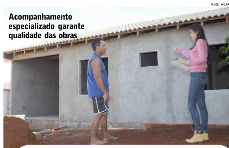
Acompanhamento especializado garante qualidade das obras

ro. Segundo ele, o dinheiro que utilizaria na elaboração do projeto, está destinando para a compra de materiais. "Recomendo a todos os meus amigos e muitos já procuraram a Aeac em busca de mais informações", destacou ele, que é casado e tem um filho.