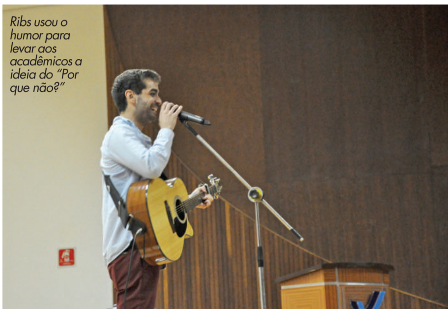
Ribs usou o humor para levar aos acadêmicos a ideia do "Por que não?"