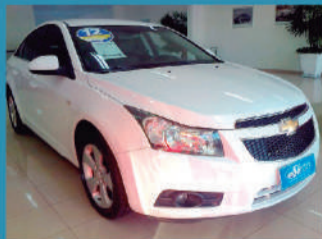
CHEVROLET CRUZE SEDAN LT 1.8 16V 4P - 2012 R$ 53.900,00

PREÇO JUSTO GARANTIA PROCEDÊNCIA TAXAS ESPECIAIS