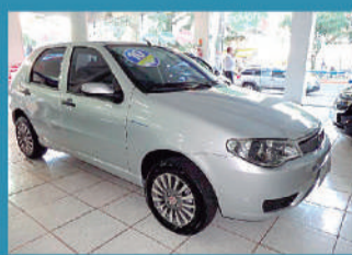
FIAT PALIO FIRE CELEBRATION 1.0MPI 8V 4P - 2009 / 2010 R$ 22.900,00