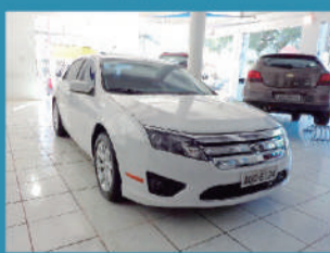
FORD FUSION SEL 3.0 V6 AWD 243CV AUTOMÁTICO 2012 - R$ 69.900,00