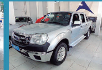
FORD RANGER XLT (C.DUP) 4X4 3.0 TB-ELETR. 4P - 2010 / 11 R$ 62.900,00