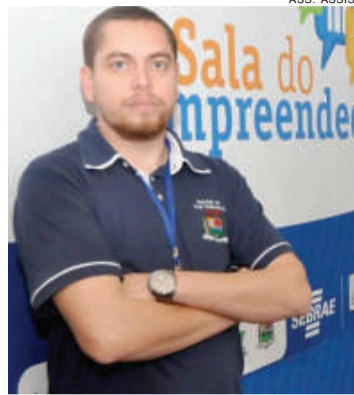
Marcelo: planejamento de políticas públicas

Assis - A Sala do Empreendedor de Assis Chateaubriand recebeu nova plotagem (adesivagem), gentileza do Sebrae. O objetivo dessa