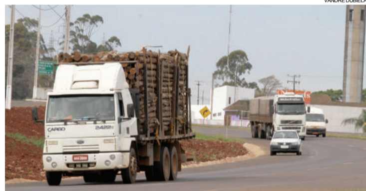
Pelo menos 18 motoristas são flagrados diariamente dirigindo acima da velocidade permitida