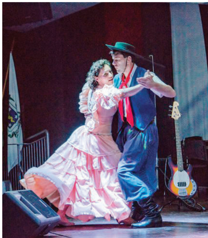
Apresentação de dança exalta a tradição gaúcha