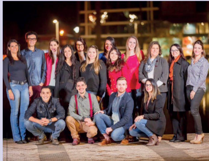
Alunos de Design de Interiores, da Faculdade Dom Bosco, projetaram o ambiente "Circulação" da Casa Toledo 2015

A Aeat (Associação dos Engenheiros e Arquitetos de Toledo) realiza, de 27 de agosto a 27 de setembro, a quarta edição da Casa Toledo. O evento congrega os melhores profissionais de Toledo e região para criar ambientes de luxo e bom gosto, expondo as tendências da arquitetura e decoração.