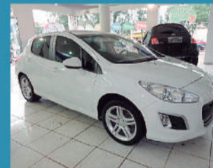
PEUGEOT 308 - 2012 / 2013 HATCH ALLURE 1.6 16V 4P R$ 44.900,00