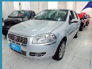
FIAT SIENA EL (N.SERIE) (CELEBRATION) 1.0 8V 4P - 2010 R$ 25.900,00