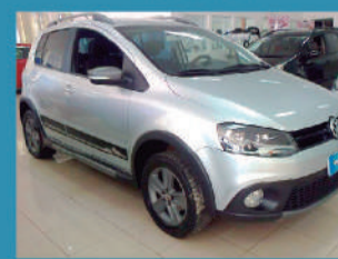
VOLKSWAGEN CROSSFOX 1.6 8V 4P 2011 - SLAVIERO TOLEDO R$ 40.900,00