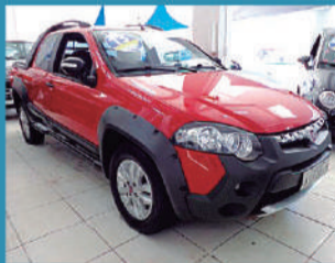
FIAT STRADA ADVENTURE (C.DUPL) 1.8 8V 2P - 2013 R$ 45.900,00