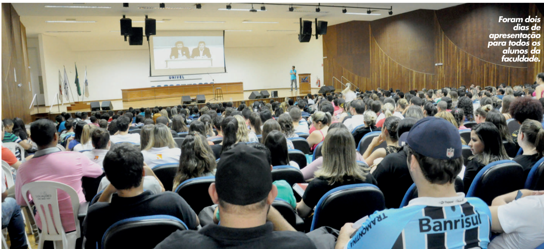
Foram dois dias de apresentação para todos os alunos da faculdade.