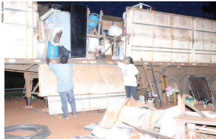
Parte das famílias desmanchou os barracos e carregou seus pertences ainda ontem, mesmo no escuro