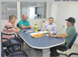
ASS. VERA CRUZ