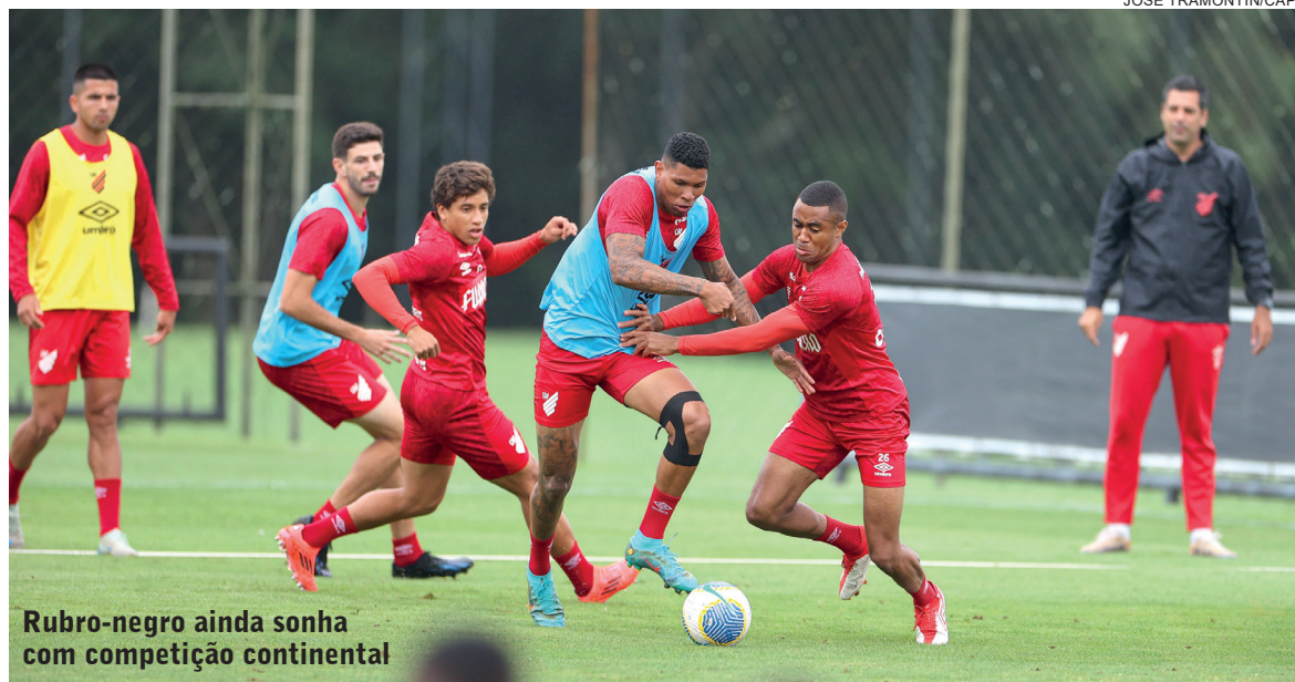
Rubro-negro ainda sonha com competição continental

O Braga ainda não venceu o Athletico-PR como visitante desde que passou a ser gerido pela Red Bull, em 2019. De lá pra cá, foram cinco partidas no Paraná, sendo três empates e duas derrotas. Caso seja derrotado hoje e o Fluminense some ponto contra o Cuiabá, o time paulista estará rebaixado.