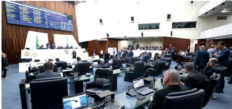
Projeto que promove mudanças fiscais tramita em regime de urgência na Alep