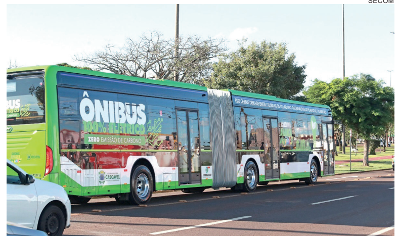
Alguns ônibus já rodaram mais de 15 mil quilômetros durante os quatro meses de uso

Na especificação dos serviços estão indicadas as manutenções para os 15 veículos de cinco até 70 quilômetros rodados. Para se ter uma ideia, a