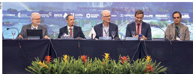
A Reunião Ordinária do Comitê Nacional de Secretários de Fazenda foi realizada em Foz do Iguaçu

“O objetivo central é resguardar os empregos e a renda dos brasileiros, que enfrentam os desafios de um mercado global cada vez mais integrado,