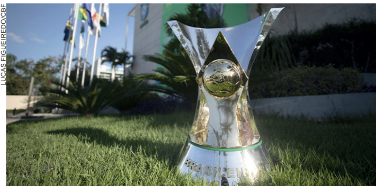
CBF terá logística especial para entrega da taça para Botafogo ou Palmeiras

Os encadeamentos de resultados devem levar em conta além dos pontos, os desempates por número de vitórias e saldo de gols.