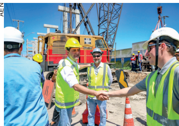
A construção da estrutura, que recebe R$ 592 milhões de investimento, foi vistoriada nesta sexta-feira

O novo complexo será formado por moegas ferroviárias, sistema de transporte vertical (elevadores de canecas), sistema de transporte horizontal (correias transportadoras), sistema de transferência de produto (torres de transferência), sistema de alimentação dos terminais (torres de alimentação), balanças (ferroviárias e integradoras), utilidades, prédio administrativo e prédio de