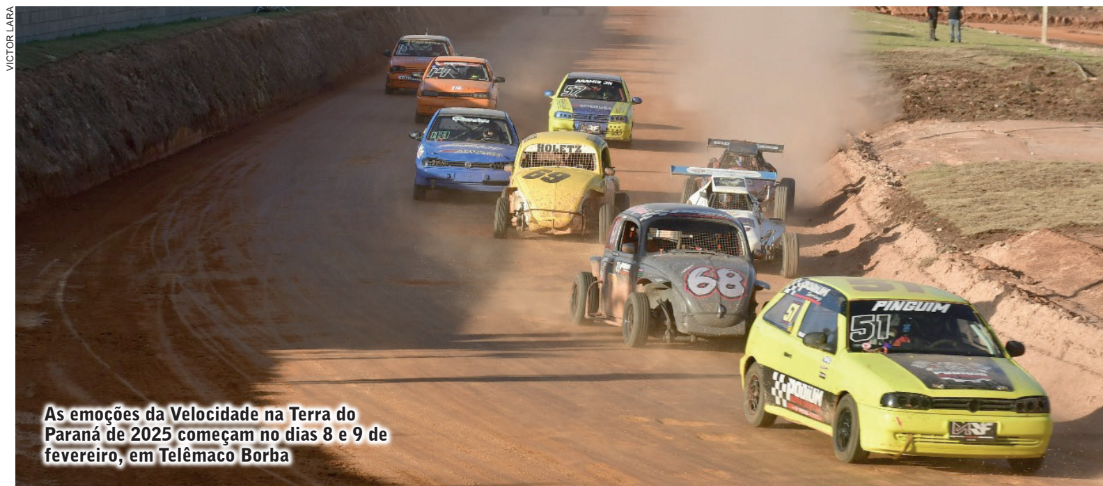
As emoções da Velocidade na Terra do Paraná de 2025 começam no dias 8 e 9 de fevereiro, em Telêmaco Borba

Fica para os dias 8 e 9 de fevereiro a decisão do Campeonato Paranaense de Velocidade na Terra de 2024. Em função de chuvas, a prova não pode ser realizadas em duas oportunidades em dezembro. A prova está mantida para o Autódromo Municipal de Telêmaco Borba e valerá também pela etapa de abertura do campeonato de 2025.