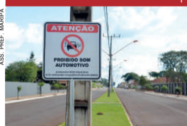
ASS. PREF. MARIPÁ

Maripá instala placas que proíbem o som automotivo. Elas foram implantadas atendendo a pedido do Conselho Municipal de Segurança Pública. Conforme a Lei Complementar 49 de 2013, do Plano Diretor sobre o Código de Postura, é proibido perturbar o sossego público com ruídos ou sons excessivos evitáveis. É dever de todos garantir o bem-estar e tranquilidade da comunidade, evitando o abuso de volume sonoro.