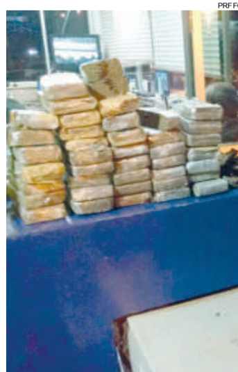
A droga estava escondida em fundos falsos e nas caixas de ar

O motorista, de 34 anos, e o passageiro, de 27, foram presos em flagrante por tráfico de drogas e recepção de veículo roubado. O primeiro já havia sido preso em outra ocasião pela PRF, em meados de 2012, em Laranjeiras do Sul, fazendo a função de batador para um veículo carregado com drogas.