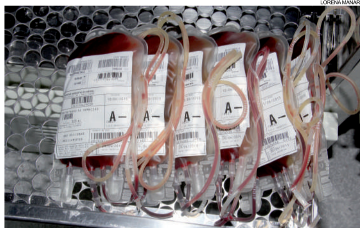
Estoque de sangue A- está abaixo da média

O Hemocentro atende atualmente 22 unidades hospitalares. Em Cascavel são: Ceonc, Uopeccan, Hospital Universitário, Hospital Nossa