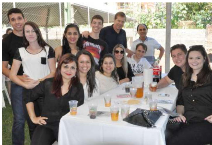
Colaboradores da pós-graduação participaram em peso