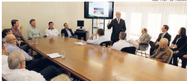
Reunião de líderes: investimentos começam ainda em maio

O prefeito diz que agora que o PCN do aeroporto foi reclassificado para 33 a meta é antecipar o futuro e, dentro desse contexto, viabilizar uma parceria público-privada para garantir obras estruturais necessárias no aeroporto. O projeto contempla a adequa-