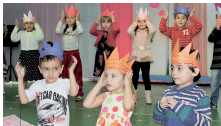
Alunos da Ed. Infantil Nível V prestaram homenagem com a trilha "Mamãe, mamãe"