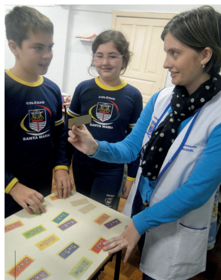
Para cada carta sorteada alunos tinham um tempo determinado para responder a operação