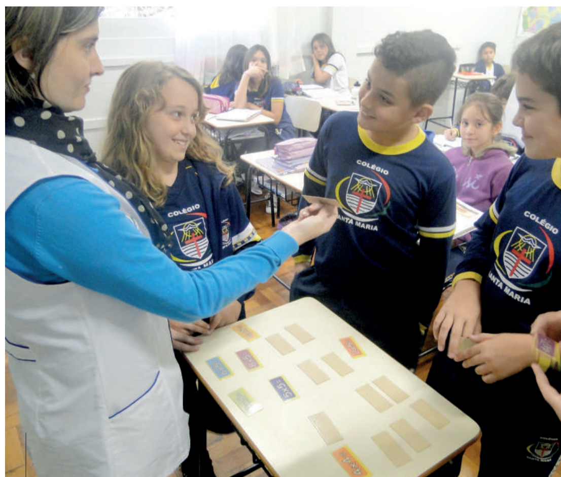
Estudantes aprenderam a tabuada em forma de jogo

vidade que oferece uma aprendizagem de forma mais lúdica e prazerosa. A metodologia auxilia o aluno na assimilação e produção do conhecimento acerca do processo do ensino e aprendizagem da tabuada", comentam as professoras.