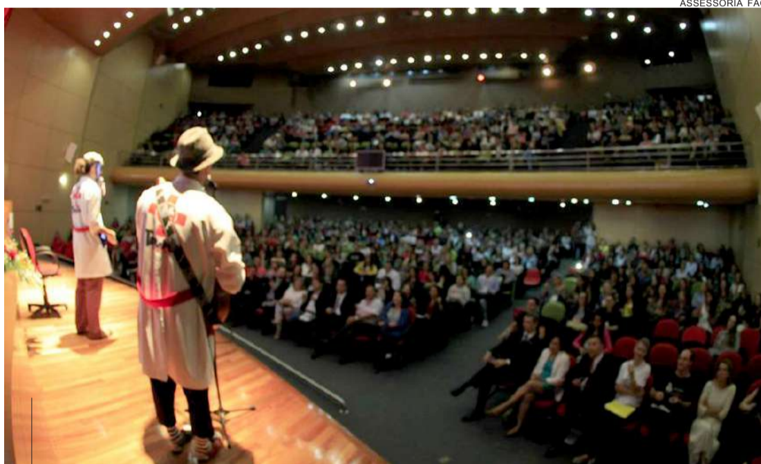
Palhaços da "Terapia da Alegria" deixaram a mensagem de que prevenir é o melhor remédio

ção Evas (Ex-vítimas de Abuso Sexual) e coordenadora do evento, avaliou como muito positivas as discussões: "Exis-