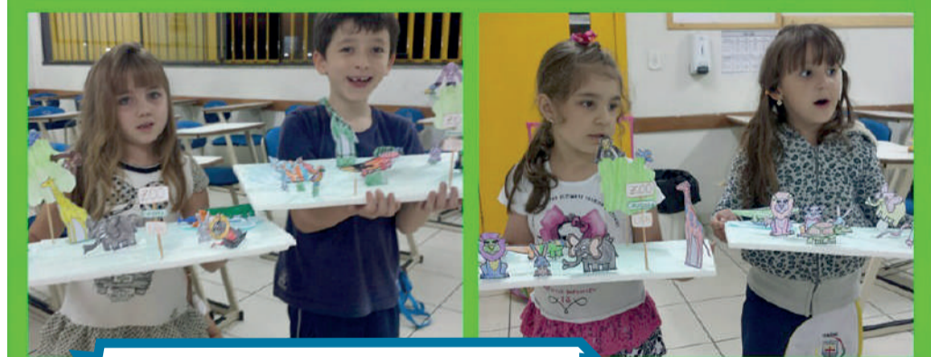
Alunos Yázigi aprendendo com projeto ZOO