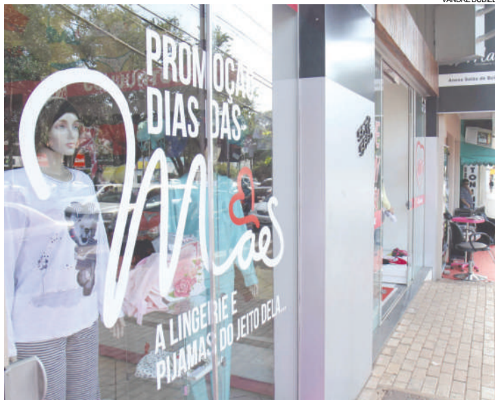
Movimento ainda é tímido, mas lojistas esperam aumento de até 30% para o fim de semana

Para se manter fora da crise, ela explica que é necessário que as lojas estejam sem-