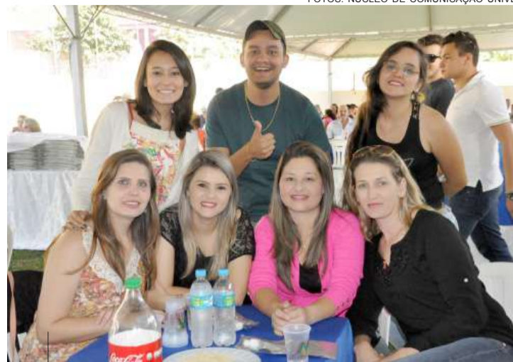
Os funcionários aproveitaram a festa

A Univel agradece a todos que participaram e deseja que no próximo ano todos estejam juntos para comemorar e fazer uma festa ainda melhor, por que na Univel você funcionário é sempre mais!