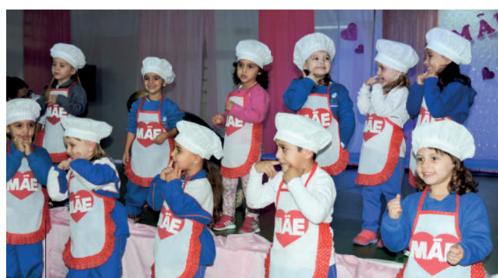
Alunos da Educação Infantil Nível IV apresentaram a canção "Come, come pra mamãe ficar contente"