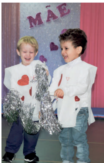
O maternal fez apresentação artística ao som de "Viva a mamãe"