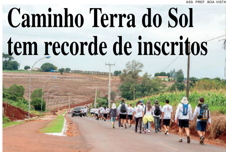
ASS. PREF. BOA VISTA

Belos cenários e contato com a natureza: caminhada cresce a cada ano