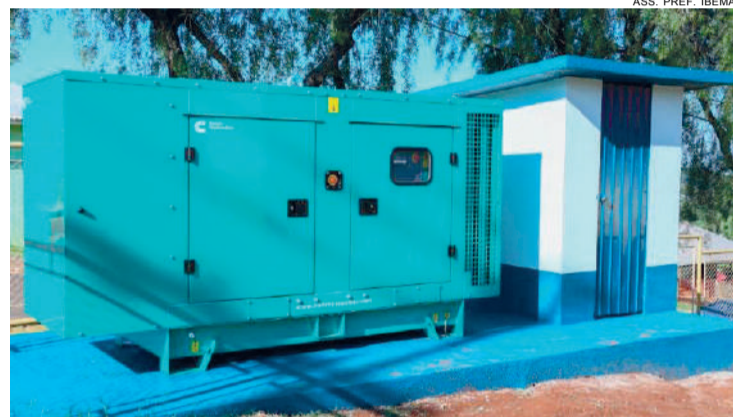
ASS. PREF. IBEMA

Com o gerador, o risco de interrupções no hospital é significativamente reduzido.