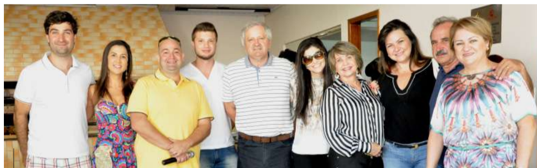
Membros da diretoria Univel