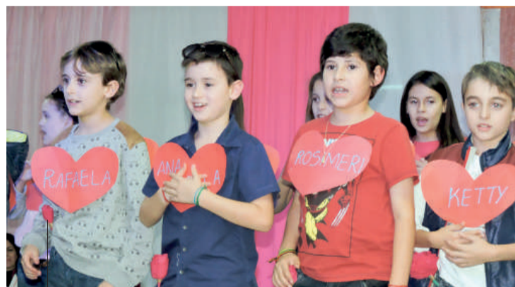
Apresentação dos alunos do 4º ano foi com letra do "Chimarruts"