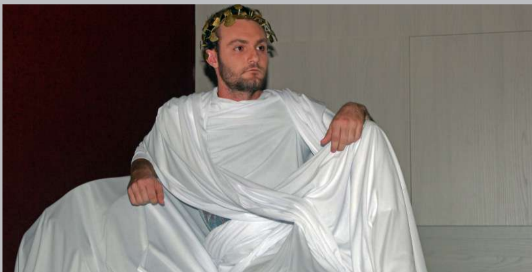
Teatralização do "Soneto 3" buscou criar a intertextualização com a obra de Narciso