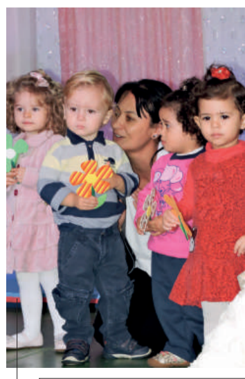
Alunos do berçário subiram ao palco e encheram de lágrimas os olhos das mães presentes