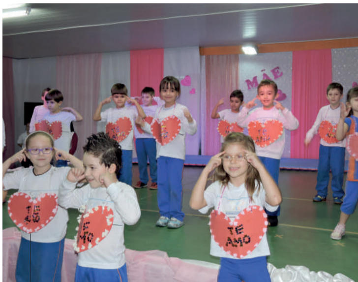
Alunos do 1º ano homenagearam as mães com a música "Tem que ser você"

As apresentações encerraram-se nesta sexta-feira com uma belíssima apresentação das alunas do balé.