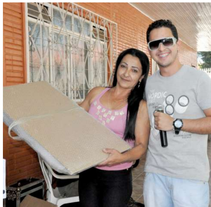
Ganhadora da televisão