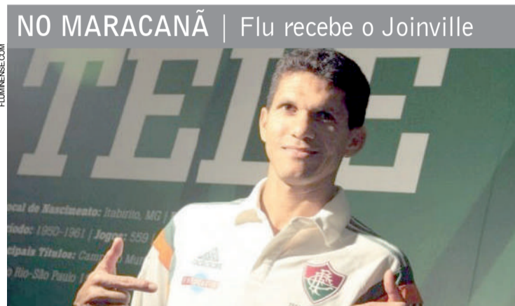
NO MARACANÃ | Flu recebe o Joinville

A Série B do Campeonato Brasileiro começa hoje para o Botafogo, que inicia a competição com a pressão de não ser o primeiro grande clube do País a não voltar à elite no ano seguinte à queda. Os desafios para o vice-campeão carioca começam às 21h em um Mangueirão lotado pelos torcedores do estreante Paysandu.