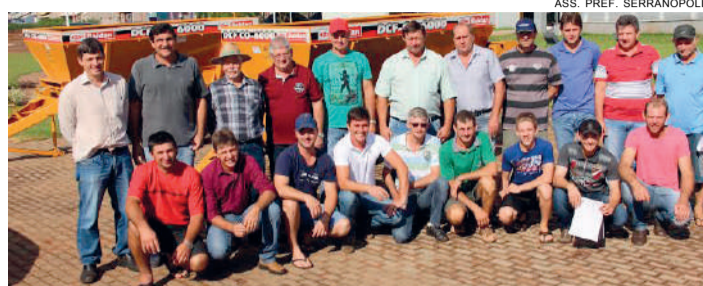
ASS. PREF. SERRANÓPOLIS

Administração pública de Serranópolis do Iguauçu acaba de realizar o repasse de mais dois equipamentos agrícolas para associações rurais do município. Foram dois distribuidores de calcário e adubo. Os dois equipamentos custaram aos cofres públicos R$ 46,4 mil. As associações que receberam esses equipamentos são as das linhas Farroupilha e do Pinheirinho.