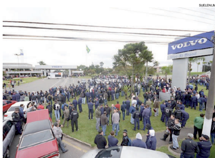
Trabalhadores da Volvo: greve por tempo indeterminado

A Volvo anunciou na quinta-feira (7) que teve de fechar o segundo turno da fábrica em função da baixa demanda no setor de caminhões. Isso gerou um excedente de 600 funcionários na fábrica. Para evitar as demissões, a empresa fez uma proposta