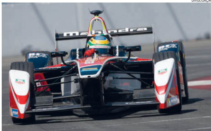
Bruno Senna diz que o carro melhorou muito depois do GP dos Estados Unidos

Mundial de Carros Elétricos da FIA. Lucas di Grassi, com 75 pontos, Nelsinho Piquet (74) e Nicolas Prost (69) são os primeiros do campeonato.