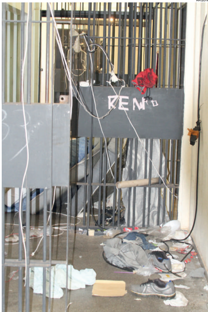
A recuperação da PEC era aguardada desde a rebelião de 2014