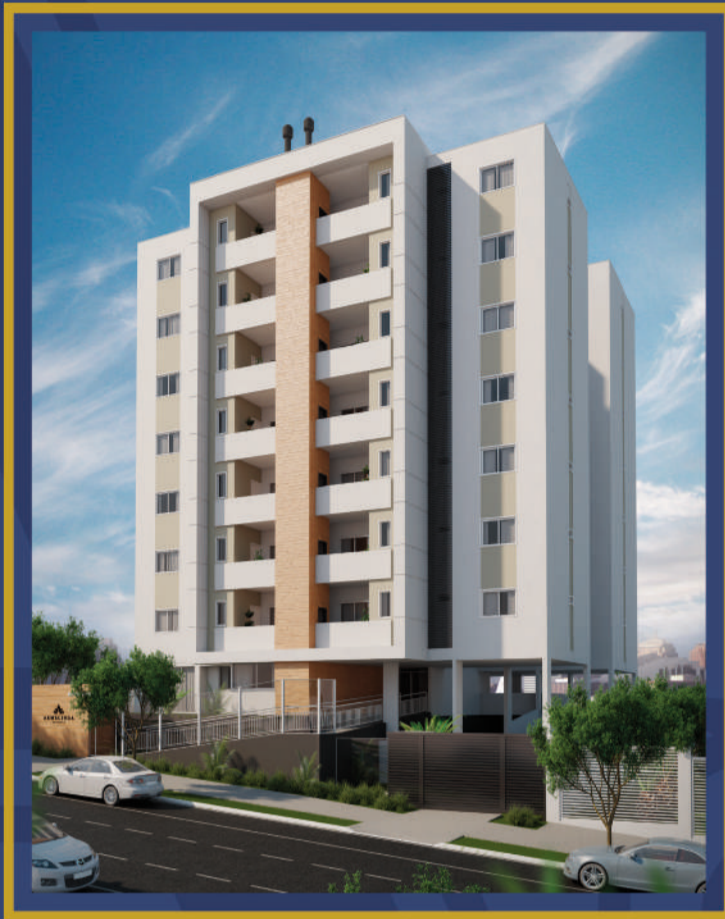
Rua Visconde de Guarapuava, 3519 (entre as ruas Hélio Richard e Mário C. Martini).