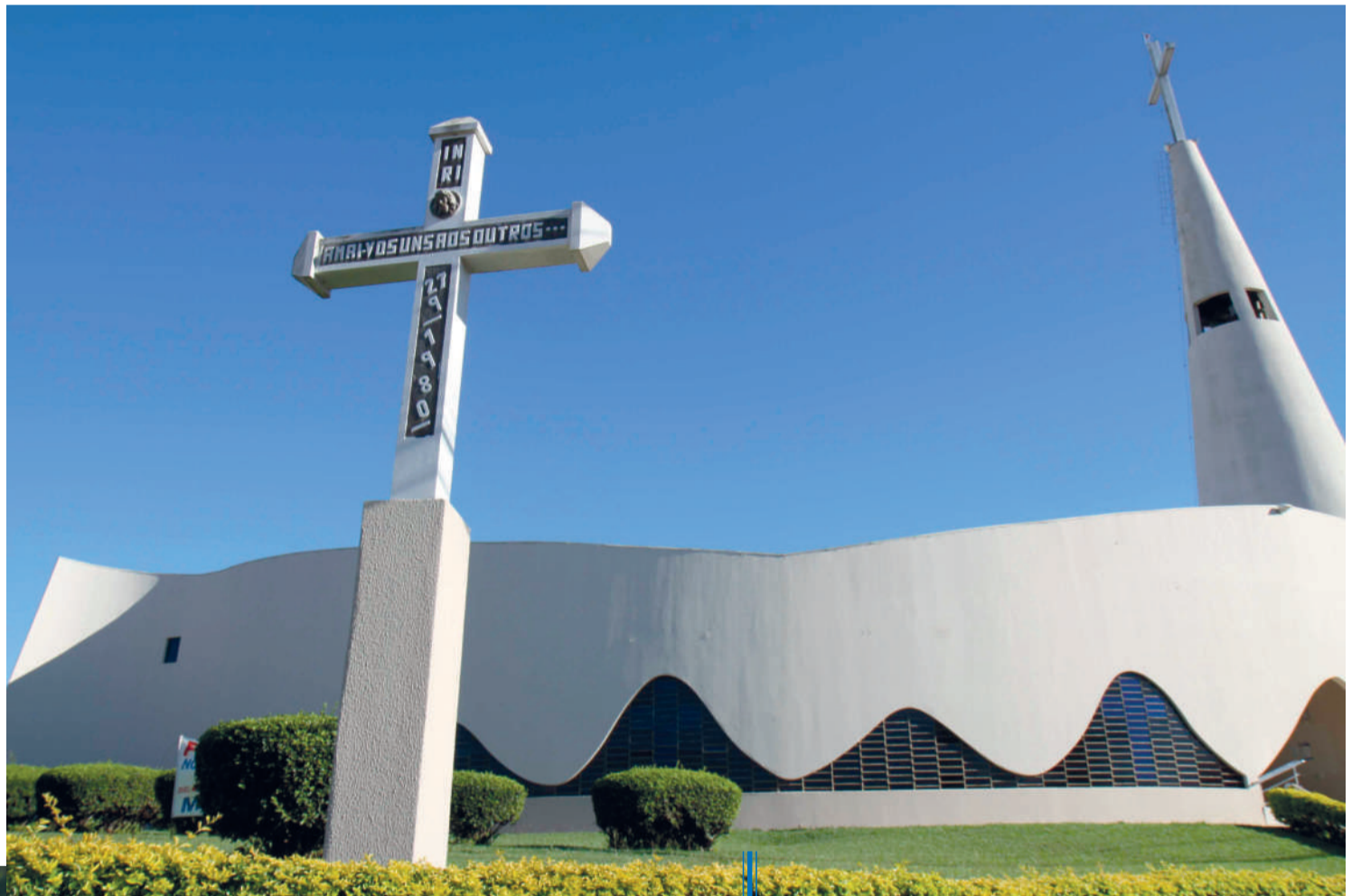
Paróquia Nossa Senhora do Caravaggio é cartão postal no bairro