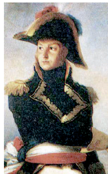
O general francês Jean Andoche Junot invadiu Portugal e caiu na armadilha da Inglaterra

No final de junho, a segunda investida sobre Buenos Aires fracassou e em setembro as forças inglesas também se retiraram de Montevidéu. Para dominar a região, a arma da diplomacia será mais eficiente.