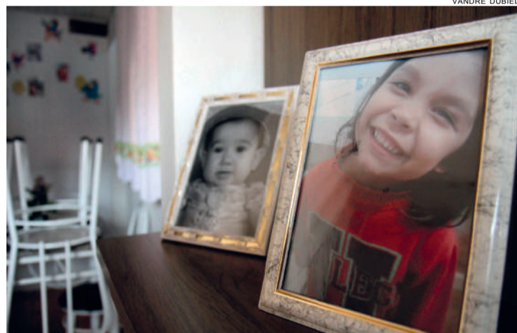
Fotos espalhadas pela casa servem para minimizar a dor da família