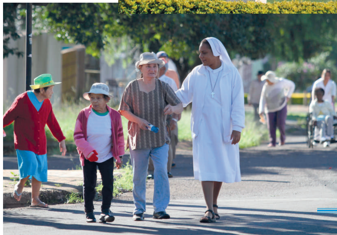
Os idosos do abrigo São Vicente de Paula aproveitam a Praça do Maria Luíza para se exercitar