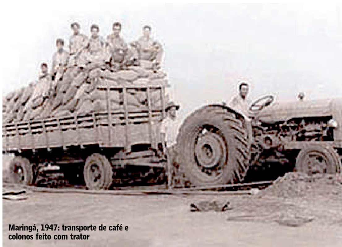
Maringá, 1947: transporte de café e colonos feito com trator