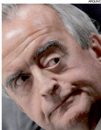
O MPF também quer que Cerveró devolva R$ 2,5 milhões à Petrobras

No pedido de condenação, o MPF requer que a pena seja cumprida por Nestor Cerveró em regime inicialmente fechado e que a prisão preventiva dele seja mantida. Além disso, também requer o pagamento de R$ 2,5 milhões como reparação de danos para os cofres públicos. O acatamento da denúncia dependerá do juiz federal Sérgio Moro.