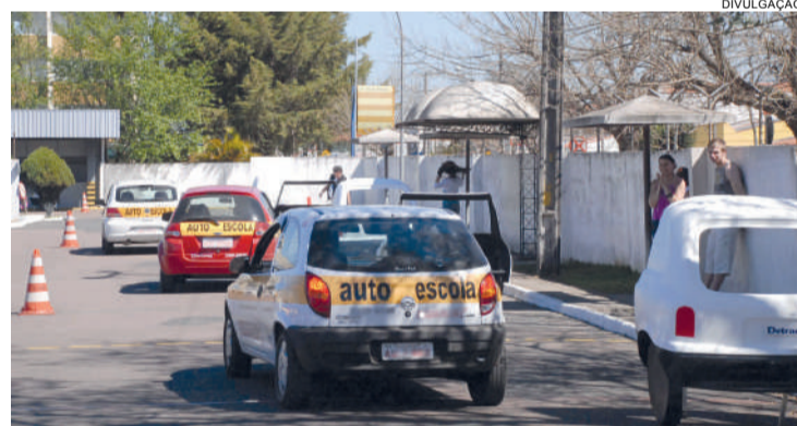
Agora, cada autoescola pode fazer o agendamento até as 15 horas do dia útil anterior ao exame prático

pode fazer o agendamento até as 15 horas do dia útil anterior ao exame. A vaga estará garantida pelo processo. Com isso, é possível desmarcar e alterar o candidato sem cobrança de nova taxa no prazo determinado.