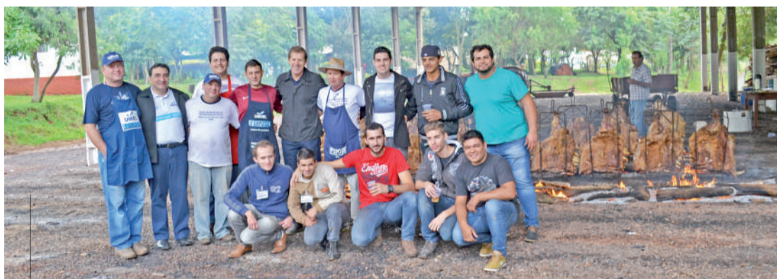
Evento teve seu encerramento com um costelão