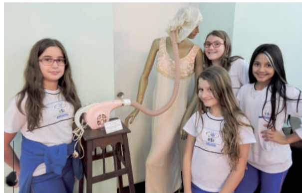
Alunas conheceram secador de cabelo da década de 60

nas pedras e na madeira e em obstáculos feitos com bambus. Por meio do tato e do olfato também foi possível sentir o formato e o perfume das plantas.