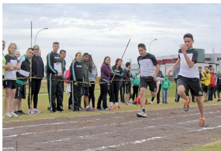
No Atletismo, as competições iniciaram com os 100 metros rasos

As 14 turmas participaram dos Jogos, que tiveram início de manhã com as competições na pista de Atletismo, além das outras modalidades realizadas no Ginásio, durante todo o dia. O evento também contou com o apoio dos professores do curso, que ajudaram os alunos na organização.