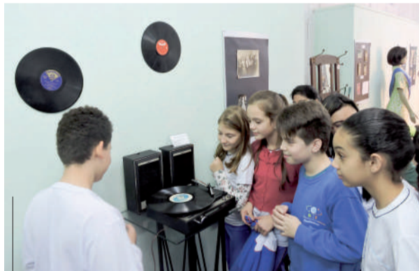
Alunos impressionados com a radiola, da década de 70, que ainda funciona