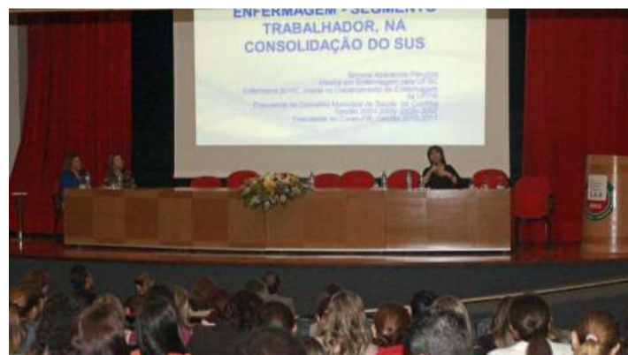
Evento trouxe para o debate a temática da Enfermagem em defesa do SUS

A programação do evento na FAG foi organizada em