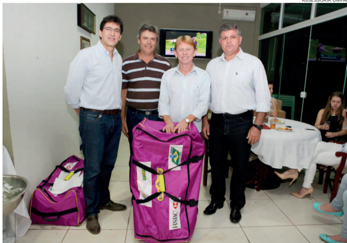
Lideranças prestigiam o evento