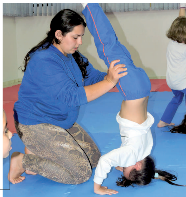
Aula trabalha com equilíbrio das crianças