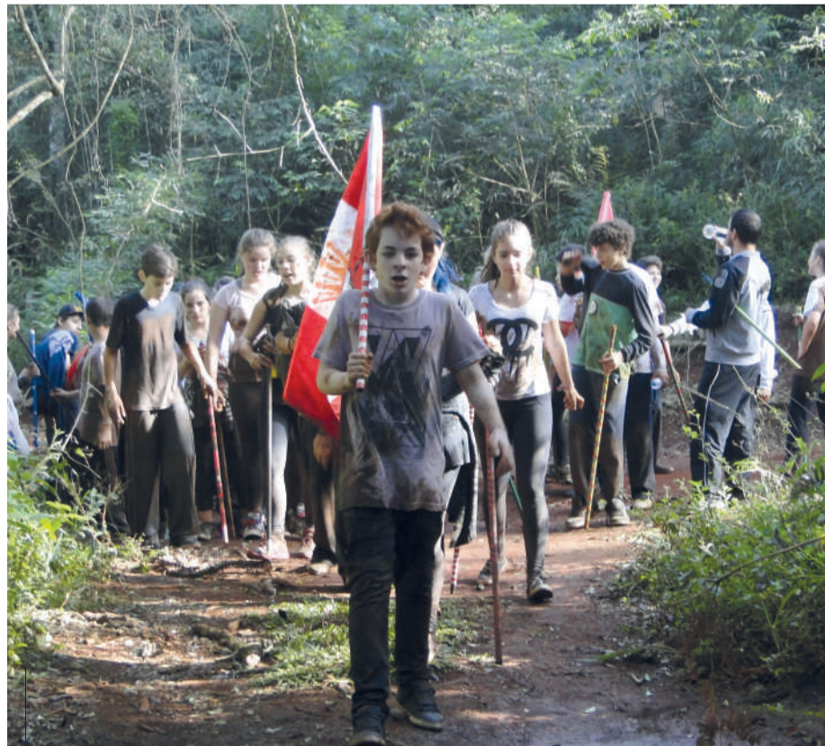
Oitavo Extremo inclui desafios por toda a natureza