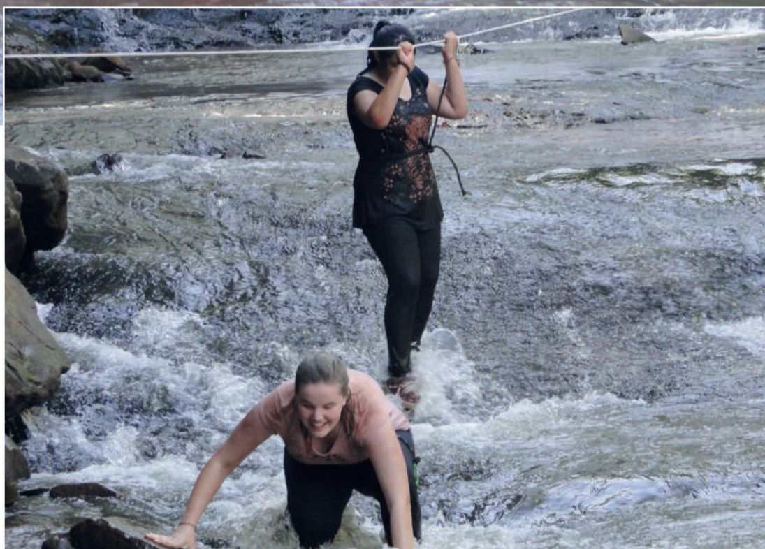
Alunos tiveram que enfrentar obstáculos na água

Para cada tarefa cumprida ao longo do trajeto, houve uma pontuação específica. A equipe que vencer todos os requisitos até a prova final que ainda está em andamento, será premiada com troféu e medalhas, que serão entregues em uma cerimônia especial, com a presença dos familiares.