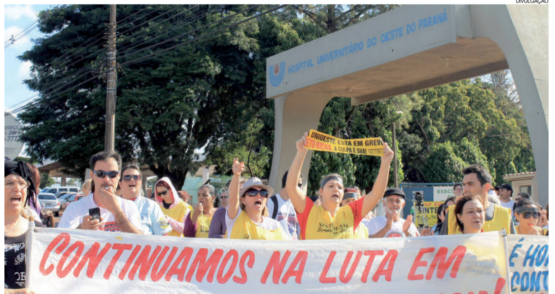
Servidores em protesto ontem em Cascavel, pedindo reposição salarial conforme a inflação

O governador Beto Richa disse ontem que considera para o índice de 5% de reajuste pro-