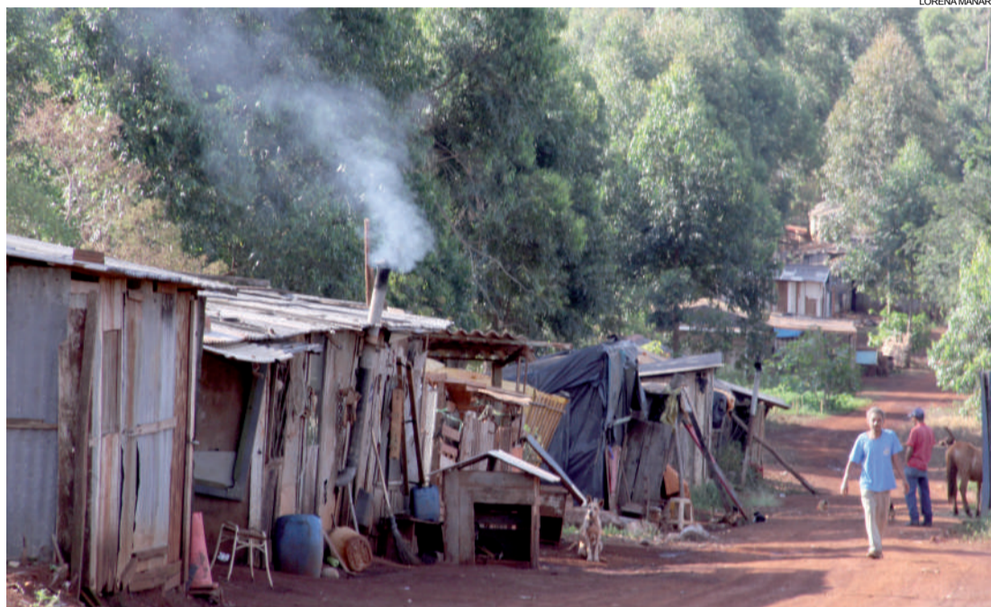
Enquanto a determinação para mudança não chega, famílias aguardam ansiosas

Em todo o Brasil estima-se que 60 mil famílias aguardam por regularização de terras. No Paraná são 6,9 mil famílias atu-