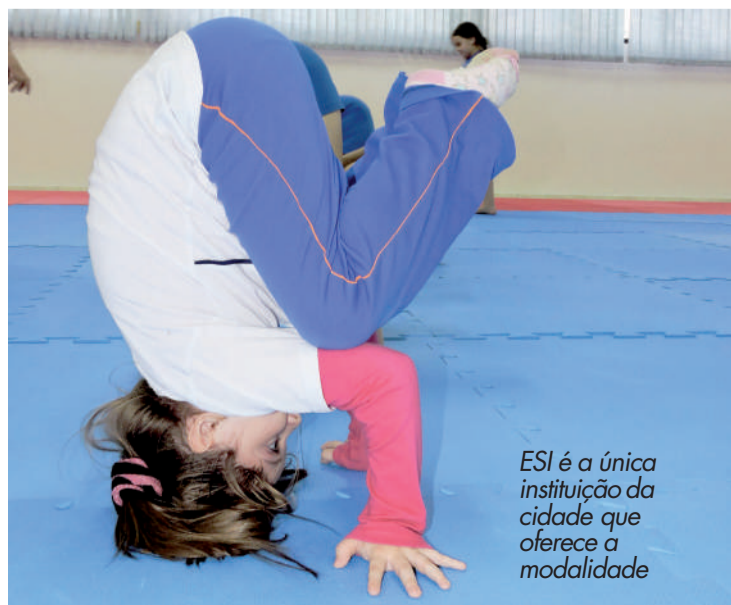
ESI é a única instituição da cidade que oferece a modalidade

As aulas são destinadas apenas às turmas de 3 a 14 anos do ESI-Auxiliadora. Informações: (45) 3225-4459.