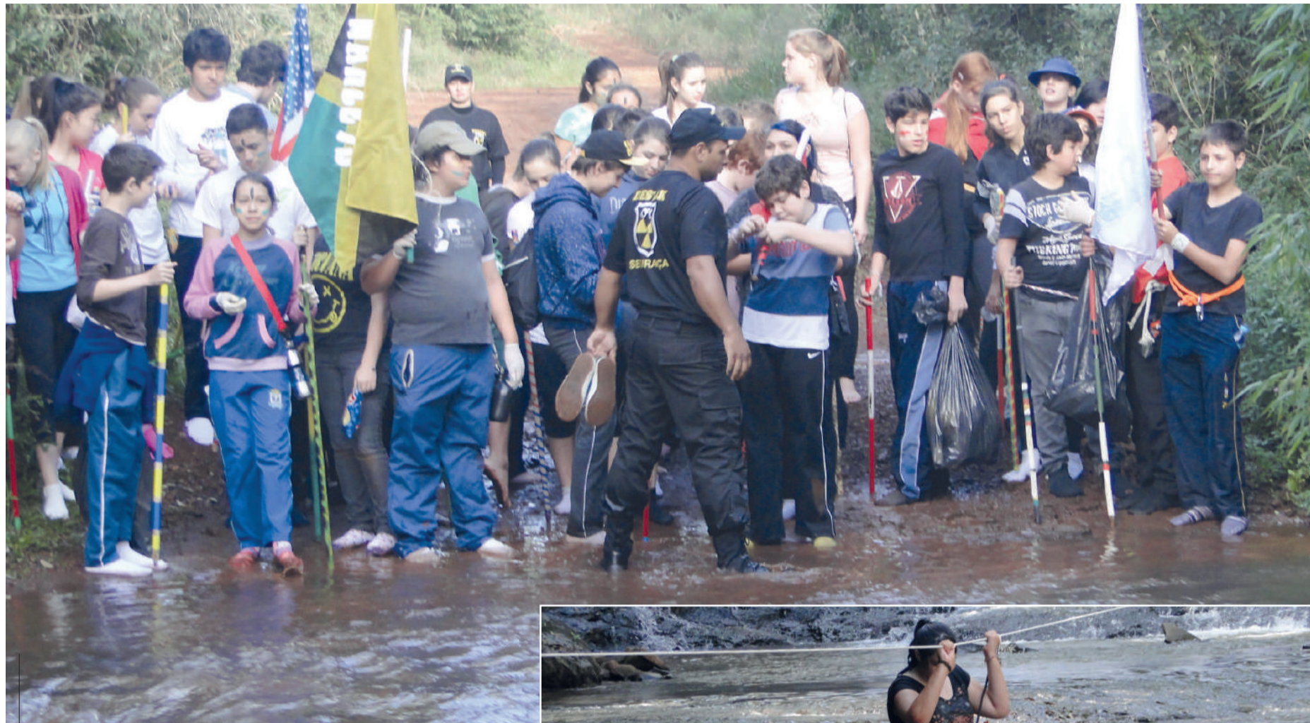
Projeto é realizado com as turmas dos oitavos anos do Colégio Santa Maria

O projeto Oitavo Extremo do Colégio Santa Maria consiste em uma aventura por trilhas com os alunos dos oitavos anos. A atividade é orientada e supervisionada por uma equipe de apoio e envolve conteúdo das disciplinas de Educação Ambiental, Ciências, História e Geografia. O projeto reforça a consciência ambiental e a discussão crítica e ecológica que se deve ter em relação aos cuidados com o meio ambiente.