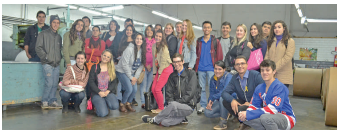
Acadêmicos do 1º semestre entraram de cabeça na produção jornalística

A ida até o veículo de comunicação foi interdisciplinar, no local os acadêmicos puderam observar os procedimentos da produção de um jornal, como impressão, diagramação e paginação relacionados à parte gráfica, e as ques-