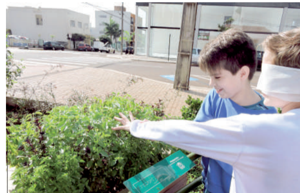
Visita incluiu passeio pelo Jardim Sensorial do Centro Cultural