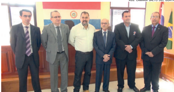
ASS. CÂMARA SALTO DEL GUAYRÁ