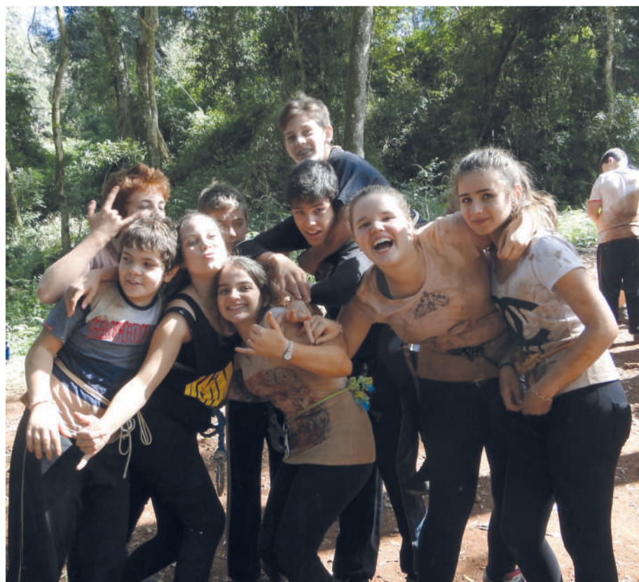
Equipes comemoraram as tarefas cumpridas