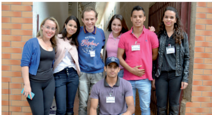
Membros da Empresa Junior