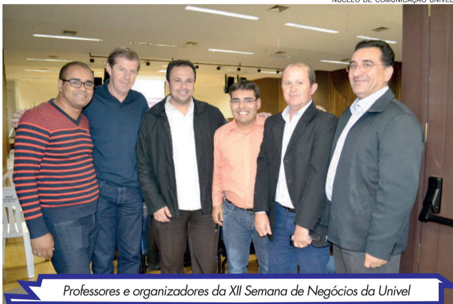
Professores e organizadores da XII Semana de Negócios da Univel