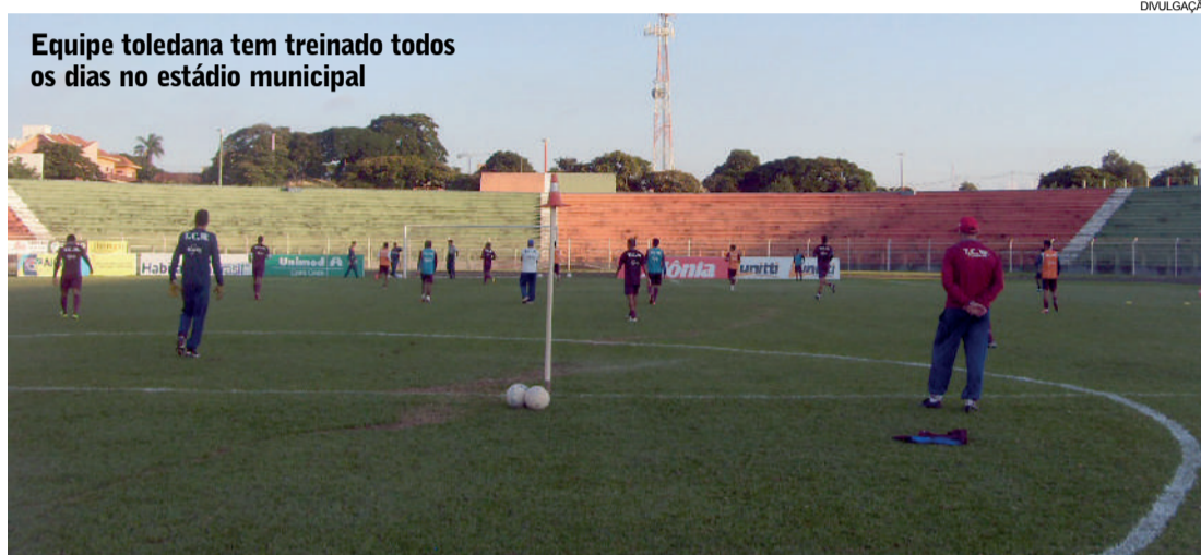
Equipe toledana tem treinado todos os dias no estádio municipal

A cobrança de Casca se justifica pelos números do Toledo