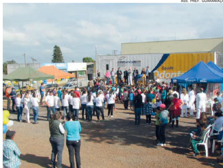
Lançamento da parceria reuniu líderes, diretores do Sesc e moradores em Guaraniaçu: dois meses de atendimentos

A solenidade de lançamento e celebração do convênio contou com a presença de autoridades e representantes do Serviço Social do Comércio de Cascavel. Durante o período em que os profissionais estarão atendendo em Guaraniaçu, estimasse que