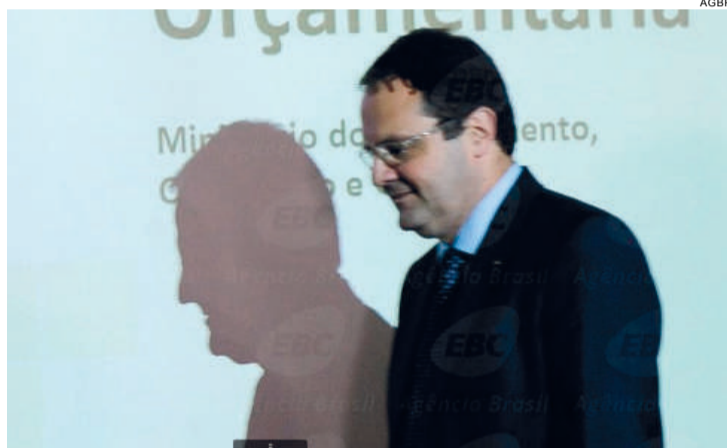
Barbosa chegando para anunciar o contingenciamento

O bloqueio das despesas orçamentárias faz parte do esforço do governo para equilibrar suas contas depois que o setor público fechou o ano passado com um déficit de R$ 32,5 bilhões – o primeiro saldo negativo em pelo menos 13 anos.