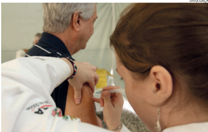
Idosos, gestantes e bebês entre 6 meses e 23 meses poderão continuar recebendo a dose contra a gripe

Em 2014, o Paraná registrou 227 casos graves de gripe e 16 pessoas morreram em decorrência da doença. A transmissão ocorre por meio do contato com secreções das vias respiratórias, elimina-