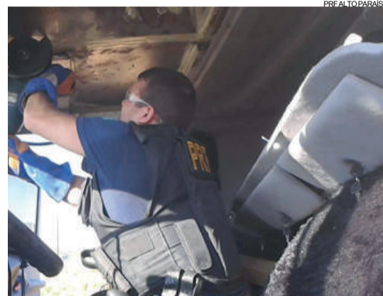
Em outra carreta a droga estava escondida no teto e na parte traseira da cabine

anos, foram presos em flagrante. No momento da abordagem os policiais constataram que ambos estavam embriagados e um deles, inclusive, já seria preso antes mesmo de que a droga fosse descoberta porque o resultado do exame do bafômetro ultrapassou o nível tolerável de álcool no organismo.