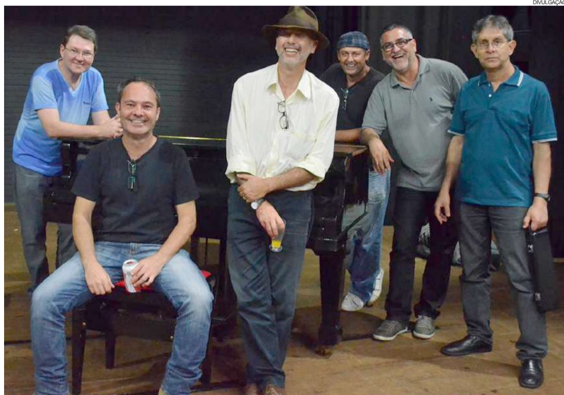
Após 25 anos, grupo Kuribi retorna aos palcos neste sábado

Vale lembrar que amanhã, as atividades continuarão no CEU das Artes, na programação do Toledo com Arte.